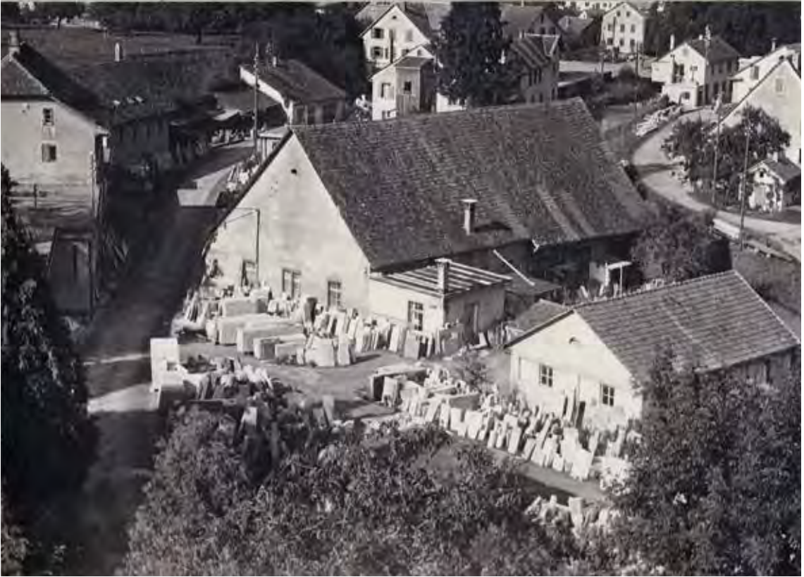
Gesamtansicht der «Marmor» um 1951. Links das ehemalige Hauptgebäude der Oberen Mühle, und in der Mitte die ehemalige Kornkammer.

Dennoch wurde das alte Mühlrad durch eine moderne Turbinenanlage ersetzt. Die «Marmor» beschäftigte zum Teil über 100 Arbeiter, was für das damals noch kleine Dietikon sehr bedeutend war. Dann aber wurde die Fabrik 1962 geschlossen, worauf die gesamte alte Baustruktur um die frühere Obere Mühle abgebrochen wurde – eine neue Wohnsiedlung wurde an ihrer Stelle errichtet.