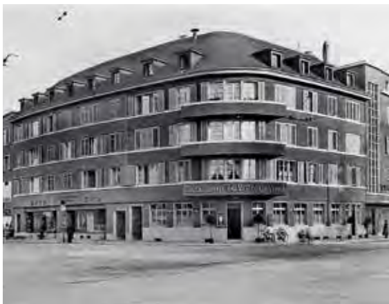
Löwen 1931 Der neue «Löwen» wurde 1931 eröffnet und bestand bis 1950.

betrug insgesamt 9000 Gulden. In eben diesem Rückkaufvertrag vom 5. September 1647 ist übrigens auch der Name «Krone» erstmals urkundlich belegt.