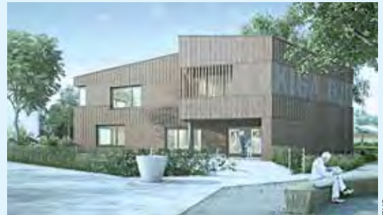
Das Kindergartenprojekt Gjuch-Chindsgi.

09. Das Dietiker Stimmvolk hat an der Urne mit 73,3 Prozent für den Kredit von Fr. 3,219 Millionen für den Neubau des zweigeschossigen Gjuch-Chindsgi und die Aufwertung der Lozziwiese entschieden.