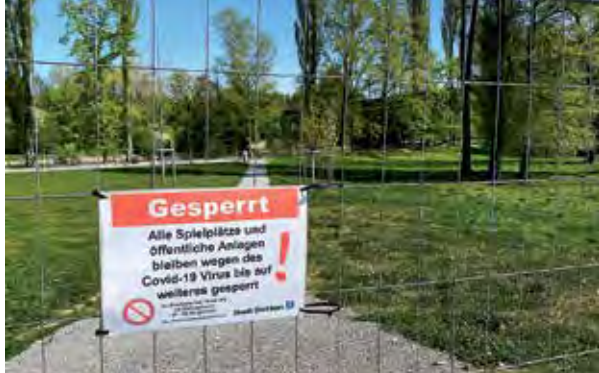
Die Allmend Glanzenberg bleibt an Ostern 2020 menschenleer.

So unerwartet und unvorbereitet die Coronakrise uns traf, so schwierig ist es, gesicherte Prognosen zu stellen. Tatsache ist, dass der angeordnete Lockdown einen Zusammenbruch des Gesundheitssystems verhinderte. Oberstes Ziel war, die Bevölkerung – Jung und Alt – vor dem Virus zu schützen. Die angeordneten Einschränkungen mussten von allen Altersgruppen solidarisch erduldet und mitgetragen werden, wenn auch nicht alle gleich vom Virus gefährdet sind. Eine zuerst befürchtete Stigmatisierung besonders gefährdeter Bevölkerungsgruppen – im Vordergrund Personen über 65 Jahren – konnte verhindert werden. Die Bevölkerung zeichnete sich mehrheitlich aus durch Verständnis für die angeordneten Massnahmen, durch Solidarität und durch den Willen zur Anpassung an die neue Situation.