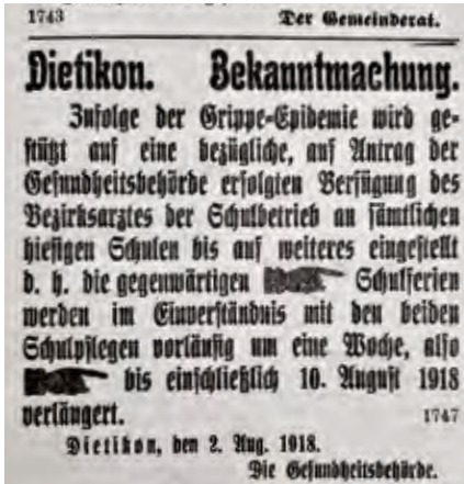
Amtliche Bekanntmachung im «Limmattaler»

Stadt, in der Ende 2019 27 431 Menschen lebten, davon fast 47 % ohne Schweizer Pass. Eine Stadt, die über 18 000 Arbeitsplätze