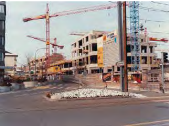
Zentrumsüberbauung in den 1980er Jahren.

Über ihre Augensalbenstempel lassen sich zumindest ansatzweise auch Rückschlüsse auf die praktizierenden Augenheilkundler ziehen. Die Befunde legen nahe, dass viele dieser Spezialisten wohl aus dem Nordwesten des Römischen Reiches kamen; immerhin fällt auf, dass alle bis heute mehr als 314 bekannten Stempel ausschliesslich in den Gebieten nördlich der Alpen und in Britannien gefunden wurden. Dass ganz offensichtlich auch am Gutshof von Dietikon einmal ein solcher Augenarzt tätig war, passt somit in den historischen Zusammenhang.