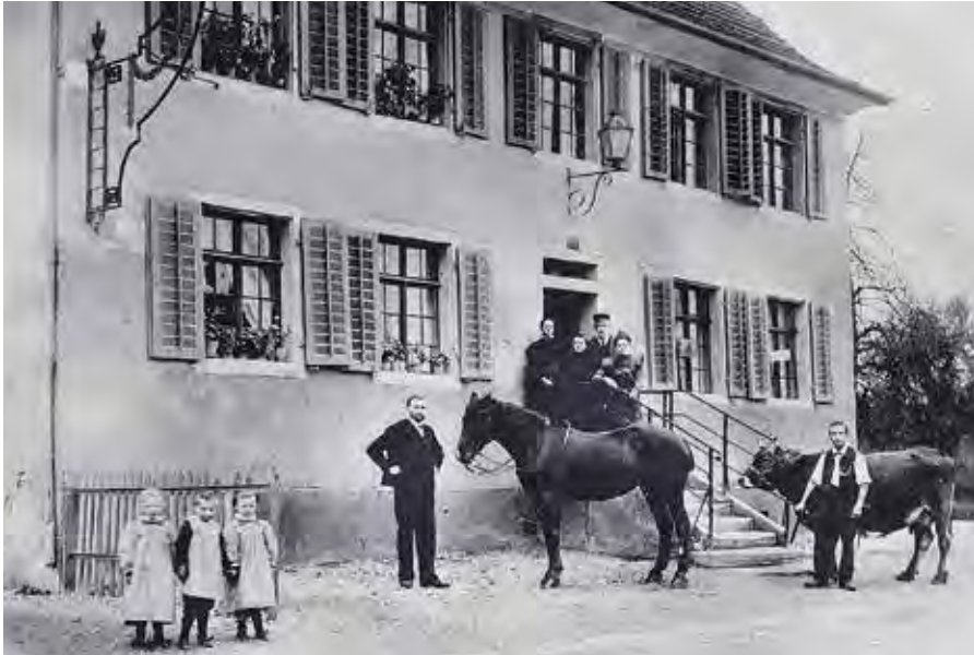
Löwen 1905 Das Gasthaus brannte 1912 zur Hälfte nieder.