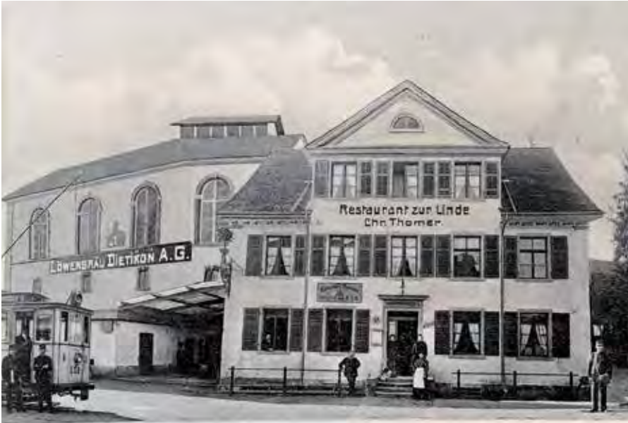
Linde 1905 Das Gasthaus erhielt erst bei der Renovation von 1909/10 ihr heutiges Aussehen.

immer noch die einzige Taverne im Dorf Dietikon. Doch der Fuhrwerk- und vor allem der zunehmende Postkutschenverkehr entwickelte sich um die Jahrhundertwende solchermassen (allein der Postkutschenkurs Zürich-Baden verkehrte ab 1809 dreimal wöchentlich durch Dietikon), dass die «Krone» den Anforderungen bald nicht mehr genügte. Also wurde das Kloster Wettingen im Jahre 1812 von der aargauischen Regierung angehalten, in Dietikon eine zweite Taverne errichten zu lassen – das Gasthaus «Löwen» gegenüber dem Kirchplatz. Die dritte Taverne war schliesslich die «Linde» an der heutigen Badenerstrasse, welche um 1835 eröffnet wurde.