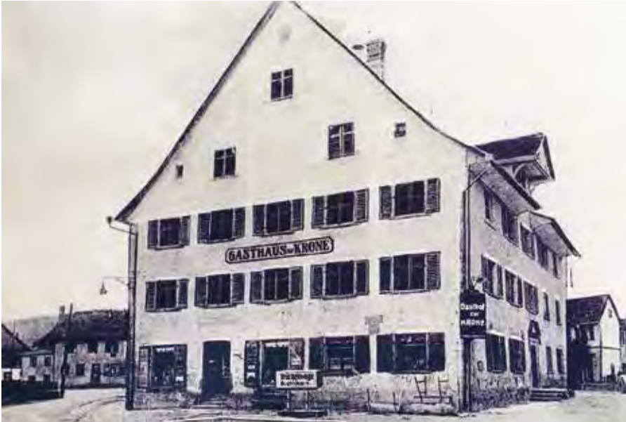
Krone 1915 Davor die alte Brücken- waage zum Ermitteln des Ladegewichts von Fuhr- werken.

Wirt um die Zeche zu prellen und sich ohne zu bezahlen aus der Taverne entfernt hatte. Ungestraft sollte der Gast nur dann bleiben, wenn er anderntags bis 06:00 Uhr morgens («prim zytt») freiwillig zurückkehrte und dem Wirt das Geschuldete nachzahlte. Wenn sonst allgemein der Wirt mit jemandem in ernsten Streit geriet, sollte der Fall vor dem Gericht des Klosters Wettingen verhandelt werden.