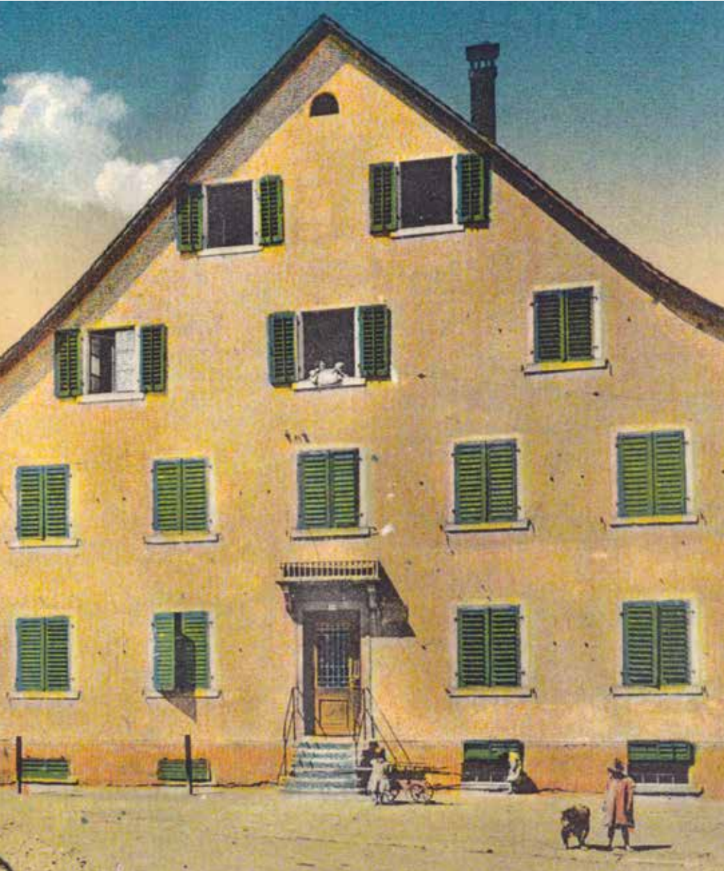
Krone 1912 Entlang der alten Hauptstrasse fährt ein Wagen der «Limmattal- Strassen- bahn». Rechts der «Alte Bären».