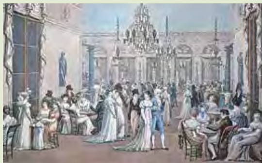
Die ersten französischen Restaurants waren Bouillon-Läden.