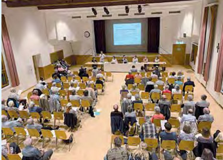
Die katholische Kirchengemeinde stimmt dem Verkauf des «Bären» zu.

für den Umbau des alten Bauamts wird hingegen knapp abgelehnt mit 16 Nein- und 15 Ja-Stimmen bei 2 Enthaltungen und damit auch der Chindsgi und die zwei Wohnungen, die im Gebäude Platz gefunden hätten. Wie es mit dem alten Bauamt, das im Inventar der schützenswerten Bauten aufgenommen ist, weiter geht, wird sich zeigen.