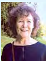
Zusammengestellt von Julia Hirzel