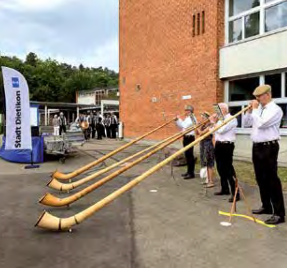
Die wandernde Augustfeier in den Quartieren.