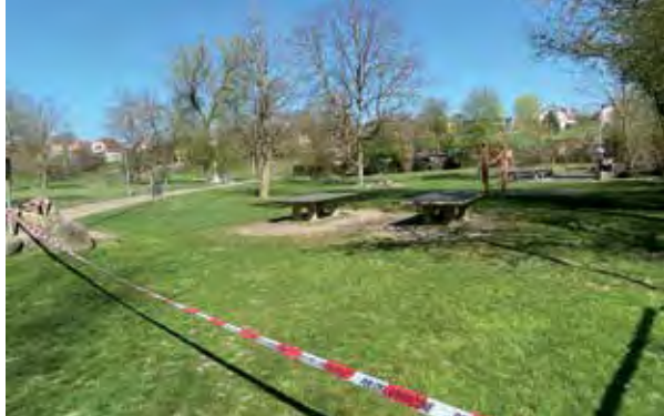
Abgesperrte Grunschen während der Ostertage 2020

Bis dann bedeutet es, dass notgedrungen mit dem Virus gelebt werden muss und situationsbedingte Empfehlungen, Schutzmassnahmen und Einschränkungen eingehalten werden müssen. Leben mit dem Virus heisst aber auch, mit Verunsicherung umgehen und gleichzeitig nach Normalität streben.