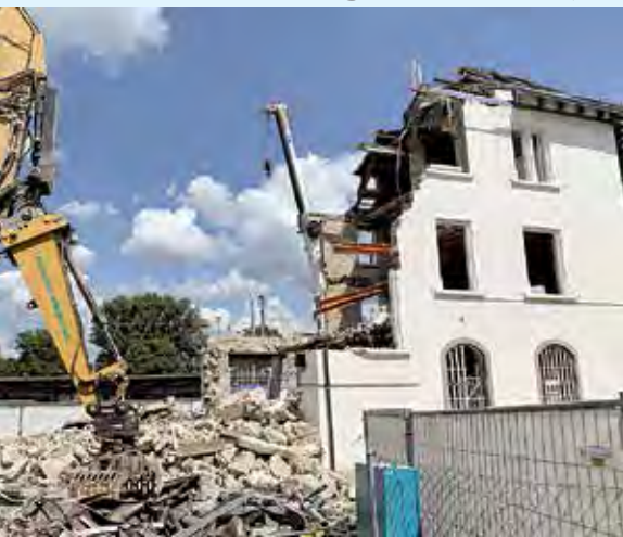
Abbruch des Boeniger-Hauses am 24./25. Juni.