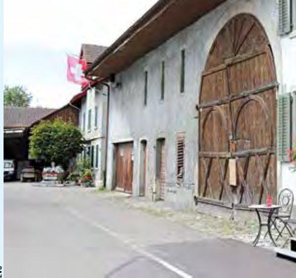
Die alte Zehntenscheune im alten Dorfzentrum.

und ab 2022 auch die Limmattalbahn betreibt, eingereicht. Auch die Stadt Dietikon hat Einspruch erhoben. Der Stadt fehlt vor allem der Nachweis, dass die Ochsenkreuzung für den öffentlichen und Individualverkehr leistungsfähig bleibt und beanstandet die Kostenverteilung des entstehenden Kreisels.