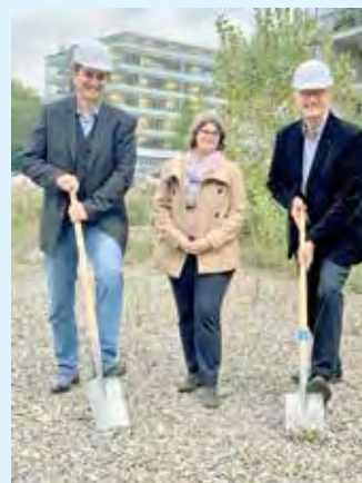
Spatenstich im Limmatfeld.

1. Für die 174 Primarschulkinder und Oberstufenschüler aus dem neu entstandenen Quartier Limmatfeld soll der Schulweg im nächsten Sommer kürzer werden. Zurzeit besuchen sie