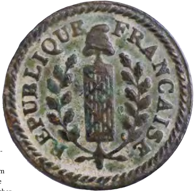
Der reich verzierte französische Uniformknopf. Er wurde im Hardwald gefunden und gelangte 1916 in den Besitz des Ortsmuseums Dietikon.