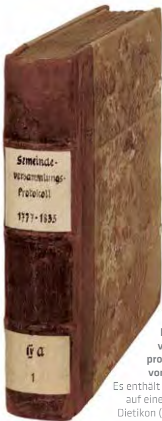
Das Gemeinde-versammlungs-protokoll Dietikon von 1777 bis 1835. Es enthält keinen Hinweis auf eine Hungerkrise in Dietikon (siehe Seite 29).

fiel die Ernte im Herbst 1817 dann aber wieder reichlich aus, und endlich begannen die Getreidepreise wieder zu sinken.