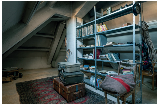
Abb. 2: Einblick in das Escape Game „Schnebelhorners Vermächtnis“ (Quelle: Zentralbibliothek Zürich)

plexen Umgebungen (complex) die Anforderungen, die Technik oder auch beides so unklar, dass keine vorherrschende Praxis besteht und kein Expertenwissen alles abdecken kann. Ursachen und Wirkungen sind erst rückblickend ersichtlich. Aus diesem Grund ist es bei der Entwicklung von komplexen Produkten unabdingbar, immer wieder empirisch zu überprüfen, ob die Entwicklung auf einem richtigen Weg ist oder nicht, um sie basierend darauf kontinuierlich anzupassen. Nur so kann garantiert werden, dass man die Anforderungen stets berücksichtigt und Entwicklungstechnologien nutzt, die auch wirklich zielführend sind. Unter komplexen Voraussetzungen hat deshalb ein agiles Vorgehen in der Produktentwicklung klare Vorteile gegenüber einem linearen Entwicklungsprozess. Der Bereich des Chaotischen (chaotic) beschreibt indes einen Zustand, in dem es unmöglich ist, überhaupt empirisch zu testen oder anzupassen. Dies trifft z. B. dann zu, wenn es unkontrollierbar viele Stakeholder mit noch mehr verschiedenen Anforderungen gibt oder keine Möglichkeiten oder Ideen für bestimmte Entwicklungstechnologien bestehen. Dies kann auch abhängig von den Kompetenzen eines Teams sein, z. B. wenn die Anforderungen nicht verstanden werden und die Technologie komplett unbekannt ist.