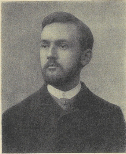
Meyer-Lübke in Jena

umfassendes Lehrgebiet auf regen Zuspruch hoffen, weil in dem Zentrum der Habsburgischen Monarchie — mit seinen Jahrhunderte alten italienisch-spanischen Traditionen, aber auch mit seiner Orientierung nach dem Osten — das Italienische wie das Rumänische und das Serbokroatische als Sprachen, die innerhalb der Grenzen des Reiches offizielle Anerkennung besaßen, im Lehrkörper der Universität durch hervorragende Forscher oder Lektoren vertreten waren. Nicht weniger aufschlußreich ist weiter die Tat-