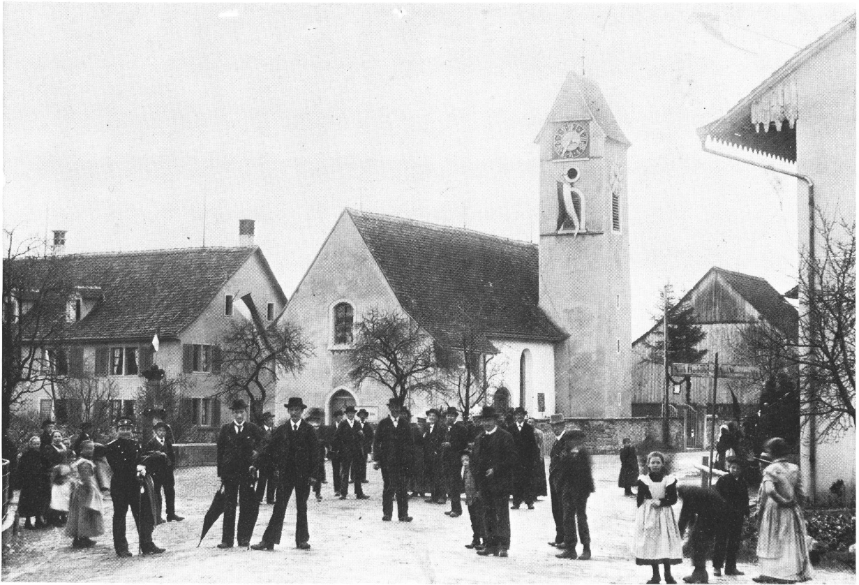
Der Dorfplatz von Dällikon um die Jahrhundertwende. Links von der Kirche steht das alte, 1970 abgebrochene Pfarrhaus. Das Bild wurde anlässlich der Einweihung der Fahne des Schiessvereins Dällikon am 16. April 1899 aufgenommen.