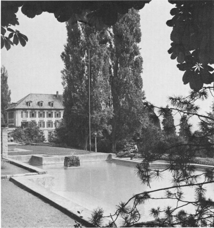
Das alte Hauptgebäude des Sanatoriums von Süden; im Vordergrund Kreuzstrasse und Alte Landstrasse.