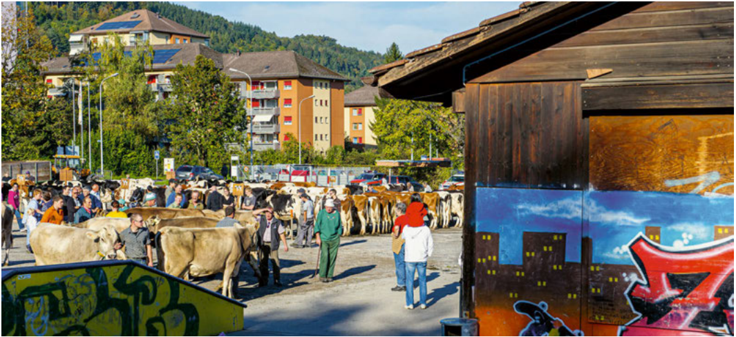
Viehausstellung auf der Allmend Horgen, 2012.

gen» im Anzeiger des Bezirkes Horgen publiziert. Sie war für die Durchführung der Prämierungen verantwortlich und rief ihre Mitglieder auf, recht zahlreich mit ihrem prämiierungswürdigen Vieh zu erscheinen. 55 Kühe, 22 Rinder und 13 Zuchtstiere wurden 1904 vorgeführt. Im Rahmen der Berichterstattung wurden auch diejenigen Viehbesitzer, die nicht Genossenschaftsmitglieder waren, aufgerufen, der Genossenschaft beizutreten, um die Grundidee der Viehzucht zu unterstützen. Mit Beschluss vom 5. September 1927 fusionierte die Genossenschaft zur Hebung der Viehzucht mit dem Landwirtschaftlichen Verein Horgen und löste sich auf.