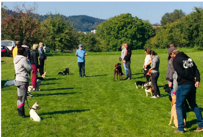
Hundeschule Happy Dog.

Im Junghundekurs werden die sieben wichtigsten Kommandos gelernt: Sitz, Platz, Steh, Hierher, Aus, Fuss und Nein!