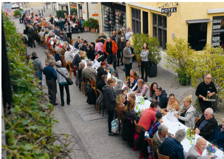
Horgens längste Tafel, Sitzkultur Horgen-Glarus, 2019.