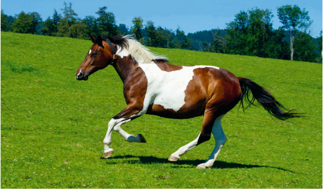
Im Galopp über die Stutenweide im Moorschwand, 2020.