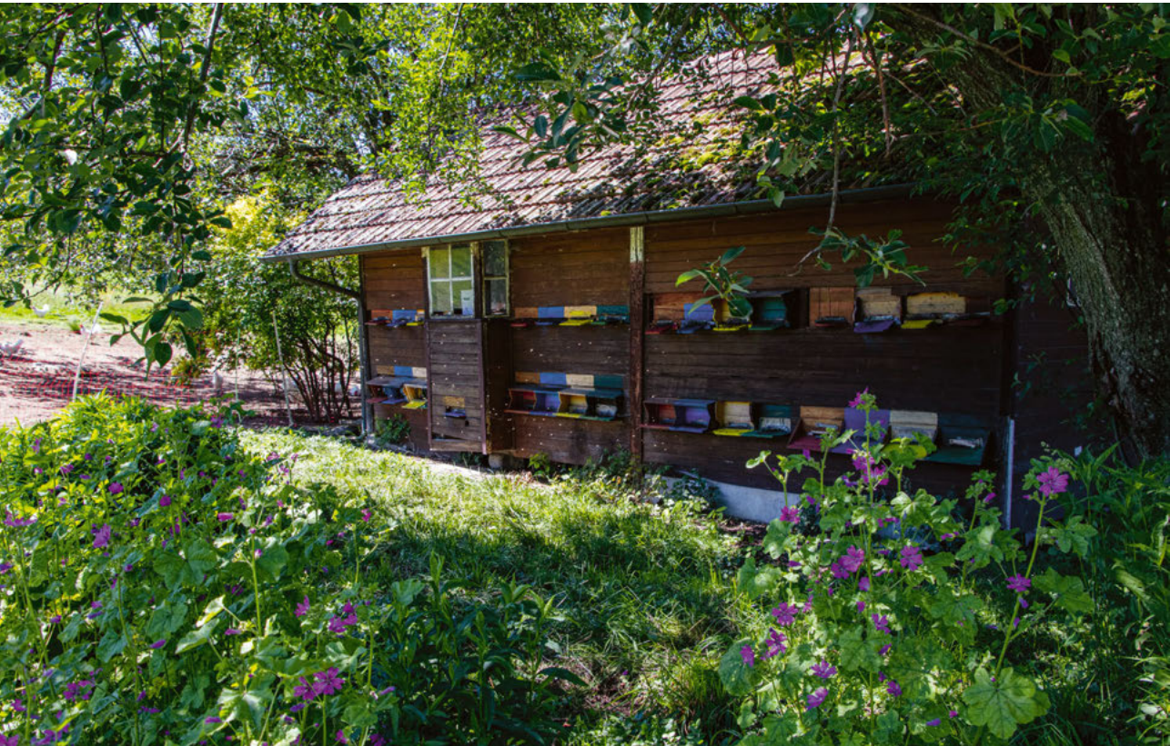
Bienenhaus Hof Matte im Arn, 2020.

werden. Diese Gewinnung ist für ein Bienenvolk sehr stressig und wird daher von naturnahen Imkern eigentlich abgelehnt. Eingesetzt wird der «Gelée Royale» meist in Kapselform in der traditionellen Medizin und in der Naturheilkunde. Ein Kilogramm davon kann bis zu 150 Franken kosten.