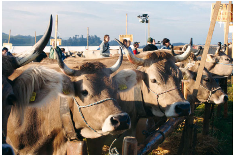
Viehschau Rothus Hirzel, 2015.

schau. Im Jahr 2000 fusionierten die beiden Genossenschaften im Braunviehzuchtverein Hirzel. Kurz darauf, 2013, wurde der Verein in Viehschauverein Hirzel umbenannt. Grund war das seit 2012 an der Schau teilnehmende Rot- und Schwarzfleckvieh.