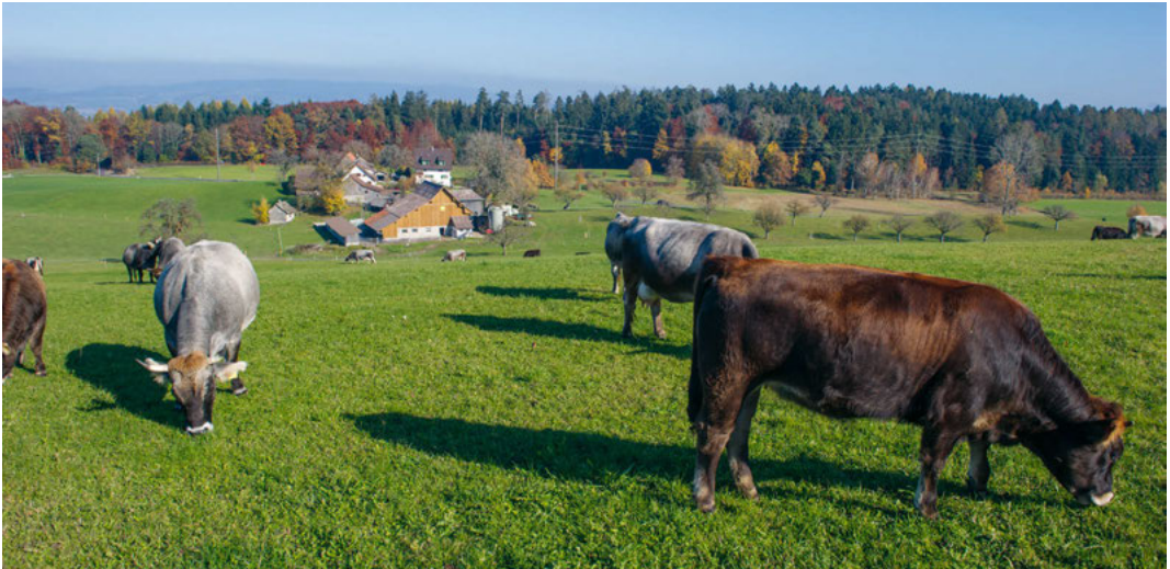
Hof Büel, 2020.

Die Mutterkühe und ihre Kälber werden in einem Freilaufstall von etwa 200 Quadratmetern gehalten, dieser hat zusätzlich einen Aussenbereich von nochmals 100 Quadratmetern. In diesen Bereichen können sich die Tiere frei bewegen und sich sowohl im Sommer wie auch im Winter drinnen oder draussen aufhalten. Dies entscheiden die Kühe je nach Wetter selbst.