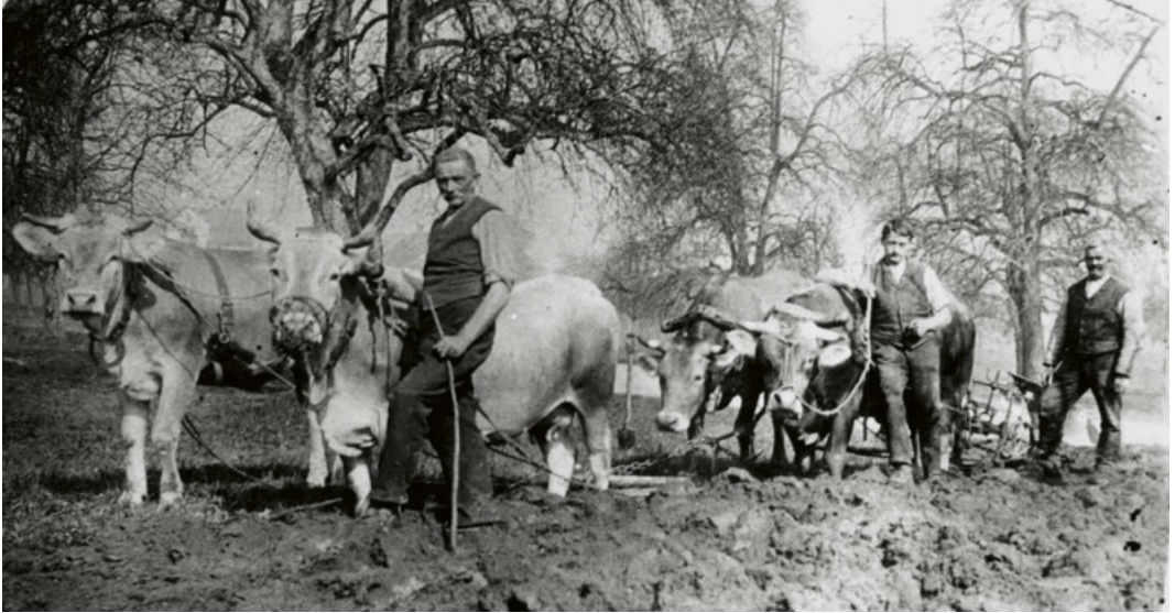
Ackergespann im Tannenbach, um 1912.