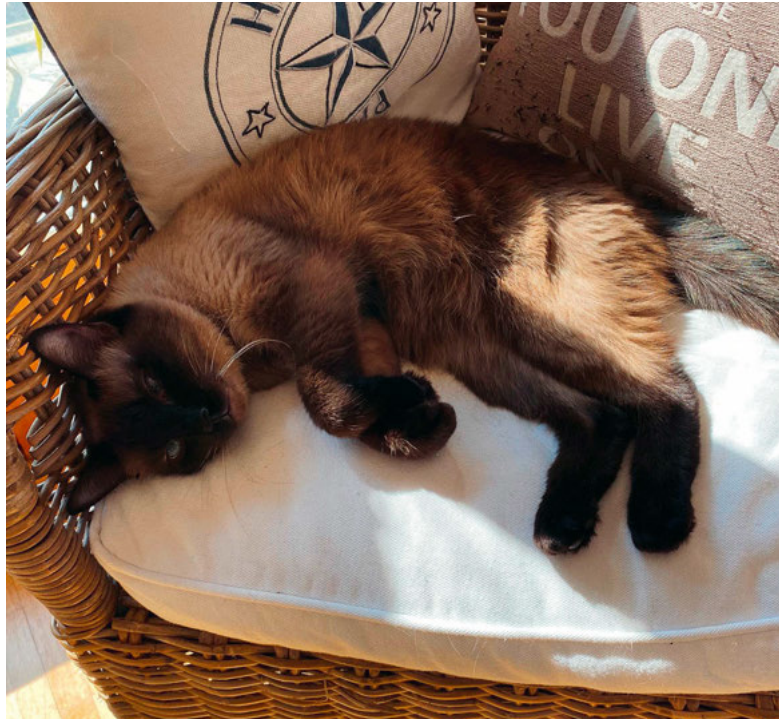
Zeit zum Ausruhen.

Die Domestizierung von Katzen vor ein paar Tausend Jahren erfolgte einerseits durch die Katzen direkt. Diese hielten sich in der Nähe der ersten Siedlungen auf und fanden dort Nahrung. Dann aber auch durch den Menschen, sowohl als Nutztier und offenbar auch als Nahrung. Letzteres ist in unserem Kulturkreis kaum mehr vorstellbar.