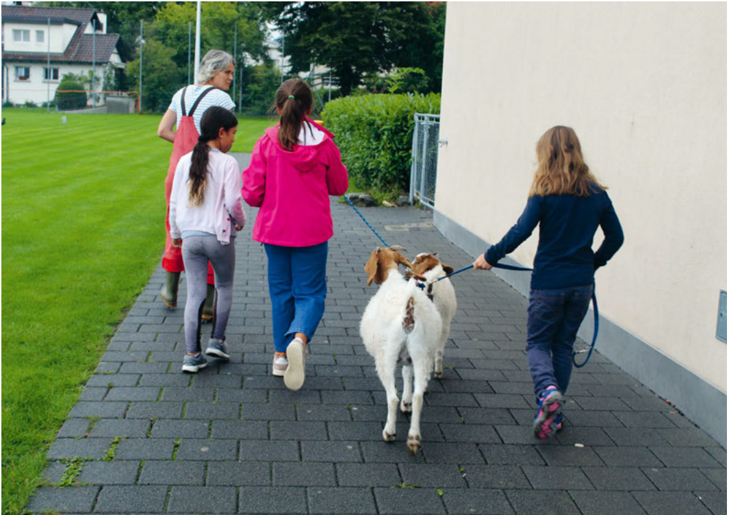
Spaziergang mit Flora und Flöckli durchs Quartier.

heitsförderung in der Schule» samt Blumenstraus und einem namhaften Beitrag für schulische Projekte in Empfang nehmen. In der Medienmitteilung der Pädagogischen Hochschule Zürich vom 8. April 2016 stand dazu: «Ausgangspunkt in der Schule Tannenbach war ihr neu gesetzter Schwerpunkt ‹Psychosoziale Gesundheit der SchülerInnen›. Das Hauptziel des Projektes lautete: ‹Wir erhalten das positive Schulklima und fördern es weiter›. Mit der Einrichtung eines Streichelzoo sollen Kinder wichtige Lebenskompetenzen erwerben und Verhaltensregeln im Umgang mit Tieren befolgen. Die Jury überzeugte insbesondere die Umsetzung der Kriterien Partizipation, Chancengleichheit und Empowerment sowie das gut dokumentierte und gelungene Projektmanagement.»