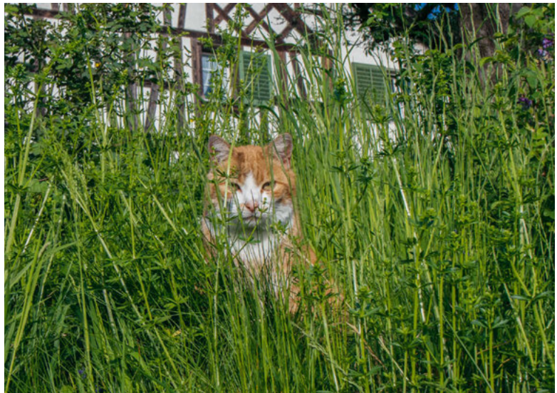
Katze im oberen Hühnerbühl.

Aufgewachsen auf einem Bauernhof liebten wir unsere Büsis über alles. Aber es war ganz klar, die Katzen mussten in der Scheune, im Stall und auf den Wiesen nach Mäusen jagen. Dies war ihre Hauptaufgabe, und deshalb hielten wir in erster Linie Katzen. Verwöhnt wurden sie mit Streicheleinheiten, aber nicht mit Leckerbissen.