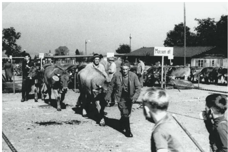
Viehausstellung auf der Allmend Horgen, 1967.

Auch im Hirzel wurden Genossenschaften gegründet. Wie anderswo hatten auch sie die Idee, die Braunviehzucht, deren Ursprung im Kloster Einsiedeln zu finden ist, nachhaltig zu fördern. Am Palmsonntag, 9. April 1911 gründeten 26 innovative Hirzler Bauern die Braunviehzuchtgenossenschaft Hirzel. Sie führte das Zuchtbuch und hielt den Genossenschaftstier, der lange prägend für die Hirzler Braunviehzucht war. Fast alle Bauern hatten Nachkommen dieses Zuchtstiers im Stall, dessen Beschaffung allerdings grosse Diskussionen ausgelöst hatte. Die andere Genossenschaft war diejenige zur Hebung der Braunviehzucht im Hirzel. Sie war, analog Horgen, verantwortlich für die Durchführung der Vieh-