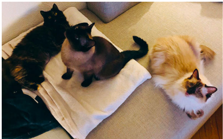
Die hungrige Katzenfamilie.

Zu guter Letzt: Eine Hauskatze als Teil der Familie kann sehr viel Freude bereiten, ist aber eine Verpflichtung, die der Halter beziehungsweise die Halterin mit der Anschaffung über eine lange Zeit eingeht.