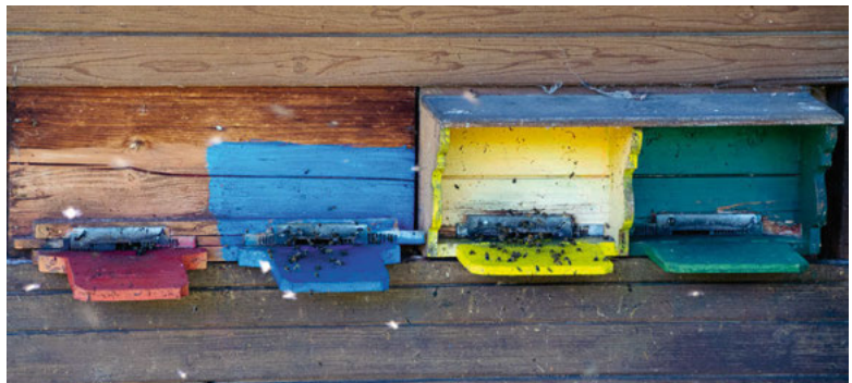
Eingangspforte nur für Bienen, 2020.