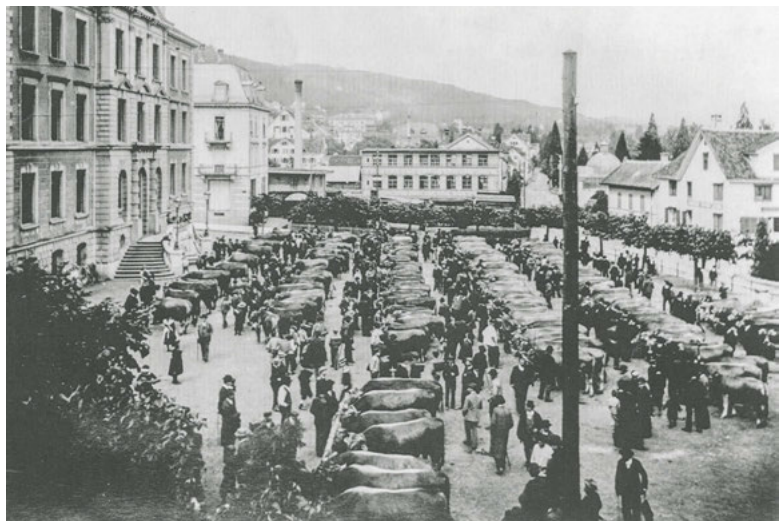
Viehausstellung auf dem alten Schulhausplatz, 1912.

Damit war der Grundstein für die eigenständige kommunale Horgner Viehschau gelegt. Der 1854 von der Älteren Lesegesellschaft gegründete Landwirtschaftliche Verein Horgen-Hirzel gab 1904 den Anstoss zur Gründung einer Viehzuchtgenossenschaft, die sich die Förderung und Verbesserung der Braunviehrasse zum Ziel setzte. Dies also erst fünf Jahre nach der von der Gemeinde finanziell unterstützten Viehprämierung. Die Einladung zur Viehprämierung vom 22. Oktober 1904 im Gehren wurde allerdings von der «Genossenschaft zur Hebung der Viehzucht in Hor-