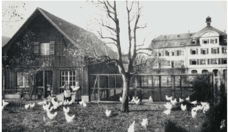
Hühnerstall vor dem Töchterinstitut.

auch auf den frühen Ufersiedlungen in Horgen. Die bisherigen Ausgrabungen solcher Siedlungsplätze legen nahe, dass die Menschen ihre Hütten mit Tieren teilten, womit sich auch aus diesem Blickwinkel die heutige Unterscheidung zwischen Haus- beziehungsweise Heimtieren und Nutztieren für diese Zeit erübrigt.