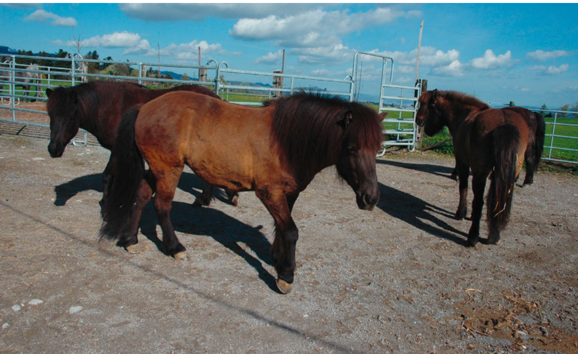
Pensionspferde im Chüeweidli Hirzel.

Wir sind sehr froh, dass wir von der Gemeinde Horgen dieses Gelände pachten dürfen, da gerade in der heutigen Zeit das Reiten im öffentlichen Raum (Waldwege usw.) immer schwieriger wird. Im Naherholungsgebiet Horgenberg ist es vielen Menschen nicht bewusst, dass es sich