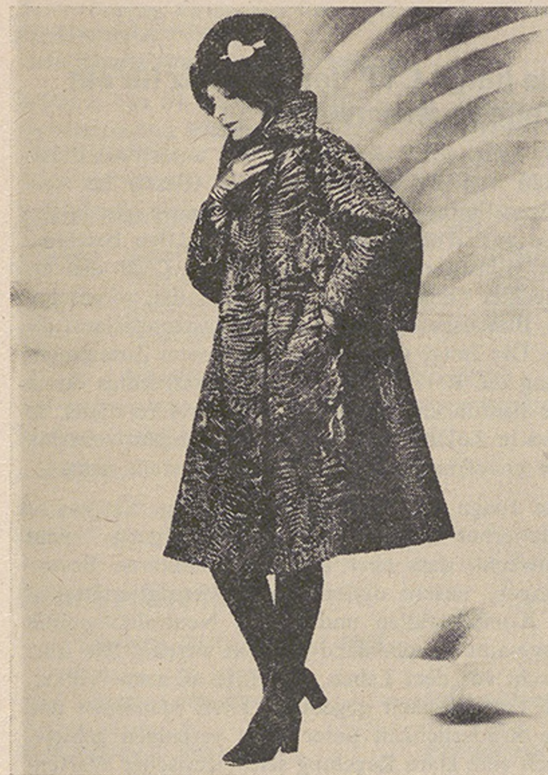
Breitschwanz-Watersilk-Mantel die neue Form 73, Création Zirn

Zirn, mit einem ausgesprochenen Sinn für modisches Flair, ist allen Neuerungen im Pelzfachhandel aufgeschlossen. Besonders Wert legt er auf