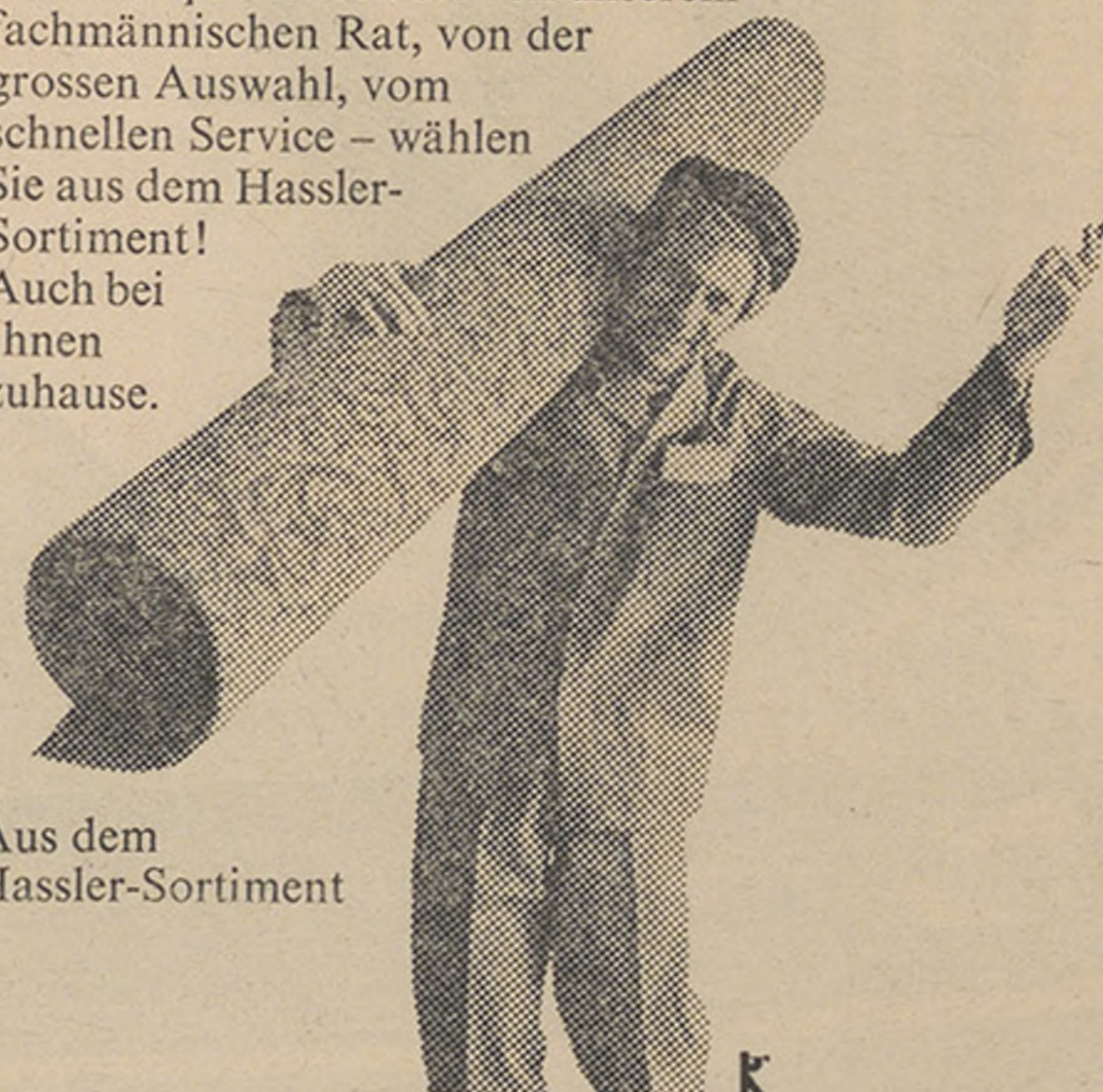
Aus dem Hassler-Sortiment

Wenn Sie bei uns einen Teppich oder Bodenbelag auswählen, dann können Sie sich schon in wenigen Tagen in Ihrem Heim dran freuen. Selbst wenn Ihre Wahl auf einen extravaganten Teppich gefallen ist. * Wir haben nämlich eine Lösung, die uns erlaubt, Sie ab dem grössten Lager der Schweiz zu bedienen: Mit dem Hassler-Sortiment steht Ihnen die erfolgreichste Auswahl aus der weltweiten Produktion an Teppichen und Bodenbelägen zur Verfügung. Damit Sie sich jetzt und sofort an Ihrem neuen Teppich freuen können! Deshalb: profitieren Sie von unserem fachmännischen Rat, von der grossen Auswahl, vom schnellen Service — wählen Sie aus dem Hassler-Sortiment! Auch bei Ihnen zuhause.