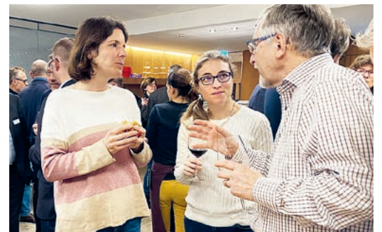
Behördenmitglieder im Gespräch.