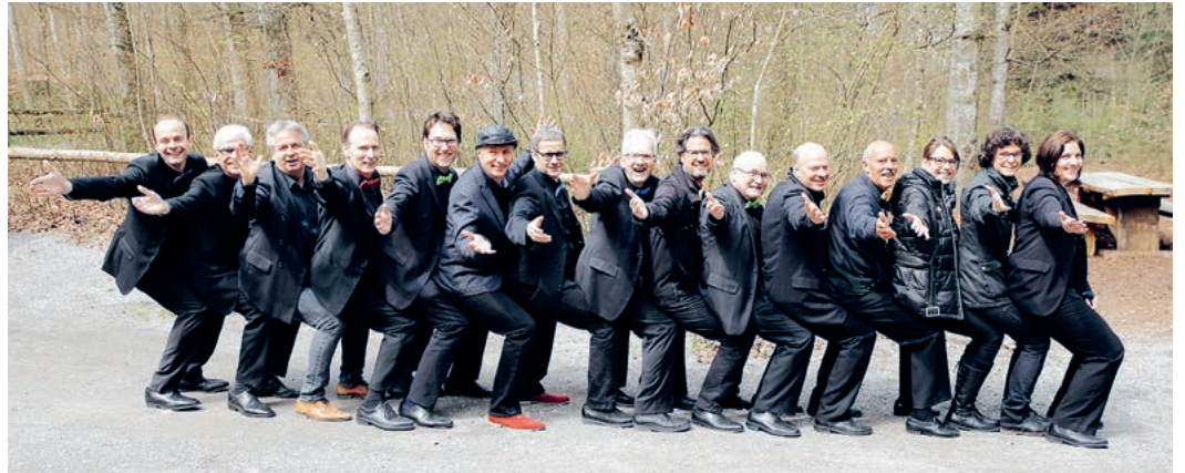
Die dynamischen Bigband-Jazzler aus dem Glatttal und dem Zürcher Oberland.