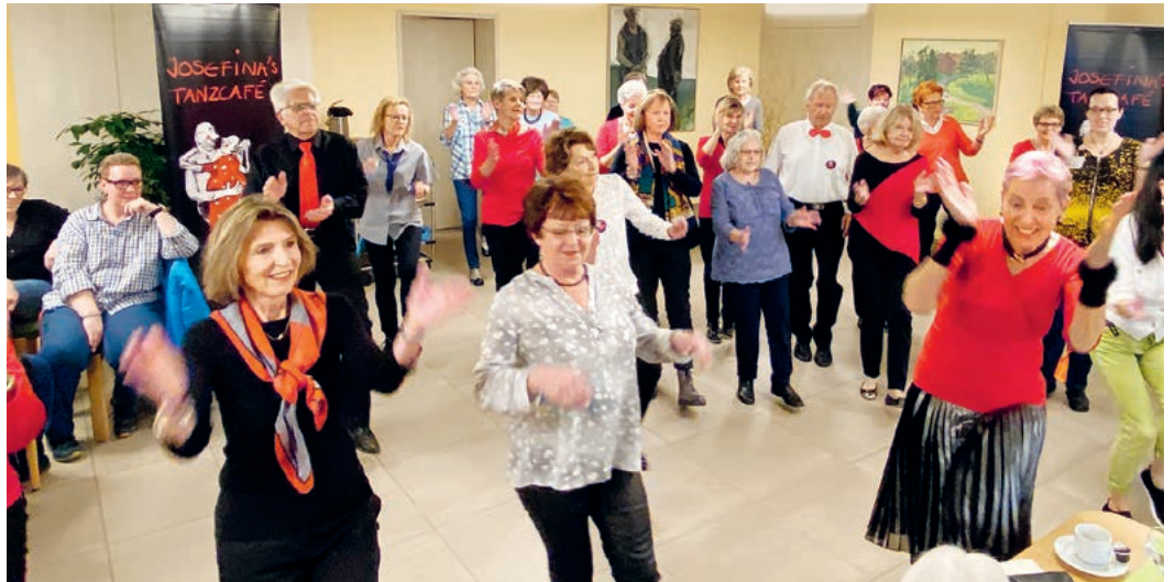
Pflegeheim-Bewohner und andere Maurmer, die Tänzer der Gruppe Everdance und sogar Mitarbeitende des Pflegezentrums – alle tanzten sie mit...!