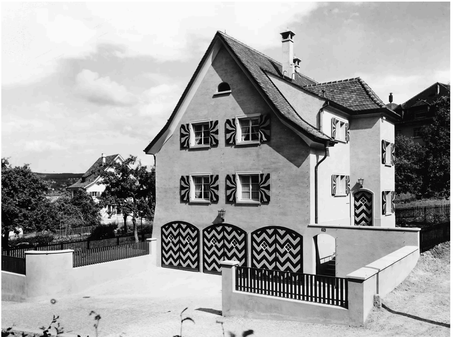
Bedienstetenhaus mit Garagen. Staubstrasse 21. 1929 – wohl im Baujahr.

Die drei überdimensioniert wirkenden Garagentore haben mich schon immer irritiert. Wer baut ein relativ kleines Haus, um drei grosse Garagen im Erdgeschoss unterzubringen? Und nun diese überraschende Lösung: Der Bauherr war ein reicher Mann, der mehrere Fahrzeuge besass, aber nicht im Hause wohnte. Zwar sollte die angenehme Infrastruktur für Autos und Personal in der Nähe seines Wohnsitzes errichtet werden, aber direkt neben seinen Bediensteten wollte der Herr nicht wohnen. Seine Vehikel wollte er indes zu Fuss erreichen können. Meine Frage, zu welcher Villa das Bedienstetenhaus gehörte, konnte mein Gesprächspartner zwar nicht beantworten, er meinte aber: «Es war irgendein Generaldirektor einer grossen Versicherungsgesellschaft, der an der nahegelegenen Ballariastrasse wohnte». Meine Neugierde war geweckt.