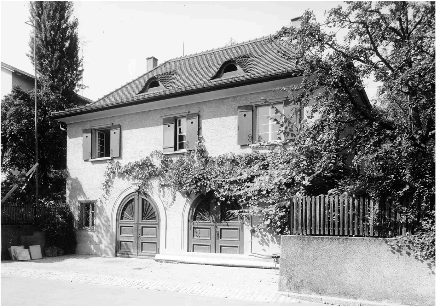
Etzelstrasse 51, 1950. Baugeschichtliches Archiv Zürich.

Ein weiteres Bedienstetenhaus im Bereich der Bellariastrasse war die Nummer 81. Es gehörte klar zur Villa Bellariastrasse 79, über die im Blog-Beitrag Fernöstliche Träume ausgiebig berichtet wurde. Der Ausschnitt aus dem Stadtplan 1913 zeigt die ganze Anlage des Anwesens. Die Villa lag zentral in einer grosszügigen Parkanlage mit markanten Wegen, die im Stadtplan Beachtung fanden.