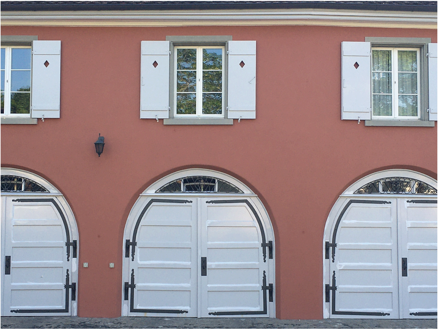
Kilchbergstrasse 43. Bedienstetenhaus mit Garagen.