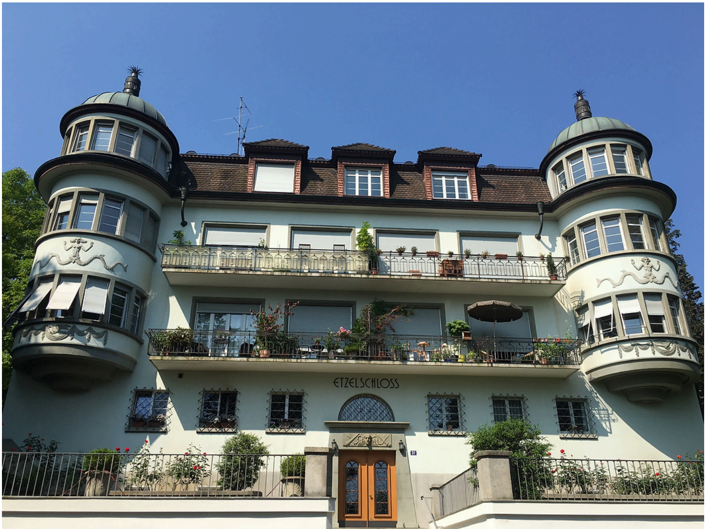
Etzelstrasse 31. Baujahr 1925. (6.6.2023)