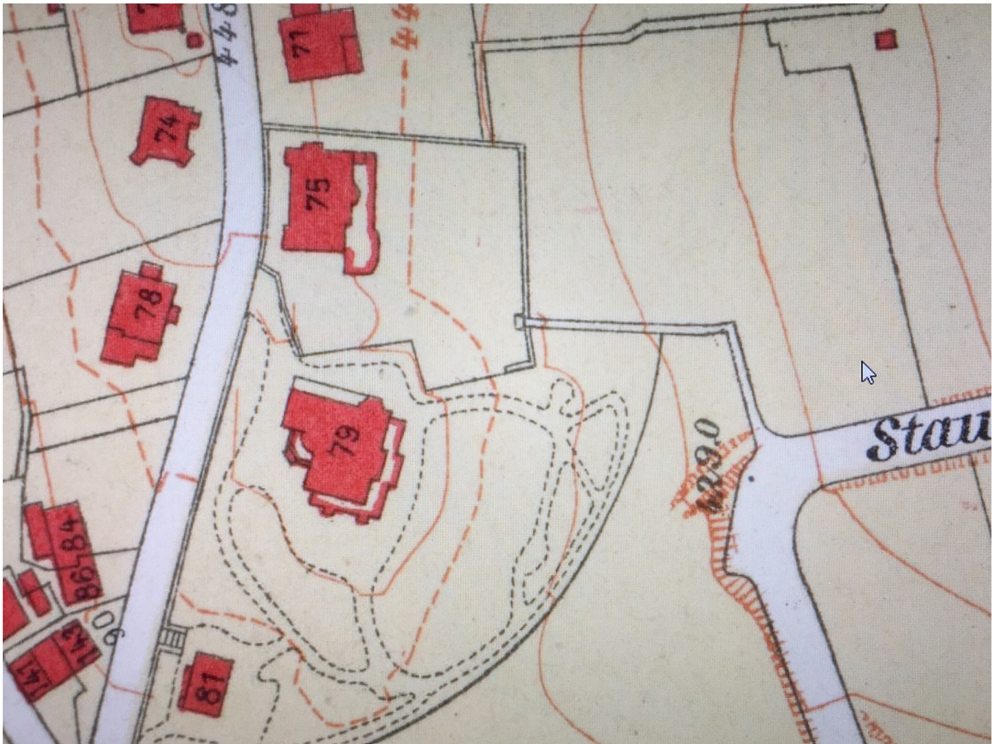
Stadtplan 1913, Ausschnitt Bellariastrasse 71-81.

Das Bedienstetenhaus dagegen ist zwar noch auf dem riesigen Grundstück, aber ziemlich am Rande. Was dieses Gebäude von den anderen bisherigen Bedienstetenhäusern unterscheidet: es gab keine Garagen, und auch keinen Zugang mit Autos zum Haus selber. Wenn ein Chauffeur da gewohnt haben sollte, wäre er auch zu Fuss ins Haus gekommen. Aber für den Park waren sehr viele helfende Hände notwendig. Der nötige Gärtnermeister dürfte im Haus Bellariastrasse 81 gewohnt haben.