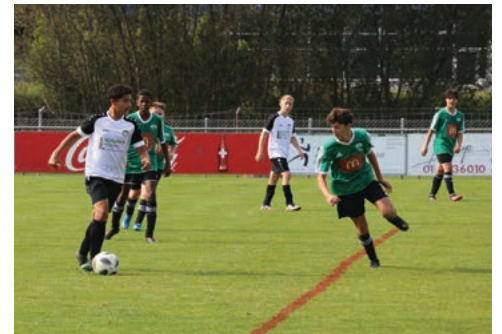
Die C-Junioren siegten in Brüttsellen mit 0:2.