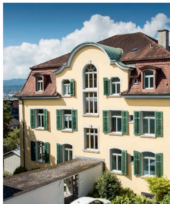
IBK Berufsbildung in Küsnacht

Ein wunderschöner Garten, eine altherwürdige Villa, ein modernerer Bau – das alles gehört zum Bereich Berufsbildung der IBK. Ich stelle mir vor, dass man sich hier einfach wohlfühlen muss und beim Rundgang mit Margit wird dieses Gefühl bestätigt! Aufgestellte junge Erwachsene begegnen mir überall – die einen füllen Vasen mit frischen Blumen aus dem Garten, die andern bereiten den Znüni vor, während einige noch in ihren Schulzimmern unterrichtet werden. Und zum wiederholten Male bin ich erstaunt und beeindruckt, mit welchem Engagement, welcher Freude hier gelehrt und gearbeitet wird! Den Angestellten ist es ein grosses Anliegen, den jungen Menschen das Bestmögliche für ihren Berufsweg mitzugeben und es ist erwiesen, dass ihnen das auch gelingt – die meisten Jugendlichen finden nach der 2-jährigen praktischen Ausbildung eine Anschlusslösung im regulären Arbeitsmarkt!