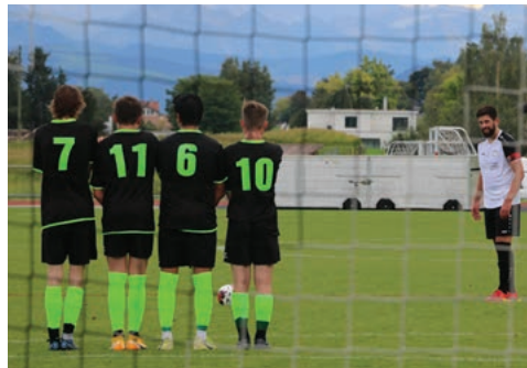
Die erste Mannschaft bleibt Tabellenführer.