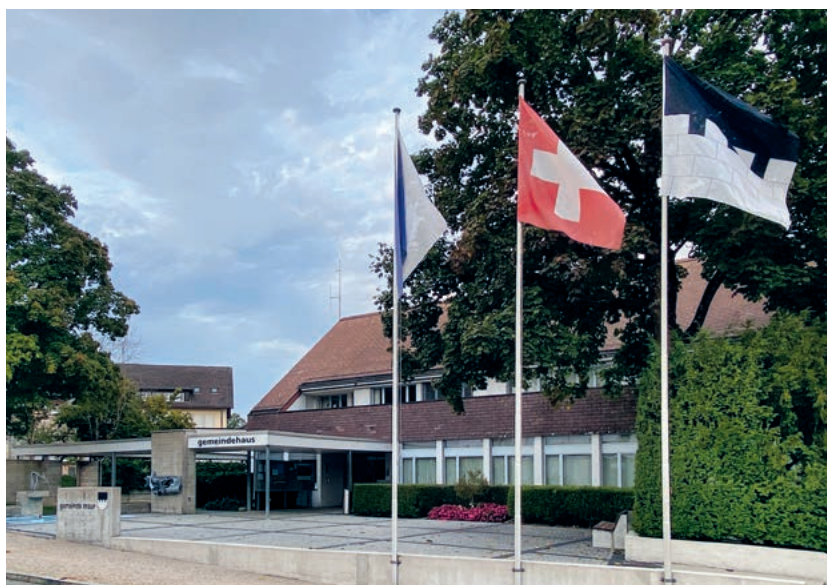
Mit den Wahlen kommt ein frischer Wind nach Maur.

Solche weiterführenden Informationen finden sich aufgelistet auf der Website der Gemeinde Maur. Dort gibt es für dieses wie auch für andere Behördenämter seit Kurzem einen sogenannten Funktionsbeschreibung, der Fragen nach Aufwand und Anforderungsprofil klären soll.