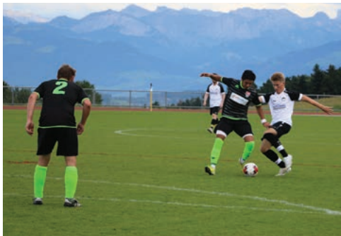
Spannendes Spiel gegen den FC Neumünster.

Ein umkämpftes, spannendes und teilweise hitzig geführtes Spiel erlebten die D-Junioren in Herrliberg. Dank einer soliden Abwehrleistung gewannen die Jungs mit 2:3. Wir gratulieren den Jungs zum grossartigen Erfolg.