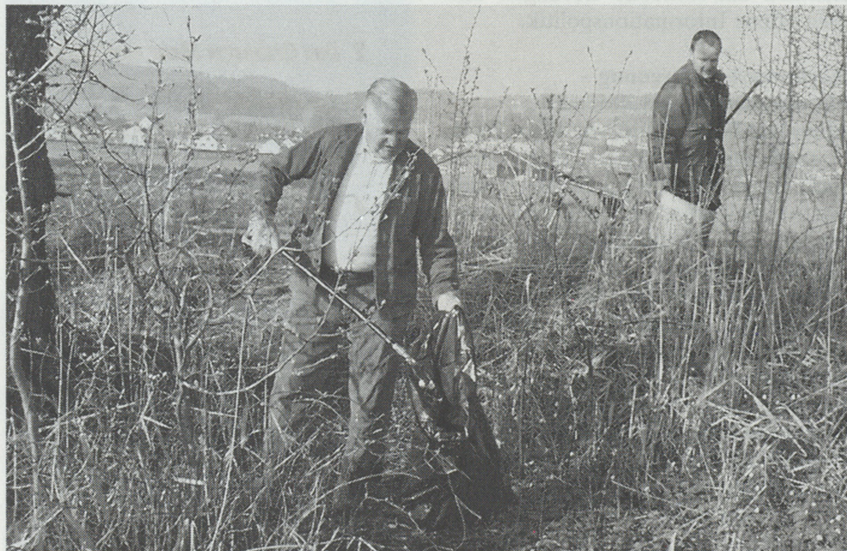
Vor allem Glas- und Plastikabfälle sammelten die Uferputzer ein.

Gegen Mittag trafen sich alle Uferputzer und Uferputzerinnen und genossen ein vom Fischerverein spendiertes Mittagessen. Ob es ein Fischmenü war, entzieht sich der Kenntnis der Schreibenden.