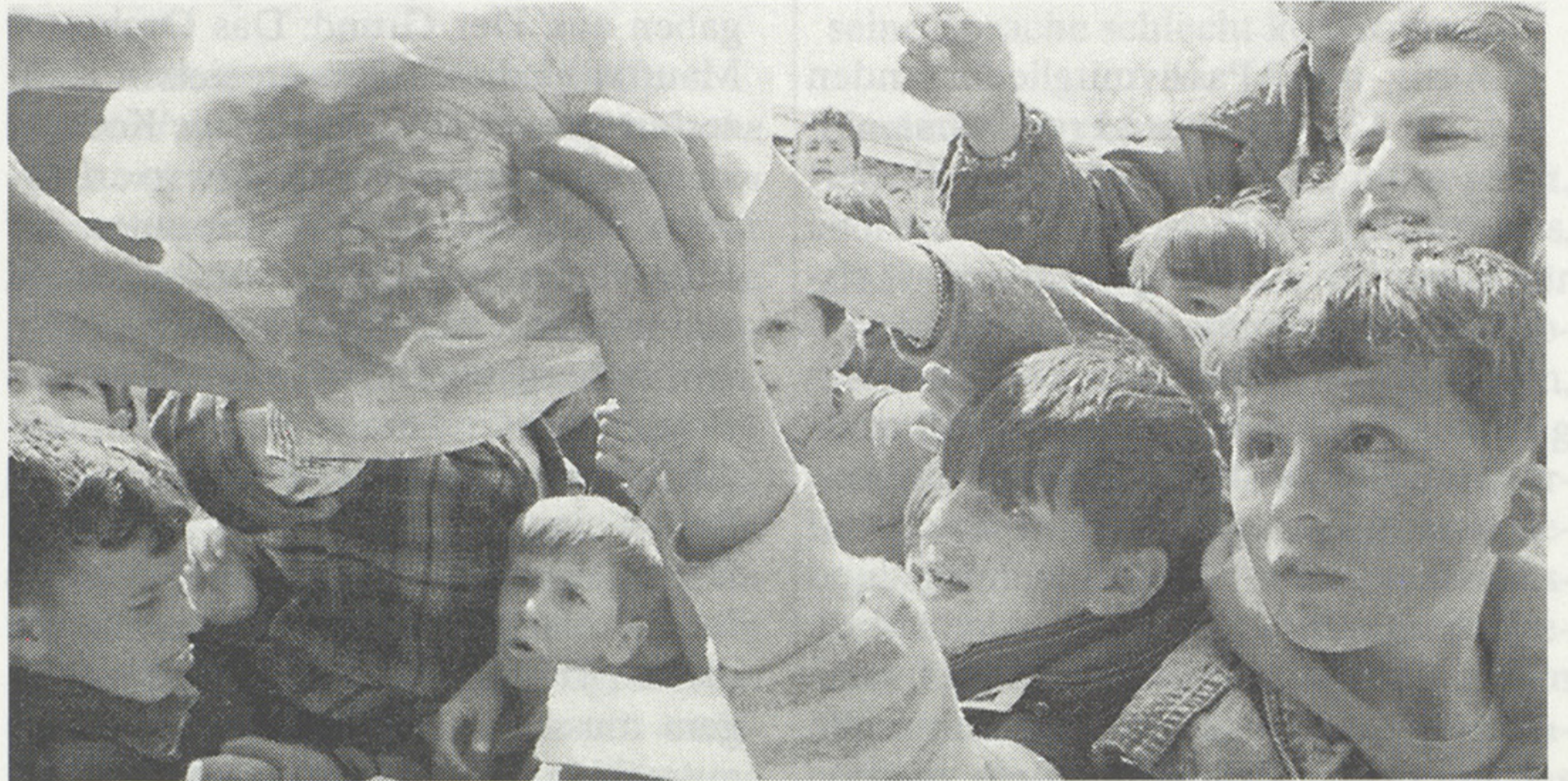
Bilder von Vertriebenen, wie wir sie seit Wochen sehen. Auch Maur stellt sich darauf ein, weitere Flüchtlinge aufzunehmen.

Ende Juni wird in Aesch eine zusätzliche Wohneinheit für 12 Personen bezugsbereit sein. Die Wahl für weitere Unterkünfte fiel schlussendlich auf Binz. Die Gemeinde Maur besitzt an der Zürichstrasse, zwischen Zelgli- und Fridlimattstrasse, ein Grundstück, das sich für diesen Zweck eignen würde. Geplant ist ein modularer Bau, der bei Bedarf ohne grossen Aufwand erweitert werden kann. «Wir wollen kein Ghetto errichten», meint Roland Humm, «der Bau hat zwar weitgehend den Charakter eines Provisoriums, soll sich aber in unaufdringlicher Weise in die Umgebung einfügen. Dazu gehören auch entsprechende Umgebungsarbeiten, wie zum Beispiel Bepflanzungen.» Die Unterkünfte sollen im kommenden Sommer bezugsbereit sein. Auf die Frage nach möglichen Rekursen, meint Humm, dass diese in die geplante Zeitspanne mit eingerechnet seien und stuft dabei die Aussichten, dass ein Rekurs Chancen hat, als äusserst gering ein. Nach wie vor willkommen sind zusätzliche günstige Unterbringungsmöglichkeiten. Entsprechende Angebote können an die Fürsorgebehörde der Gemeinde Maur gerichtet werden.