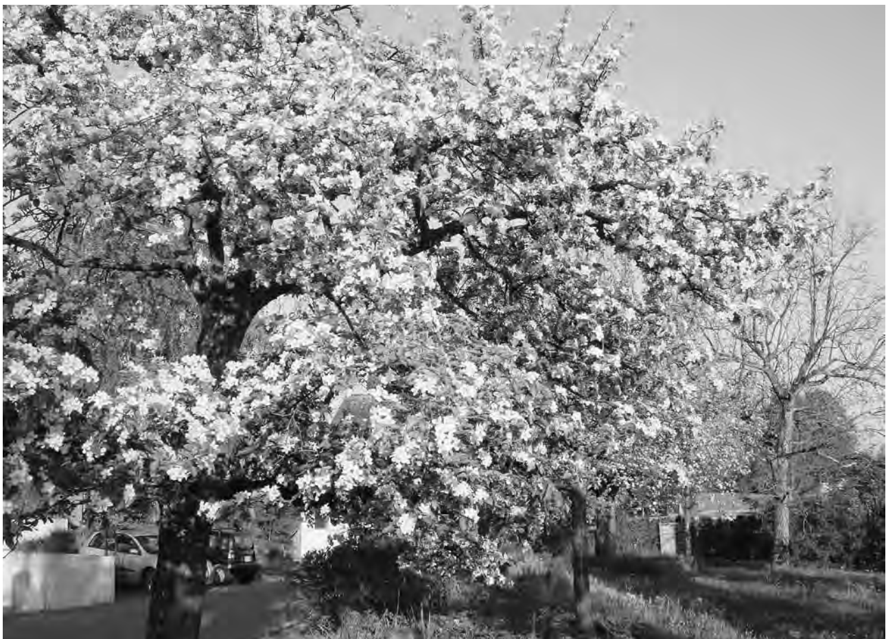
«Baumpflanzaktion – damit solche Bilder auch in Zukunft in Russikon noch zu sehen sind»