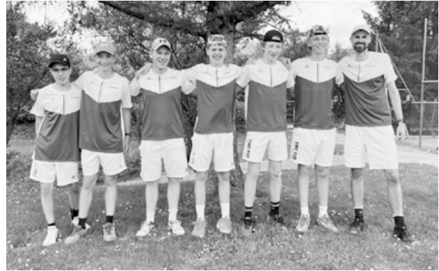
Nach dem ersten IC-Match 2023 und einem Sieg von 7:1.

geschafft und mischen nun in der hohen Spielklasse der 1. Liga mit. Es lohnt sich auf alle Fälle, auf dem Platz des TCR eines der Spiele mitzuverfolgen und zu staunen, wie die Jugend mit Racket und Ball umgeht. Die genauen Spieldaten können Sie unserer Website www.tc-russikon.ch/interclub entnehmen.