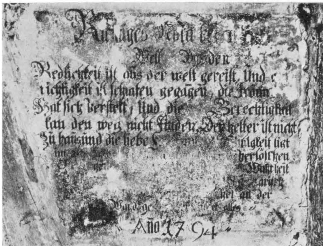
Hausinschrift in Wangen, bei der Renovation 1959 entdeckt

densten, nicht eingearbeiteten, meist freierwerbenden Zeichnern in die Reinzeichnung umgearbeitet werden. Umso höher wissen wir die durch das Landesmuseumsgesetz unterbaute Einrichtung zu schätzen, dass die Denkmalpflege im Kanton und Stadt Zürich von der erheblichen Aufgabe der Konservierung und Restaurierung der Bodenfunde entlastet ist. Der Aussenstehende hat kaum die Möglichkeit zu ermassen, welche organisatorischen, arbeitstechnischen und finanziellen Lasten dadurch dem Kanton erspart werden.