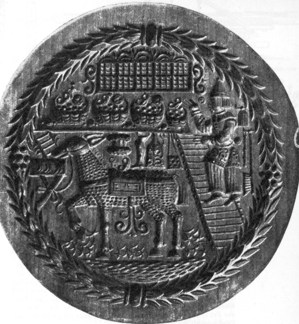
Tirggelmodel aus Zürich um 1670—90

kind. Das hat sich vermutlich auch auf der zürcherischen Landschaft im Chlausbrauch- tum ausgewirkt, in dem der Silvester-Chlaus an einigen Orten Brauch ist.