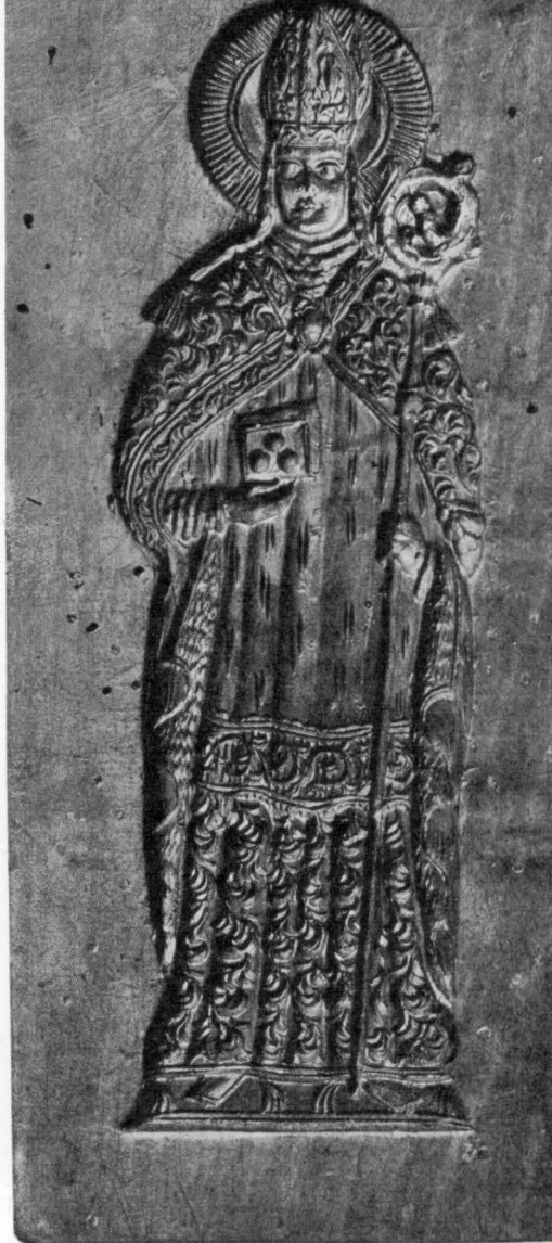
Kuchenmodell um 1700 (Leiheliché «Ideales Heim», Winterthur)

Der Samichlaus als Gabenbringer der Kinder lässt sich aus der Ueberlieferungslegende heraus einigermaßen erklären. Hingegen die Bestrafung der Kinder mit der Rute und die an vielen Orten gebräuchliche Begleitung mit den Schmutzlis lässt sich kaum aus der kirchlichen Gestalt des Hl. Bischofs erklären. Bei der Rute wirkt das heidnische Motiv des Lebenszweiges nach, und die Schmutzli waren vielleicht ursprünglich Wachstums-