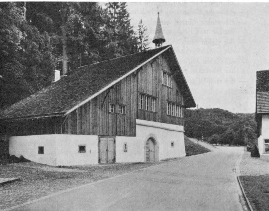
Nach der Restaurierung (Leihelichés 2. Bericht der Zürcher Denkmalpflege 1960/61)

Ein ebenso wichtiges Arbeitsfeld wie die Inventarisierung bildet der Aufbau eines Archivs , nicht zur Konkurrenzierung etwa des Staatsarchivs oder des Archivs der Eidg. Kommission für Denkmalpflege im Schweiz. Landesmuseum, sondern einzig und allein deswegen, weil nur ein gut ausgebautes Archiv eine rasche und zweckdienliche Arbeit überhaupt erst ermöglicht. Während die Inventarisierung gewissermassen den Boden für die Denkmalpflege bedeutet, handelt es sich bei der Archivarbeit eher um den schützenden Deckel, damit das Aufgearbeitete nicht wieder verloren und vergessen geht. Hierzu gehören das Sammeln alter Akten, das Veröffentlichende von Berichten aller Art und das Ablegen derselben nach archivalischen Gesichtspunkten.