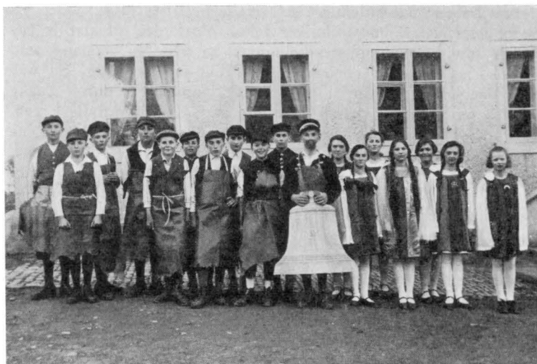
Schulhausweihe 2. März 1930

liebe in Anspruch. Wenn diese Einspannung in der Regel auch nicht mit einträglichen Pfründen honoriert wird, so kann sie als Ergänzung der beruflichen Tätigkeit und zur Erweiterung des Gesichtskreises doch nützlich und wertvoll sein. So hatte ich bald verschiedene Vereinschancen zu übernehmen, zuletzt beim Männerchor die verwaiste Dirigentenstelle. Ich tat darin mein Bestes und hatte die Genugtuung, mit dem Verein, nach dessen Wiedereintritt in den Bezirksverband, an mehreren auswärtigen Sängeranlässen teilnehmen zu dürfen. Ein mit eigenen Kräften bestrittenes Liederkonzert in der Kirche, mit Chor- und Quartettvorträgen, worunter der Pilgerchor aus Richard Wagners «Tannhäuser» mit Orgelbegleitung als besonderes Wagnis figurierte, bildete gewissermassen einen Höhepunkt unserer gesanglichen Tätigkeit.