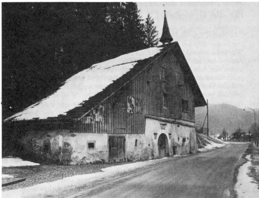
Zehntenscheune in Zell-Rikon vor der Restaurierung

So bemüht sich die Denkmalpflege heute, alle wichtigen geschützten und schützenswerten kulturhistorischen Objekte in Plänen und Listen gemeindeweise einzufangen. Als Grundlage für diese äusserst wichtige Arbeit dient folgendes Schema: