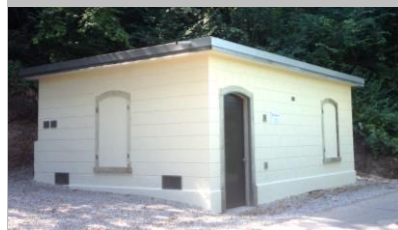
Martin Käser, Brunnenmeister

Das an der Neugutstrasse an der Thur stehende Pumpenhaus aus dem Jahre 1911 wurde in den Sommermonaten saniert. Erneuert wurden die Gebäudehülle, das Dach und die Umgebung. Im Inneren haben wir kleinere Anpassungen vorgenommen. Seit 2012 wird das Gebäude nicht mehr als Pumpenhaus genutzt. Es dient heute als Betriebsgebäude einer UV-Anlage, die schädliche Mikroorganismen im Frischwasser eliminiert. Das Wasser wird danach den Dorfbrunnen im unteren Teil von Andelfingen und denjenigen in Kleinandelfingen zugeführt.