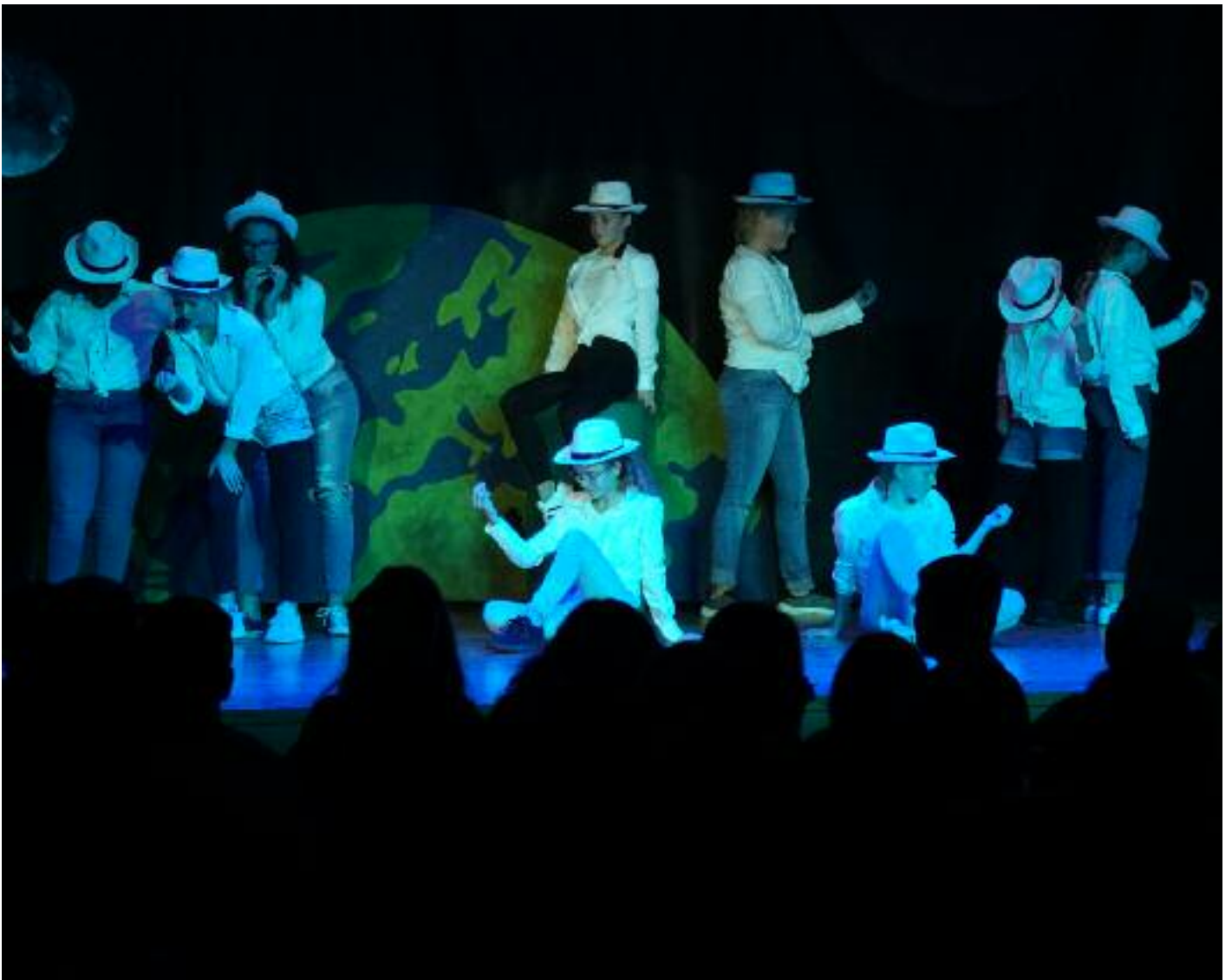
Die Abendunterhaltung der Turnvereine Grafstal war einmal mehr ein voller Erfolg.