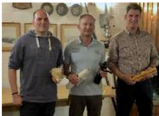
Die drei Gesamtsieger

Knapp 400 Schüsse waren für die Wertung in der Gesamtmeisterschaft zu absolvieren.