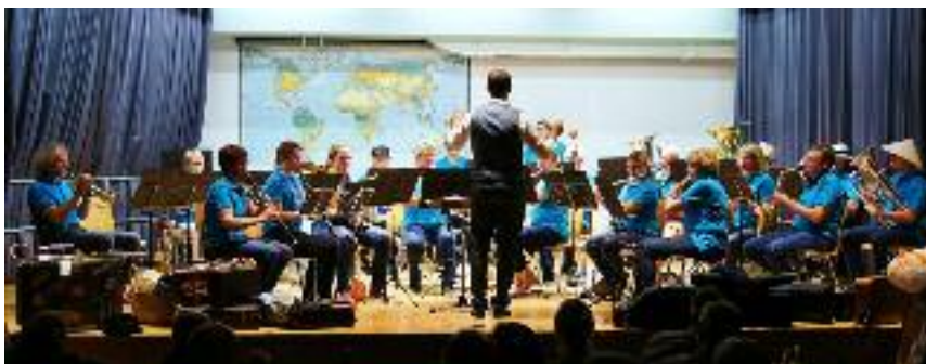
Der Musikverein auf Reisen

Nach dem weltbekannten, vom Musikverein gekonnt umgesetzten Volkslied «Fantasy on a Hebrew Folk Song»