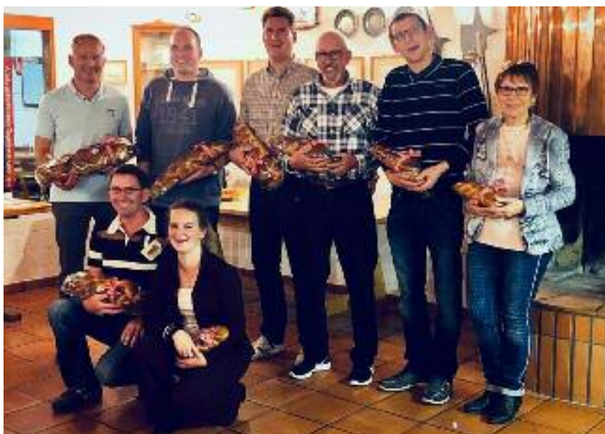
Strahlende Gesichter nach der Rangverkündigung

Die verschiedenen Wanderpreise wurden wie folgt gewonnen: