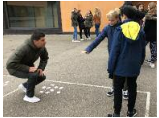
Spannende Infos von Franco Marvulli

Wir, die Schüler und Schülerinnen der 2A/B/C, hatten am Donnerstag und Freitag Besuch von Franco Marvulli, dem ehemaligen, erfolgreichen Radsportler. Am Morgen nach dem Warm-up auf dem Pausenplatz lernten wir den Alltag eines Sportlers und die Unterschiede zwischen seinem und unserem Tagesablauf kennen. Danach bekamen wir viele Informationen über Vorstellungsgespräche: Wie bereite ich mich richtig auf das Gespräch vor? Wie verhalte ich mich richtig? Wir überlegten auch, was unsere Stärken und Schwächen sind und wie wir diese in Vorstellungsgesprächen positiv anpreisen können. Franco Marvulli stellte uns viele knifflige Fragen, bei welchen wir immer wieder etwas Neues dazu lernen konnten. Er gab uns viele nützliche Tipps, die uns bei der Stellensuche dann helfen werden.