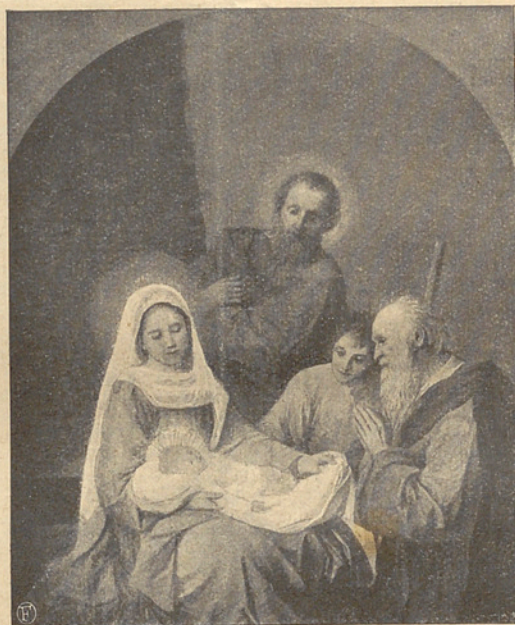
Heilige Familie — La Sainte Famille.

Photochrom-Reproduktion Nr. 146; 27 × 21,5 cm.