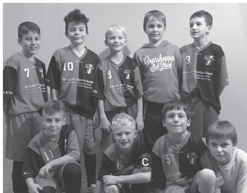
Die motivierten Spieler des Ea des FC Kempttal.

Die ersten zwei Hallenturniere sind mittlerweile auch schon wieder Geschichte. Wir hatten untereinander viel Spass und konnten jeweils gegen Ende der Tur-