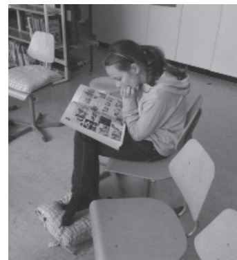
Fesselnde Bücher, die man kaum noch weglegen konnte.

Vor den Herbstferien wurden etwa 200 neue Bücher eingekauft. Sie wurden katalogisiert und eingebunden und waren somit bereit zum Lesen. Die neu angeschafften