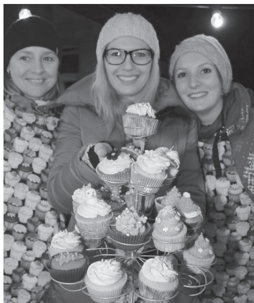
Fröhliche Gesichter, strahlende Augen, die weihnächtliche Vorfreude war überall zu sehen.