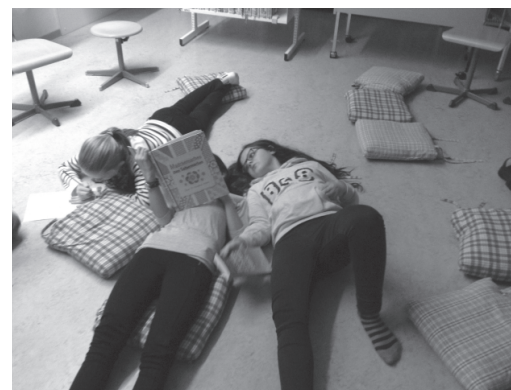
Sie machten es sich bequem und genossen es, in andere Welten abzutauchen.

Bücher wurden am Bibliotheksabend von Kindern und Bibliothekarinnen vorgestellt. Dabei konnte man die Neuheiten anschauen und miteinander besprechen. Zwischendurch konnte man auch etwas Kleines essen und trinken.