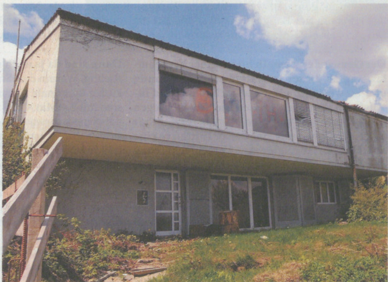
Radlegende Hugo Koblet (links). Sein früheres Haus an der Forchstrasse 125 (oben) wird nun abgerissen.