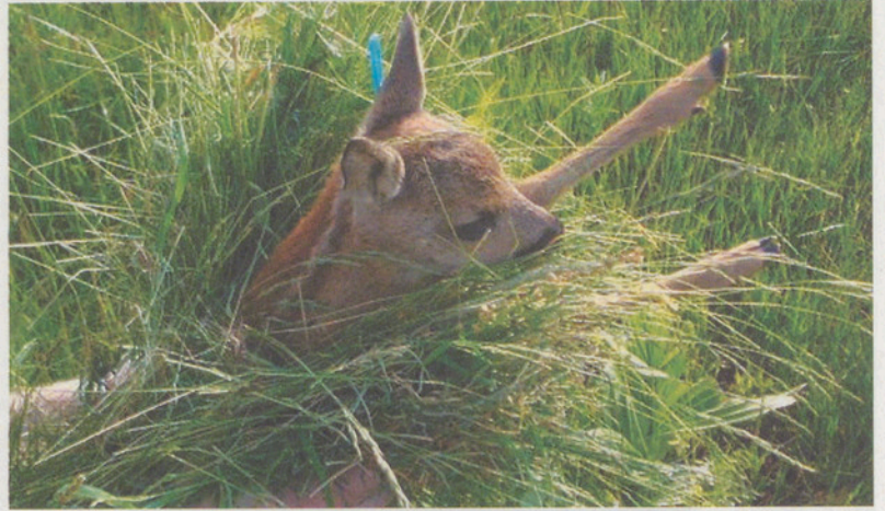
Die kleinen Kitze sind oft noch nicht in der Lage, vor der Mähmaschine zu fliehen.

Den zahlreichen und verantwortungsvollen Hundehaltern sei gedankt, dass sie ihren Hund insbesondere während der Setzzeit in Wäldern und