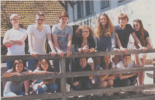
Konfklasse Maur in der Kulturmühle Lützelflüh.