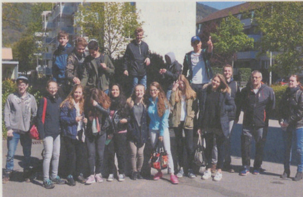
Die Konfirmandenklasse Ebmingen vor der Comanderkirche in Chur.