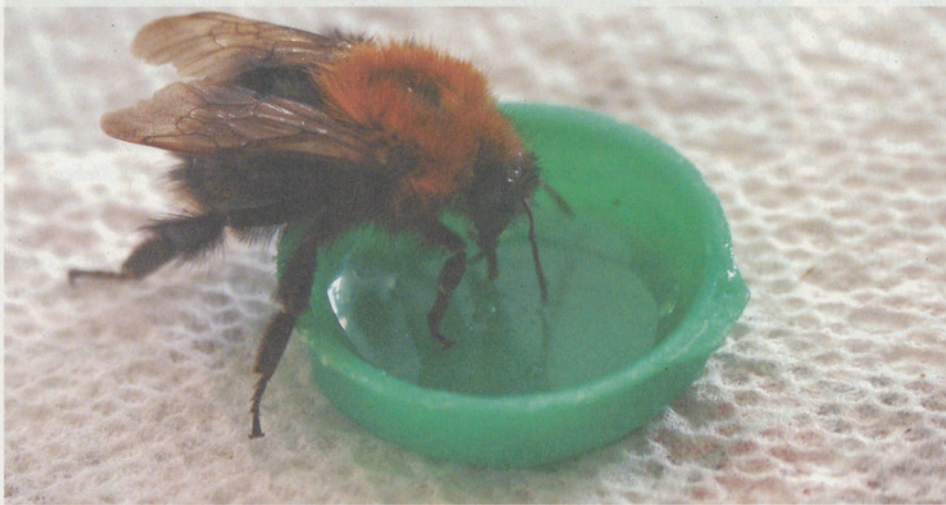
Die Hummel erfüllt vielfältige Aufgaben in der Natur.

Der Referent und der Vorstand freuen sich auf viele Interessierte.