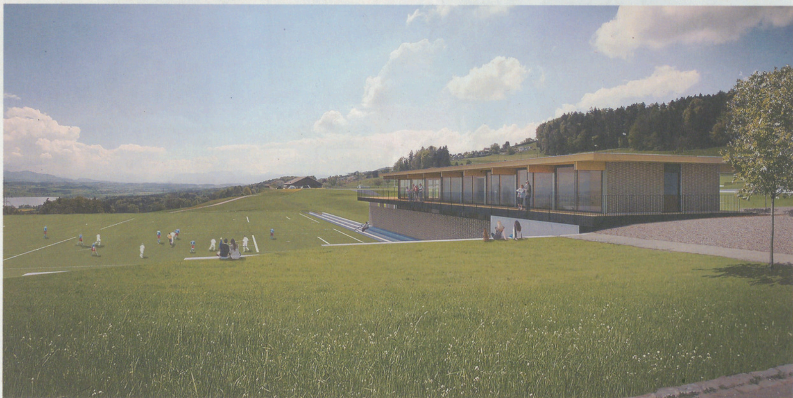
Visualisierung des geplanten Kunstrasenspielfelds mit der Option Vereinshaus.