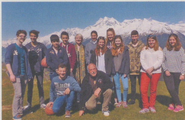
Konfklasse Forch in Miraniga, Obersaxen.