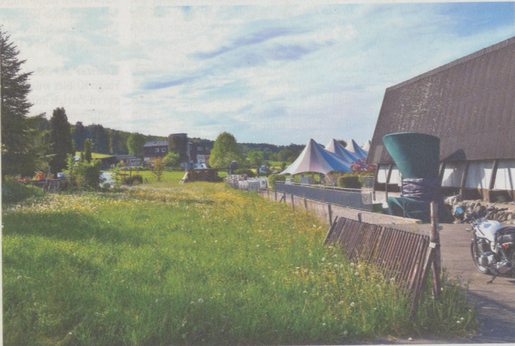
Hier zwischen Studio Maur und der Häuserzeile an der Kehlhofstrasse würde die geplante Strasse hinkommen.

Wir haben ein renommiertes, unabhängiges Planungsbüro mit einem Gutachten beauftragt; dieses kommt zu einem ganz anderen Resultat: Die Bewältigung des Verkehrsaufkommens sowie die Verkehrssicherheit sind mit der aktuellen Verkehrsführung über die Kehlhofstrasse hinreichend gewährleistet. Ich selber kann dies von meinem Büro mit Blick auf die Kehlhofstrasse gut beurteilen – glauben Sie mir, prekäre Verkehrs-