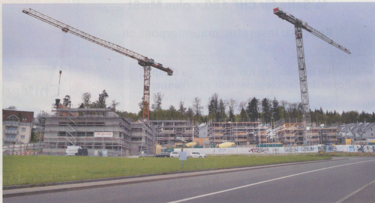
Seit mehr als einem Jahr arbeiten stets um die 50 Bauarbeiter auf der Grossbaustelle.

Ursprünglich wollte man mit dem Grossbau im Herbst 2015 beginnen