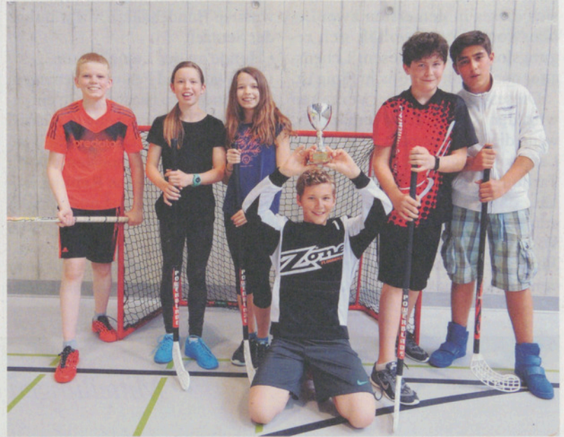
Impressionen vom Mittelstufen-Turnier.