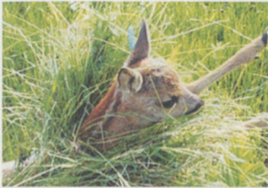
Rehkitze bleiben oft regungslos.

In den Monaten Mai und Juni legt die Rehgeiss jeweils ihre 1–2 Kitze ins hohe Gras, das sie vor Gefahren und Raubtieren schützen soll. In den ersten Tagen nach der Geburt sucht die Geiss ihre Kitze nur zum Säugen auf. Ist sie wieder verschwunden, drücken sich die Kitze lautlos auf den Boden. Selbst wenn ein Fuchs nahe am Kitz vorbeipirscht, duckt sich dieses in den ersten zwei Lebenswochen und verhält sich regungslos, da es in diesem Lebensalter noch nicht zur Flucht fähig ist.