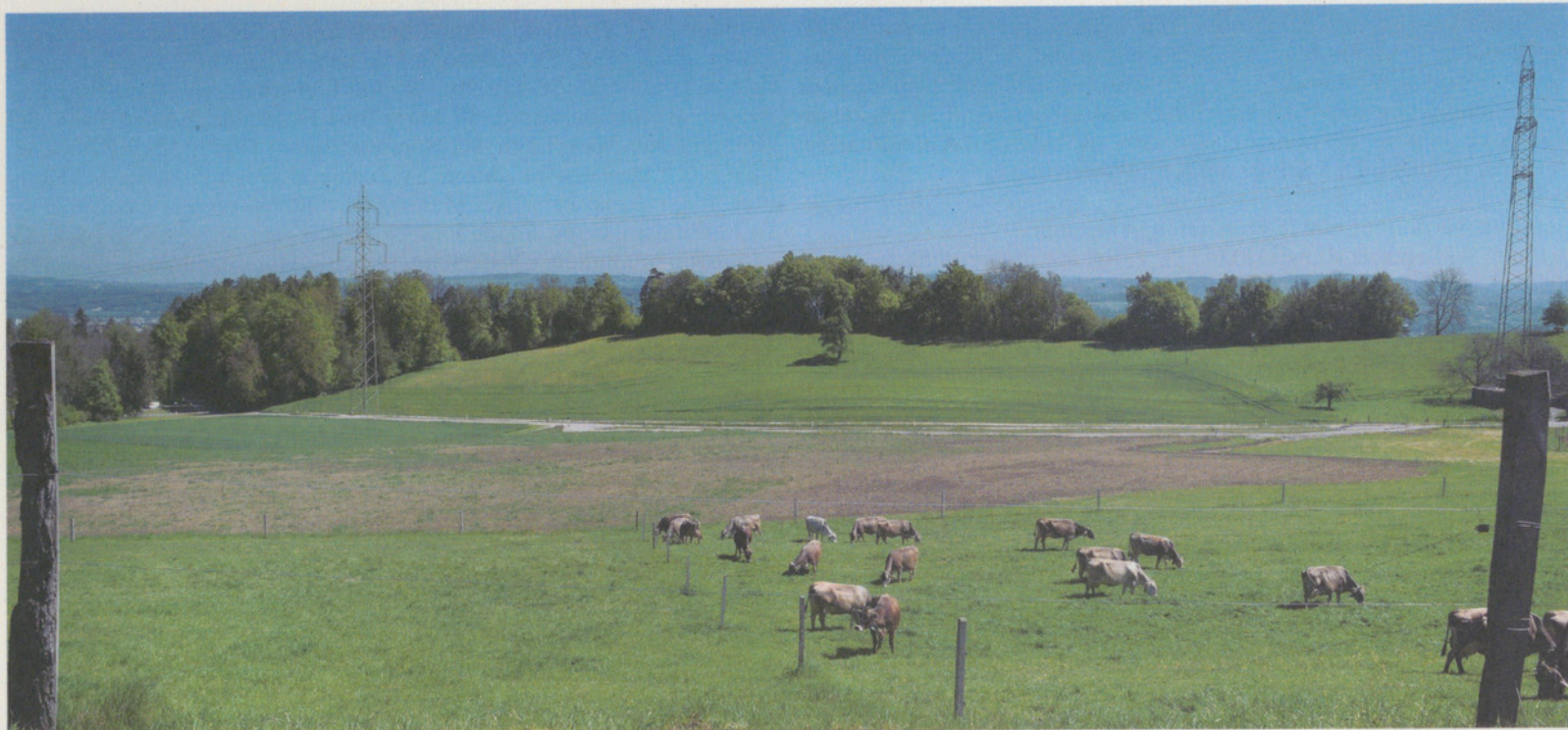
Blick auf die aufgewertete Fläche: Die neu aufgetragene Erde ist noch gut sichtbar.