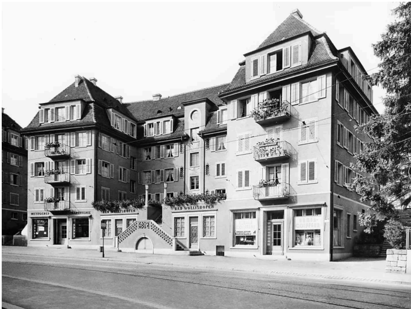
Bad Wollishofen, Albisstrasse 48. 1931.

a) ist richtig - ein öffentliches Badezimmer, Bad Wollishofen!