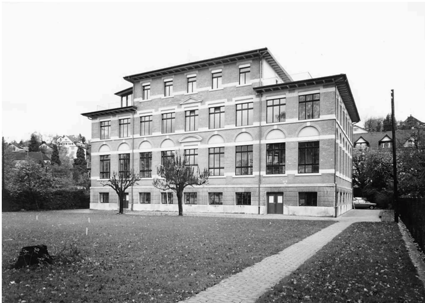
Ehemalige Chemische Fabrik, Seestrasse 513, erbaut 1904. Foto 1979.