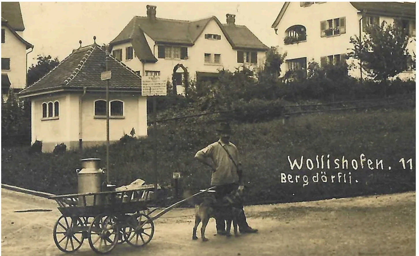
Foto: Wollishofer Milchmann ums Jahr 1915, Privatbesitz

a) ist richtig: 110 Hundebesitzern wurde gestützt auf tierärztliche Zeugnisse erlaubt, ihre Hunde als Zugtiere zu benutzen.