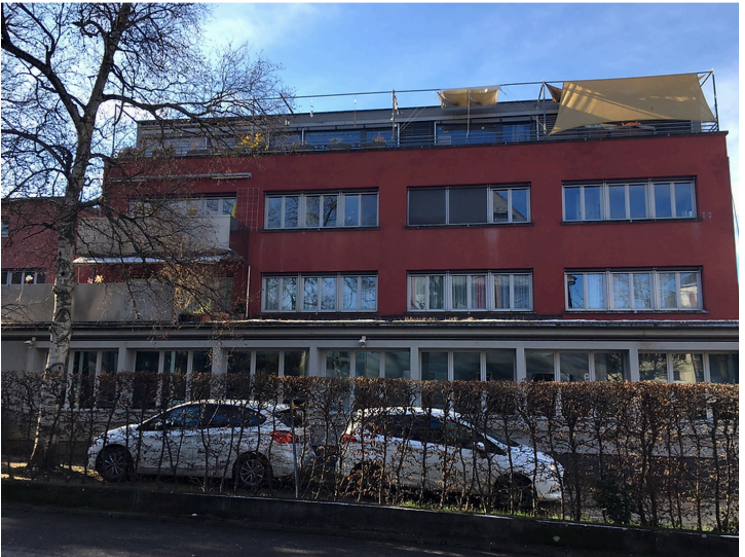
Nidelbadstrasse 6/8. Ehemaliges Fabrikgebäude Henry Weber Tabak. Baujahr 1932. (19.1.2023) Heute Wohnkomplex der Stiftung PWG.