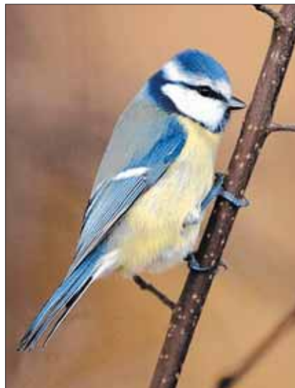
In Höngg anzutreffen: Blaumeise.

Gefährdete Vogelarten sind aber rar, nur gerade Grauspecht und Kleinspecht, ein letztes Paar Gartenrotschwänze oder die mögliche Brut des Pirols im Bereich des Mittelwaldes wären zu nennen. Sonst finden sich in unserem Quartier vor allem Allerweltsvögel wie Buchfink, Mönchsgrasmücke, Buntspecht oder Kohlmeise. Anspruchsvollere Arten wie Girlitz, Stieglitz (Distelfink) und auch der Grauschnäpper werden immer seltener. Das ist nicht verwunderlich, sind doch viele Grünflächen zunehmend konfektioniert und bieten