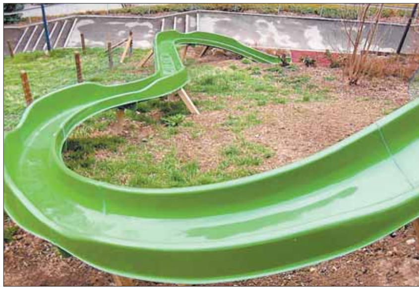
Die Riesenrutschbahn wird am Samstag, 17. März, eingeweiht.