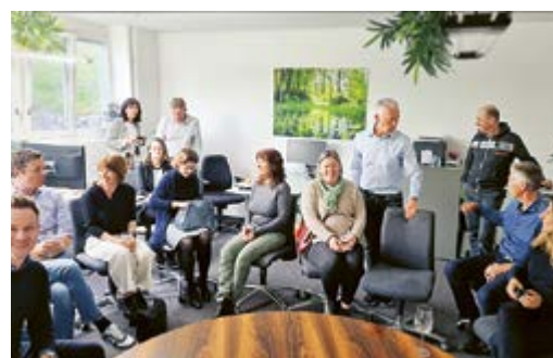
Angeregte Diskussionen im Workspace21.