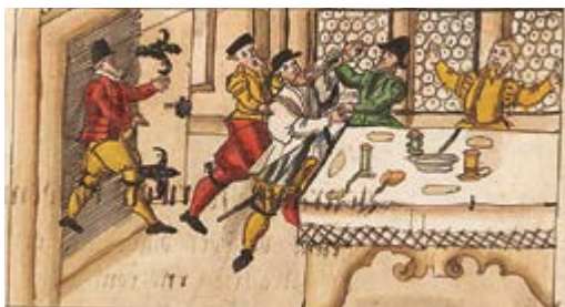
Der Mord in Uessikon.

Was es mit diesem «Wunder Gottes» auf sich haben könnte, ist rückblickend natürlich schwierig beantwortbar. In früheren Zeiten beobachteten die Menschen gelegentlich «Blutregen», der vom Himmel kam. Dieses Phänomen