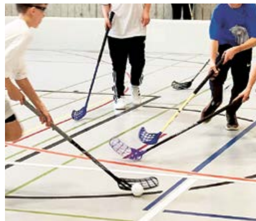
In der Dreifachturnhalle geben die Mittelstüfler ihr Bestes. Wer nicht spielt, fiebert von der Tribüne aus mit.