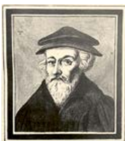
Johann Jakob Wick.

Über die 30 Jahre Sammeltätigkeit trug Wick auf diese Weise 24 stattliche Bände zusammen, die mehrheitlich chronologisch geordnet sind. Im Werk enthalten sind auch rund 500 Flugschriften und über 400 Einblattdrucke (v.a. Holzschnitte und einige Kupferstiche), die Wick sorgfältig in die Bände klebte und teils mit Randbemerkungen versah.