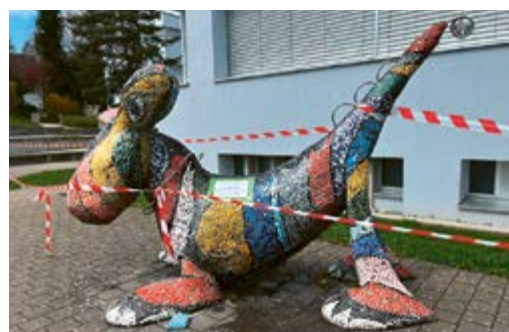
Das Fabeltier vorher (oben, mit kaputten Stellen) und nachher (unten, frisch geflickt).