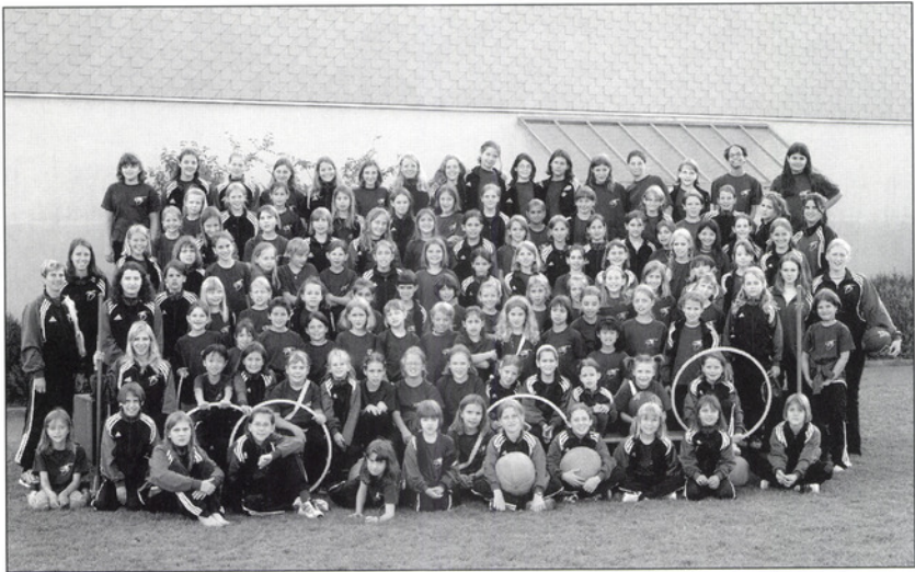
Die Maitliriege Maur im Sommer 2002 kurz vor der Einweihung des Sportplatzes in der Looren.