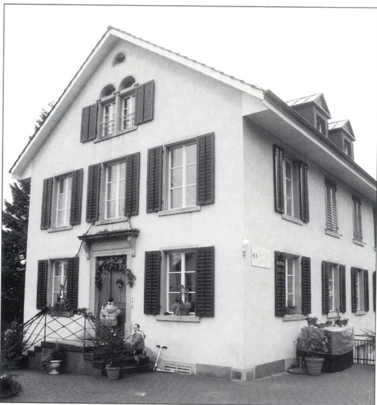
«Chinderhuus Muur» in Ebmatingen.

Ein Jahr später, am 1. Mai 1994, war der Umbau des ehemaligen Schulhauses in Ebmatingen fertig, und das «Chinderhuus Muur» konnte eröffnet werden. Der Mittagstisch zog im Parterre ein und die Krippe im ersten Stock. Die personellen Synergien kamen dadurch gut zum Tragen. Um die Verantwortlichkeit gegenüber der Gemeinde zu vereinfachen, übernahm der Verein Kinderkrippe Maur im Januar 1996 auch die Leitung des Mittagstisches.