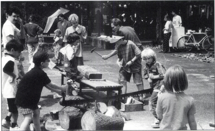
Spielfest 1997 des Elternvereins Muur.