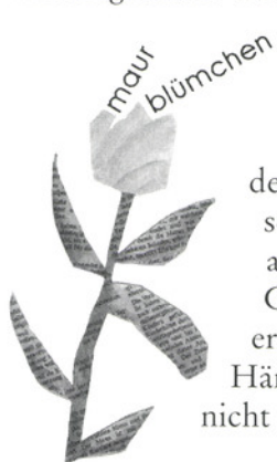
Das Maur Blümchen auf der ersten, nach ihm benannten Broschüre.

Seit langem sah sich die Fürsorgebehörde mit dem Problem der familienergänzenden Kinderbetreuung in der Gemeinde konfrontiert. Sie hat deshalb im Jahr 1987, nach einer Bedürfnisabklärung bei den Einwohnern der Gemeinde Maur, eine Studie über drei dezentrale kommunale Tagesstätten in den Ortsteilen Maur, Ebmatingen und Aesch vom Marie-Meierhofer-Institut ausarbeiten lassen. Aus Kostengründen war dieses Projekt unrealisierbar. Dass es aber eine