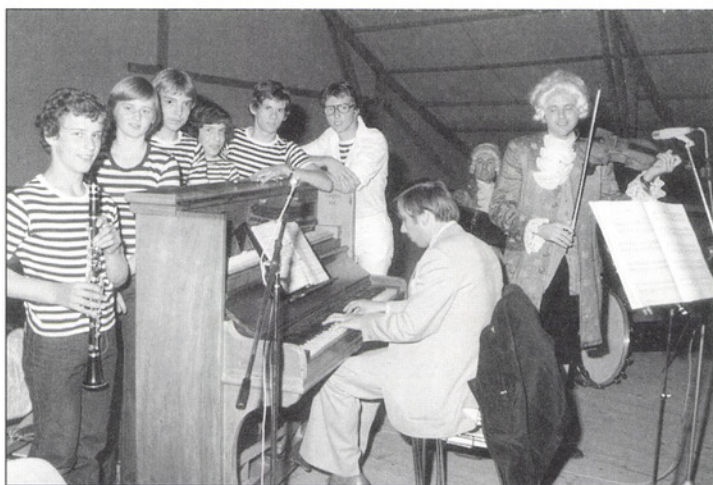
Die Musikschule am Burgfest 1976.

den Eltern suchen; ich scheute mich nicht, wenn nötig eine Besprechung mit einem Bauern auch im Kuhstall während des Melkens zu führen. Natürlich blieben uns als Behörde Enttäuschungen nicht erspart. So sollten wir für die Turnanlage des Schulhauses Leeacher Land erwerben. Die Gemeindeversammlung befand jedoch den ausgehandelten Kaufpreis als zu hoch und verweigerte die Zustimmung. Da der Landeigentümer nicht zu einer Preisreduktion bereit war, mussten wir den Expropriationsweg beschreiten – und zahlten schliesslich einen höheren Preis.