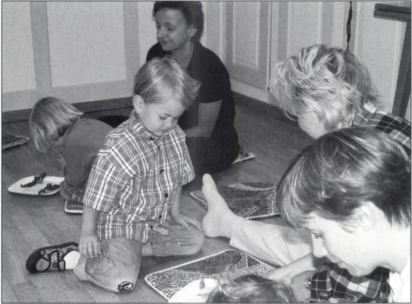
Kinder und Eltern beobachten gespannt das gezielte Vorwärtskriechen einer Häuschenschnecke.