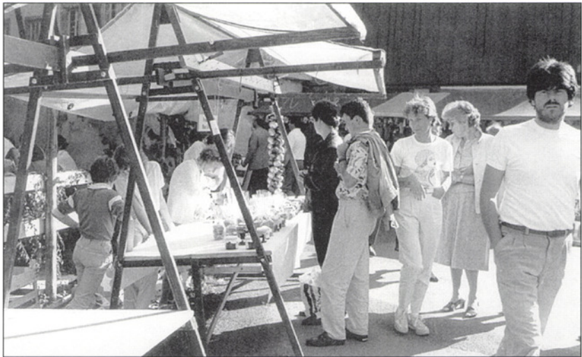
So sah der Chilbimärt in Maur 1987 aus. Noch gab es kein Festzelt.

Daneben hat der Verein vom Tal ein interessantes Programm für Menschen jeden Alters entwickelt und schafft es so, seine Reihen mit aktiven jüngeren Frauen zu ergänzen. Er lädt zu Besuchen von Ausstellungen, Museen und Theatervorführungen ein, organisiert jährlich eine Reise und während des Sommers einmal pro Woche das gemeinsame «Walken». Im November führt er einen Räbeliechtli-Umzug durch und während der Herbstferien seit vielen Jahren das Kerzenziehen in der Mühlenscheune Maur. Dieses erfreut sich immer grösserer Beliebtheit. Nicht zuletzt dank seiner fantasiereichen Leiterinnen. Diese lassen sich laufend neue Ideen und Techniken einfallen, die es jedem leicht machen, schönste Kunstwerke aus Wachs oder Paraffin zu schaffen. Der Erlös fliesst in Projekte für Kinder und Jugendliche.