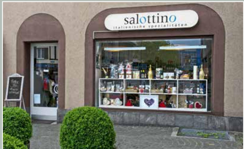
Salottino, Italienische Spezialitäten, Seestrasse 158, 2015.