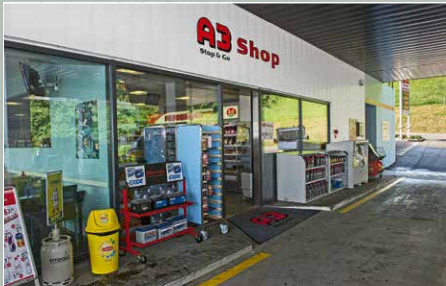
A3-Shop, Zugerstrasse 231, 2015.