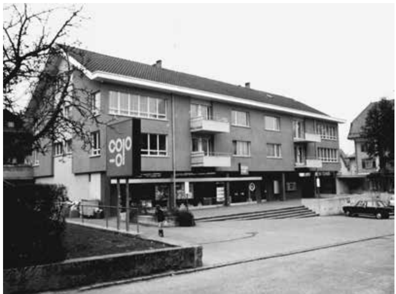
Coop, Glärnischstrasse 68, 1971.

In den Chroniken der Folgejahre scheint es keine nachhaltigen Ereignisse des Konsumvereins mehr gegeben zu haben. In den 1970er-Jahren fasste der Coop auch in der Gemeinde Horgen Fuss. Heute gibt es in Horgen keinen Konsumverein und keine Konsumgesellschaft mehr. Neben verschiedenen Grossverteilern bieten Detaillisten und Bauern ihre Produkte an. Wie die Zukunft aussehen wird? Eine Prognose ist schwierig, tendenziell dürften kleine Geschäfte wohl im Verkauf von Nischenprodukten und Spezialitäten erfolgreich sein. Weiter dürfte auch der Einkauf mittels Internet zunehmen. Hier erfolgt die Warenlieferung direkt bis zur Haustür. Bereits heute gibt es kaum mehr etwas des täglichen Bedarfs, das nicht in dieser Form einzukaufen ist. Der eingangs erwähnte Einkaufstourismus ins nahegelegene Ausland dürfte aufgrund der derzeitigen Frankenstärke wohl fortbestehen.