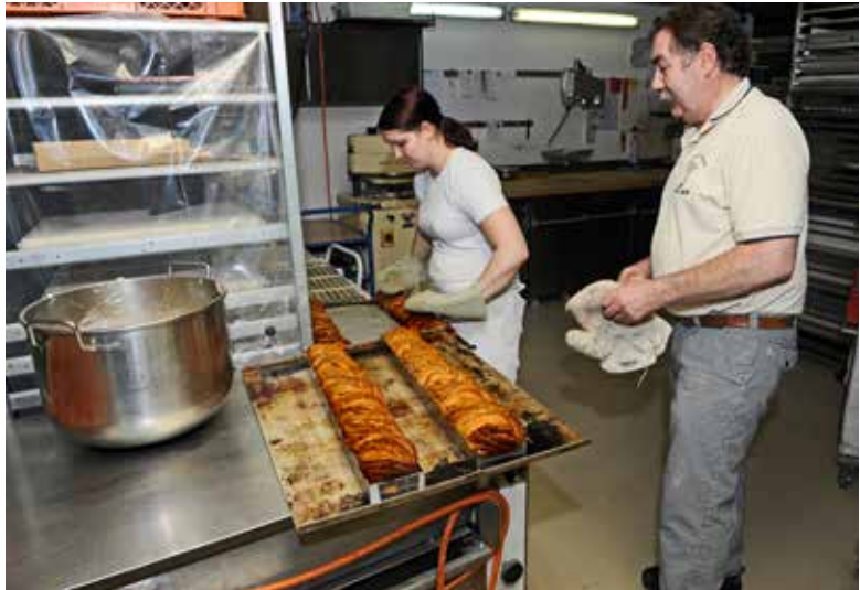
Frischer Haselnusshefestollen aus dem Ofen, 2015.

Wie ist die Nachfrage für eine Lehrstelle als Bäcker/Konditor?