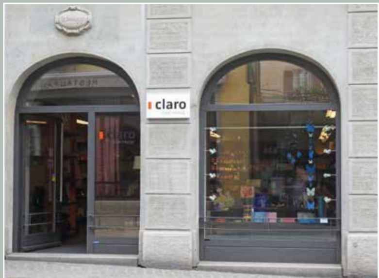
Claro Weltladen, Zugerstrasse 8, 2015.