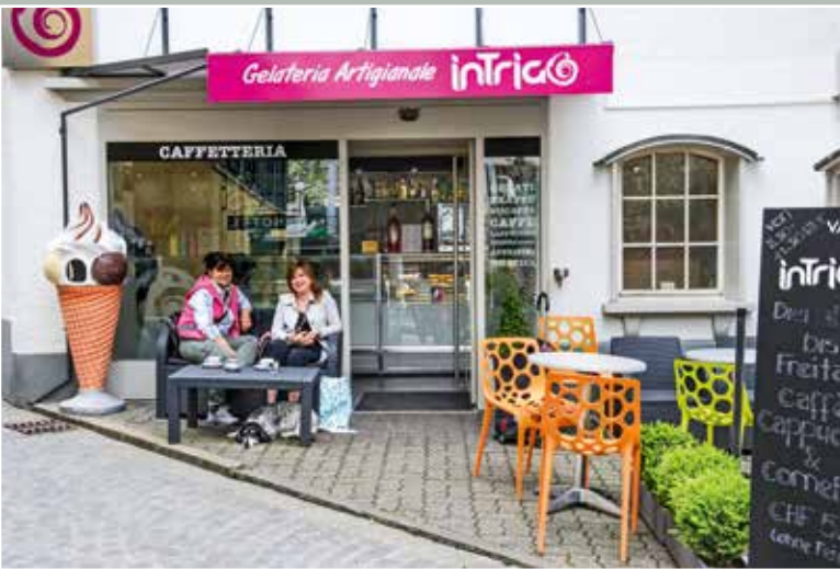
Gelateria Artigianale Intrigo, Schwanengasse 3, 2015.