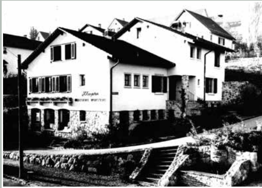
Metzgerei & Wursterei Eugster, Ecke Einsiedler-/ Rotbühlstrasse, 1961.