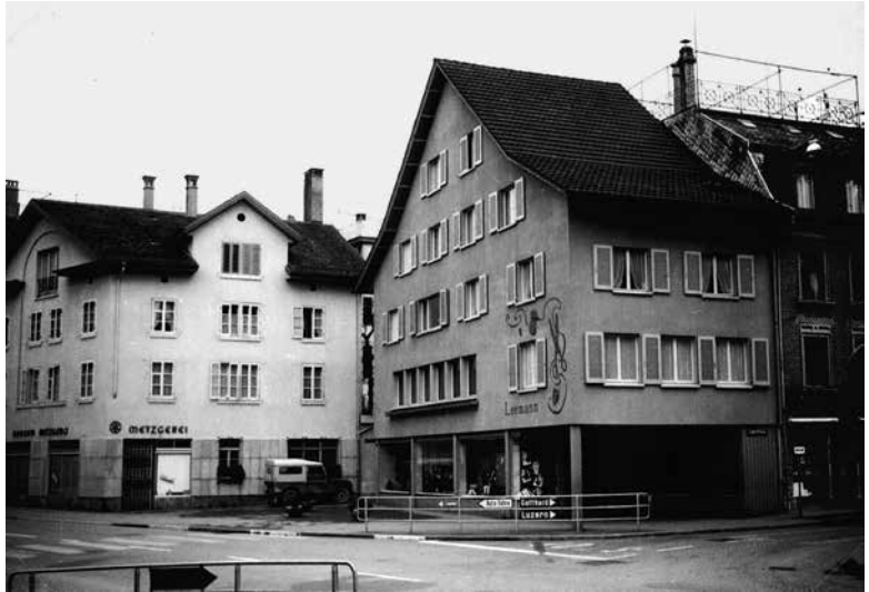
Konsummetzg (links), heute Seestrasse 158, 1958.