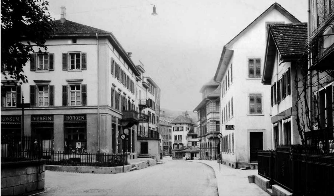
Konsumverein Horgen, heute Seestrasse 166, 1934.

Der Einkauf von günstigen Lebensmitteln beziehungsweise deren Bereitstellung ist nicht erst in jüngster Zeit zum Thema geworden. Heute wird diese Thematik insbesondere auch mit dem Einkaufstourismus ins nahe Ausland in Verbindung gebracht. Das Bedürfnis, die Lebensmittel möglichst zu einem günstigen Preis einkaufen zu können, gehörte bereits zu den Forderungen der Arbeiterbewegung. Seit etwa 1840 umfasst dieser Begriff die Gesamtheit der Bestrebungen, durch Zusammenschlüsse und kollektives Handeln in allen Bereichen der Gesellschaft deren ökonomische, soziale, politische und kulturelle Emanzipation zu fördern. Dazu gehörte auch das Bedürfnis nach günstigen Lebensmitteln.