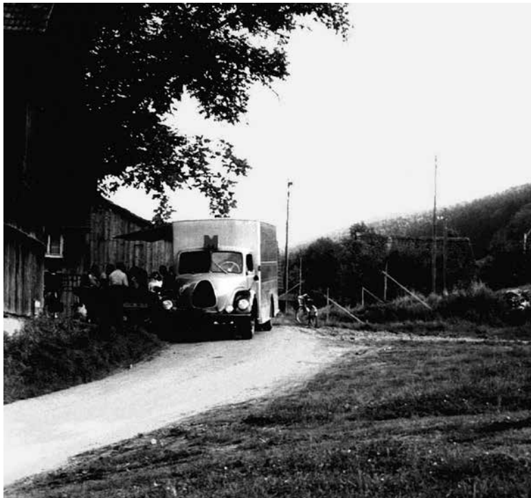
Migroswagen in der Füchsenwies, 1958.

Wer hätte damals gedacht, als im August 1925 die ersten fünf Ford-Lastwagen der eben ins Leben gerufenen Migros in Zürichs Aussenquartieren auffuhren, dass damit der Grundstein für einen der wichtigsten Grossverteiler in der Schweiz gelegt wurde. Gottlieb Duttweiler übernahm damit das System von Henry Ford, der Ford T-Modelle in fahrende Läden umbaute und damit zehntausende seiner Arbeiter mit Haushalts- und Lebensmitteln versorgte.