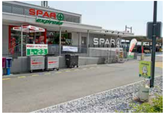
Spar Express, Seestrasse 117, 2015.

kochen Volg, Spar und die Avec-Läden der Valora Gruppe. Sie finden sich vor allem in ländlichen Gegenden und in der Umgebung von Verkehrsknoten wie zum Beispiel an Bahnhöfen. In Horgen findet sich aus dieser erweiterten Gruppe der Supermärkte nur der 2013 eröffnete Spar Express beim Bahnhof.