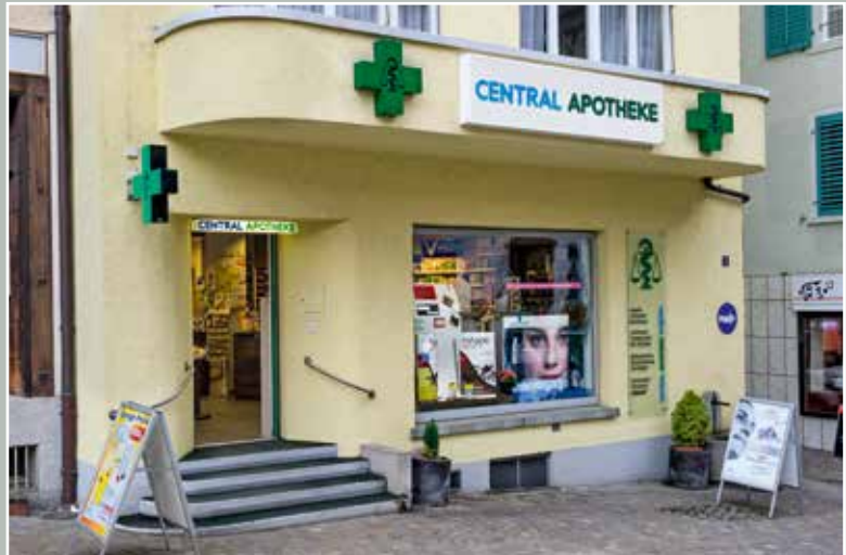
Central-Apotheke, Dorfgasse 5, 2015.