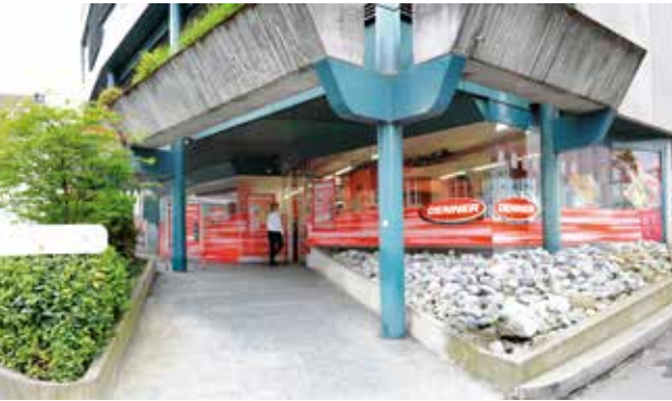
Denner an der Kirchstrasse, 2015.