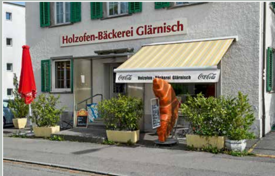
Holzofen-Bäckerei Glärnisch, Glärnischstrasse 49, 2015.