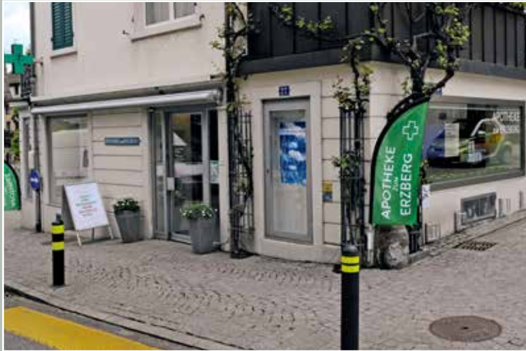
Apotheke und Drogerie zum Erzberg, Zugerstrasse 27, 2015.