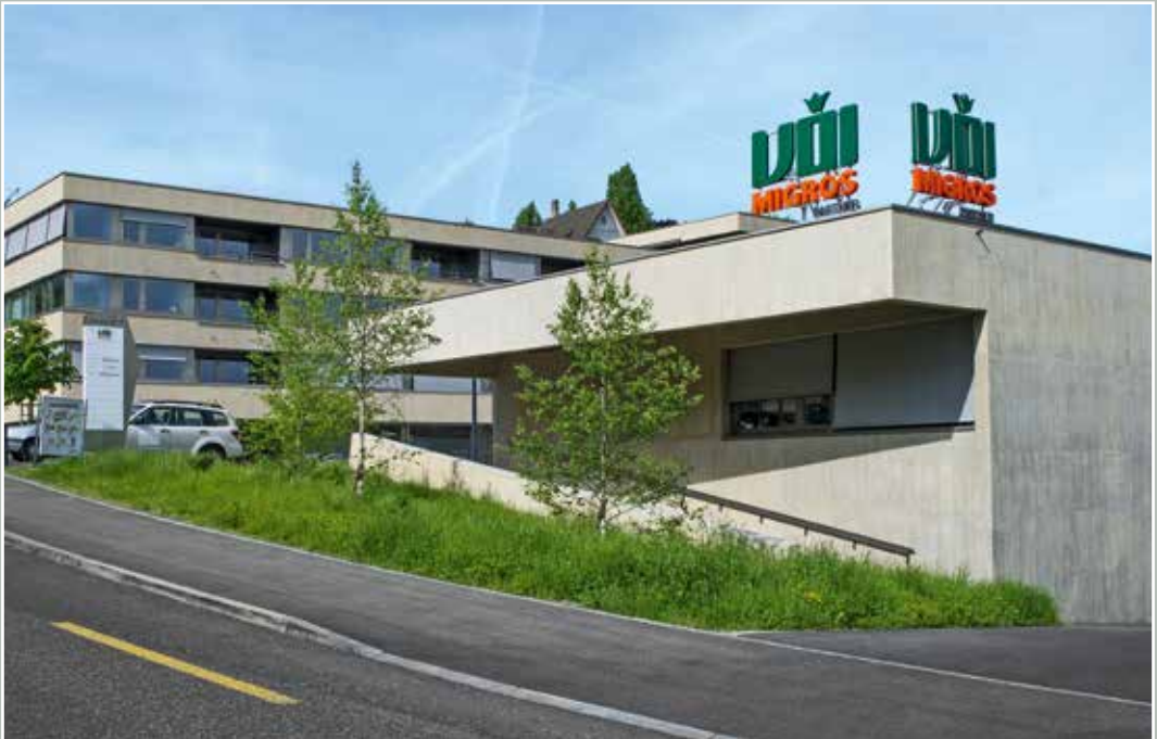
VOI Migros, Ecke See-/Waidlistrasse, 2015.