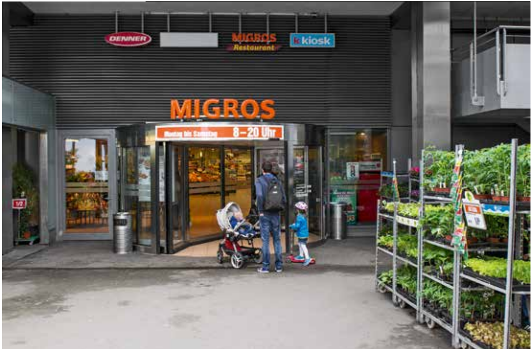
Migros Schinzenhof, 2015.

Nicht nur die Migros war ein willkommener Verkäufer von günstigen Lebensmitteln. Schon Mitte des 19. Jahrhunderts wurden sogenannte Konsumgenossenschaften gegründet, welche die Lebensmittel für ihre Mitglieder zu verbilligten Preisen verkauften. Auch die Entwicklung des zweiten Grossverteilers Coop gründet auf Selbsthilfeorganisationen in Arbeiterkreisen, aber auch auf bürgerlicher Seite (Philanthropen). Was 1840 begann, führte dazu, dass 1852 auch in Horgen ein Landkonsumverein seine Tore öffnete. 1960 bestanden 3320 Verkaufsstellen in der Schweiz. Das Coop-Signet wurde eingeführt, so wie wir es heute noch kennen. 1990 feierte Coop Schweiz sein 100-jähriges Bestehen.