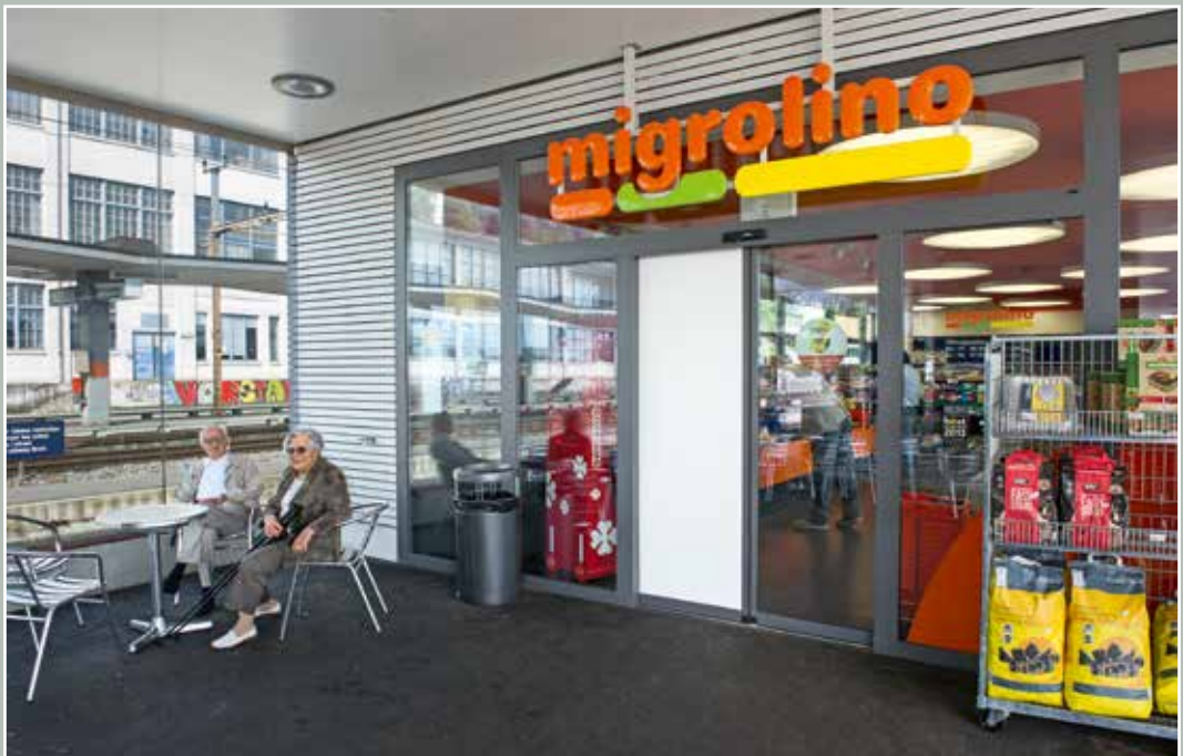
Migrolino, Bahnhof Oberdorf, 2015.