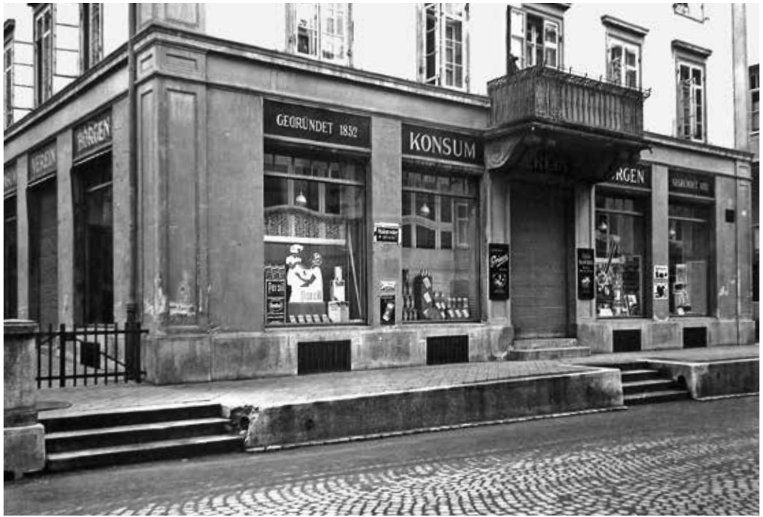
Konsumverein Horgen, heute Seestrasse 166, 1934.