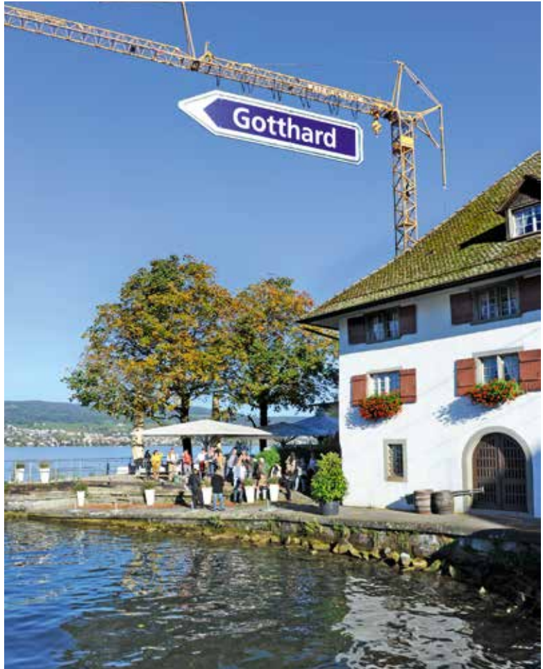
Kulturmeile Gotthard, 3.–26. Oktober 2014.