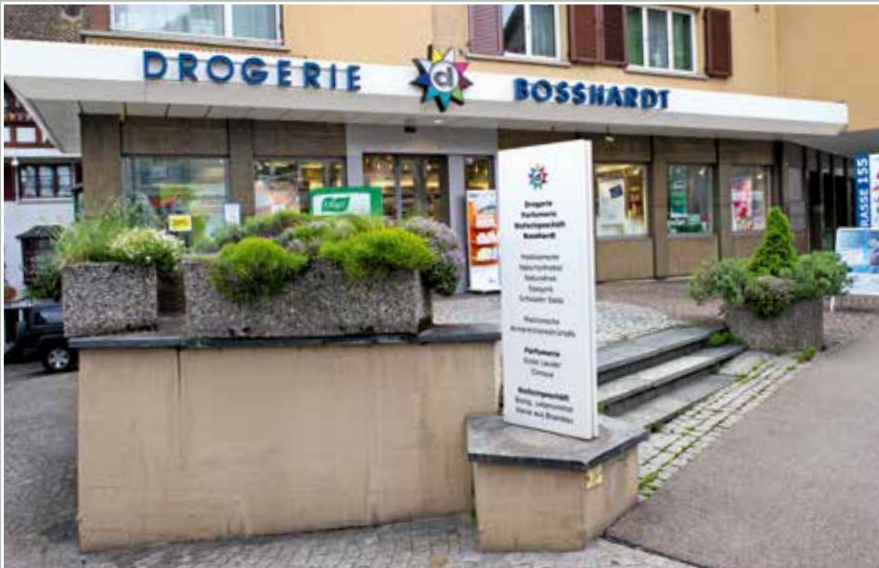
Drogerie Bosshardt, Seestrasse 155, 2015.