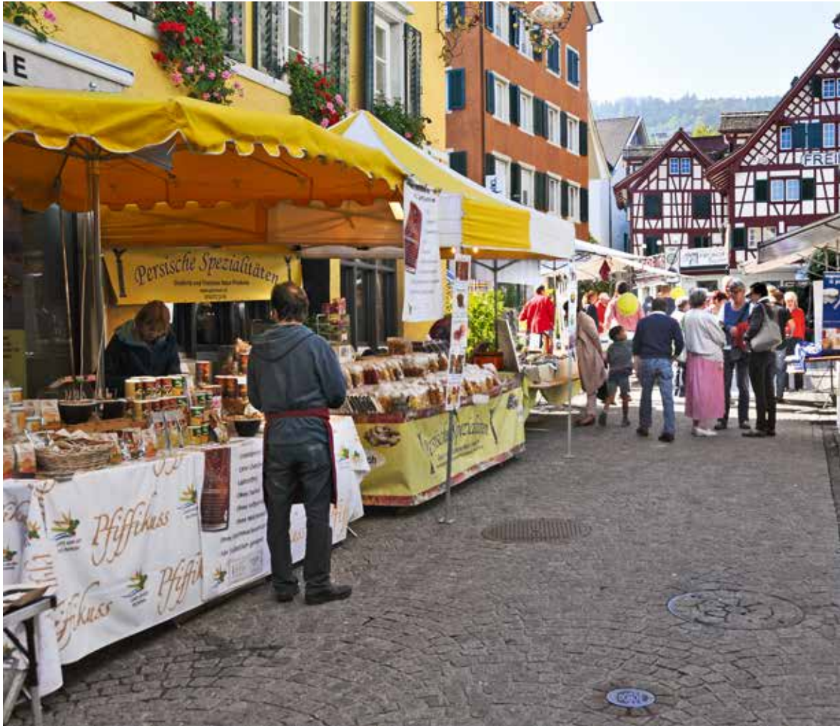
«Herbstmärt» von Pro Horgen auf der Zugerstrasse, 2014.