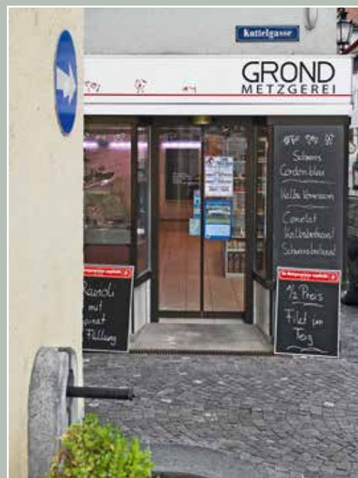
Metzgerei Grond, Dorfasse 15, 2015.