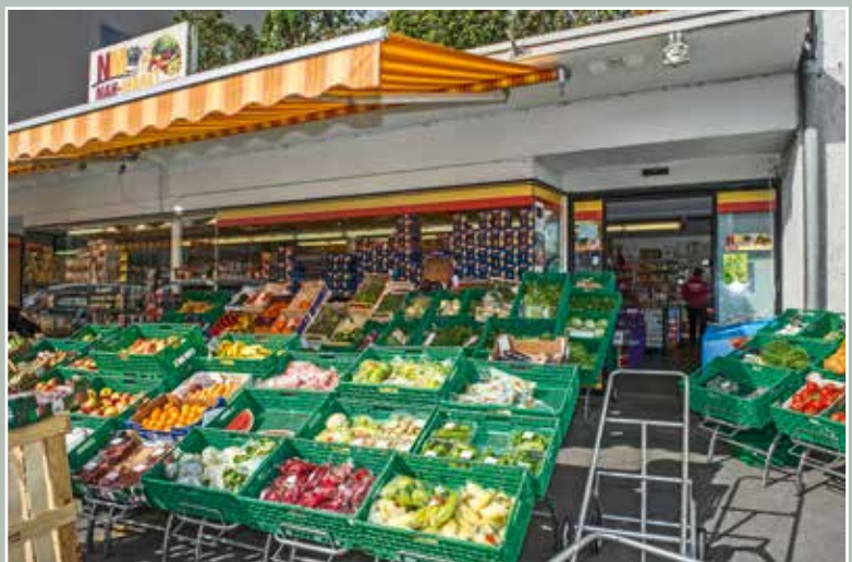
Nah-Markt, Einsiedlerstrasse 64, 2015.