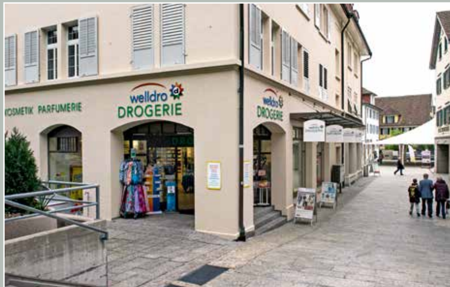
Welldro Drogerie, Dorfplatz 3, 2015.