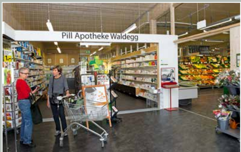
Pill Apotheke und Coop, im Provisorium Waldegg-Center, 2015.