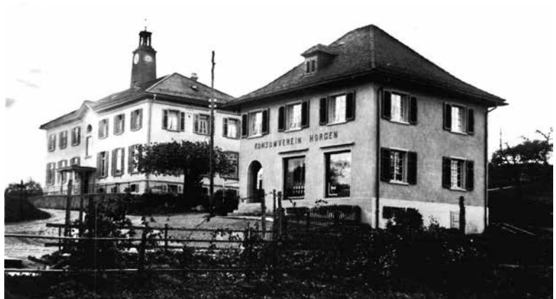
Konsumverein Horgen, Wüeribach, 1940.

Wegen der hohen Fleischpreise verbanden sich 1908 rund 300 Interessenten zu einer weiteren Konsumenten-Vereinigung. Diese Vereinigung eröffnete einen Metzgereiladen im Kolhoppen und kaufte das Fleisch von der Konsumgenossenschaft Basel. Damit verfügte Horgen über drei verschiedene «Konsumgesellschaften». Noch 1908 fusionierte die Konsumentenvereinigung mit der Allgemeinen Konsumgenossenschaft. Auch die ebenfalls zu jener Zeit aus den gleichen Kreisen gebildete Milchgenossenschaft schloss sich 1910 der Allgemeinen Konsumgenos-