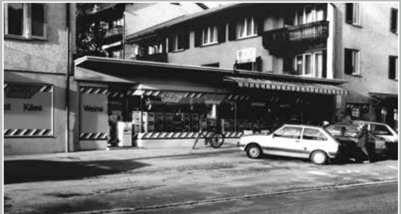
Peter Lüchinger, Einsiedlerstrasse 64, 1988.