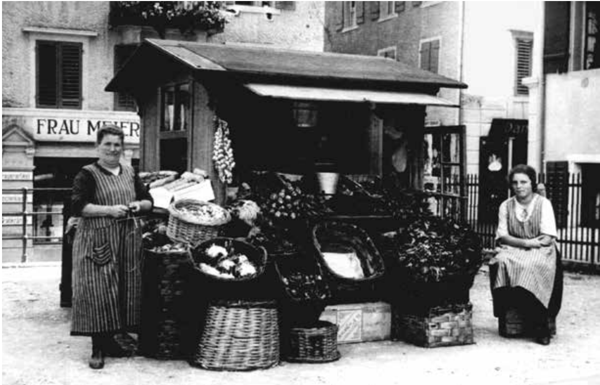
Gemüseverkauf auf dem alten Schulhausplatz.