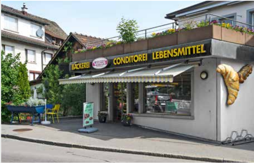
Bäckerei Vetterli, Seestrasse 305, 2015.