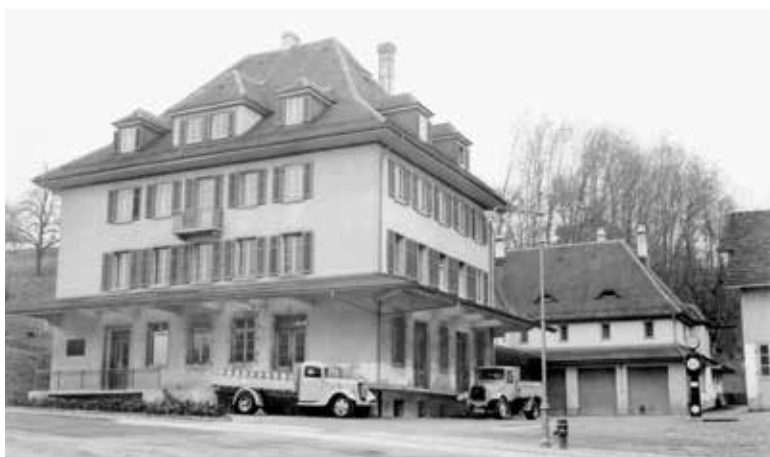
Molkereigebäude im «Molki-Rank», Zugerstrasse 90, 1937.