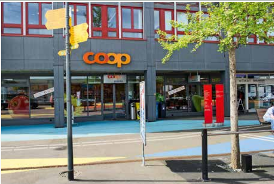
Coop Pronto, Bahnhofstrasse 6, 2015.