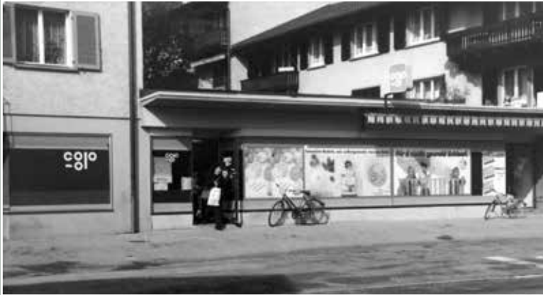
Coop-Filiale, Einsiedlerstrasse 64, kurz vor der Schliessung 1988.