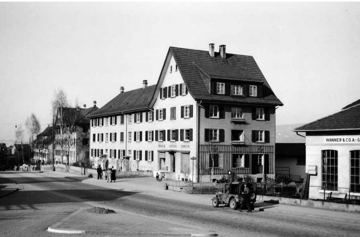
Konsumverein Horgen, Seestrasse 41, 1960.

angestrebt; in der Öffentlichkeit war noch nicht allzuviel davon zu spüren; jeder besuchte noch «sein» Wirtshaus bzw. hatte seinen Metzger. Dies ist auch heute teilweise noch nicht ganz verschwunden.