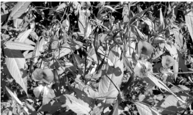
Drüsiges Springkraut – findet sich in Russikon entlang von Bächen und auf Waldlichtungen.

Die Naturschutzkommission Russikon orientiert mit Artikeln in loser Folge über die Neophyten-Problematik. Bisherige Artikel stellten die wichtigsten Neophyten-Arten und Alternativen dazu vor. In den nächsten Wochen verschickt die Gemeinde allen Haushaltungen einen Flyer mit der Beschreibung von problematischen Arten mit Vermeidungs- und Bekämpfungshinweisen. Damit ist die Absicht verbunden, die Bevölkerung zum Mitdenken und –arbeiten zu motivieren. Am 8. Juli 2017 bietet die Gemeinde weiter einen Beratungstag an. Interessierte können sich in ihrem Garten von einem Fachmann beraten lassen.