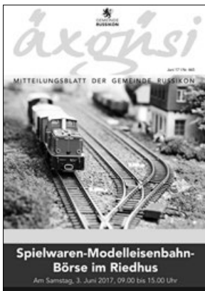
siehe Seite 18