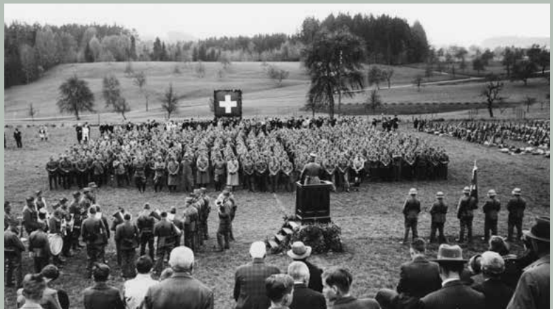
Feldpredigt für die Ortswehr auf dem Sportplatz Schönegg-Wädenswilerberg, 19. April 1942.