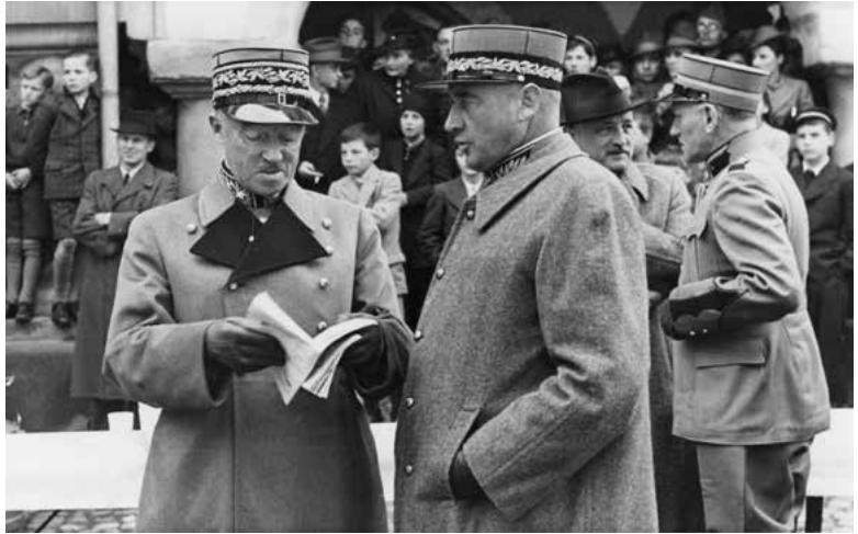
General Guisan, hier in Wil, 20. Oktober 1940.

hergerichtet werden, wenn man diesen und jenen Tisch von der Stubenmitte an die Wand schiebe, damit man auf dem Boden die Matratzen auslegen könne, da bekreuzte sich der Mann regelrecht und erklärte mir rundweg, so etwas gebe es bei ihm nicht, er und seine Frau wollten in richtigen Betten schlafen und der Esszimmertisch dürfe nicht weggerückt werden, denn er sei es sich gewohnt, an einem bestimmten Platz sein Essen einzunehmen usw. Da blieb mir nichts anderes übrig, als eben die Ausbeute an Lagerstätten nach Vorschrift vorzunehmen und dem Mann für den Fall einer Durchgangsevakuierung mindestens 5 Schlafgänger zuzuteilen, Lebensgewohnheiten hin oder her.