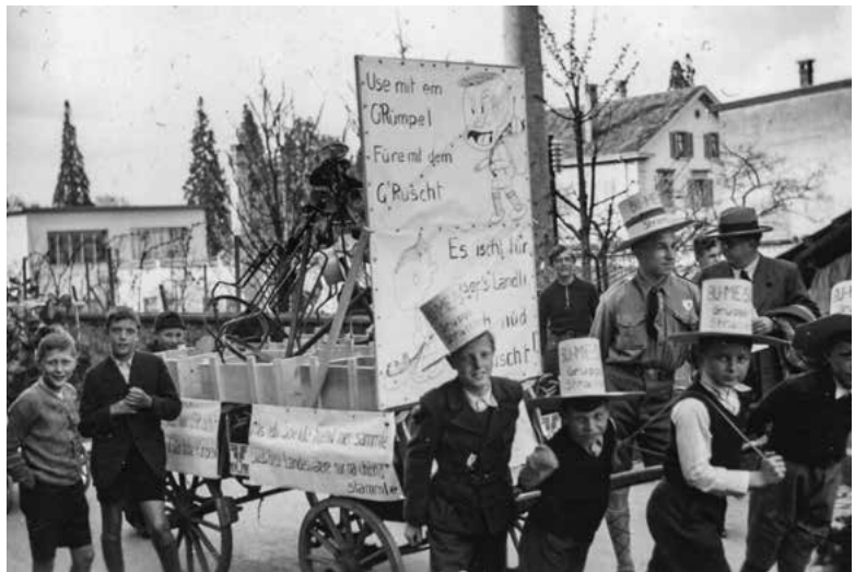
Metallspende für Arbeit und Brot, 1942.

Auf Mittwoch [22. April] 7.30 Uhr war die gesamte Helferschaft der Metallspende für Arbeit und Brot auf den Sekundarschulhausplatz aufgeboten. Als Sammlungskreise waren die Volkszählungskreise bestimmt worden. Jede Sammlergruppe stand unter der Leitung und Aufsicht einer Vertrauensperson, der ein Gewerbeschüler als Metallprüfer zur Seite stand, während die Buben der oberen Volksschulklassen als Zuträger des Spendegutes und Zugrösslein Beschäftigung hatten. Diese Bevorzugung der Buben hatte aber gelegentlich etwas den Neid der Mädchen erweckt, und man traf deshalb Mädchen, die ebenfalls wacker Hand ans Werk legten und damit zeigen wollten, dass sie nicht minder tüchtige Helfer gewesen wären. (...) Das Ergebnis der Buntmetallspende darf als recht gut bezeichnet werden. Zusammen mit dem Sihlwald sind rund 7 Tonnen Kupfer, Messing, Zink und Zinn gesammelt worden, worunter 66 Kilo Zinntuben und 209 Kilo «Silberpapier». Bereits haben auch drei Vereine in entgegenkommender Weise insgesamt 16 kg Buntmetall in Form von Kannen, Bechern und Tellern abgeliefert, so dass Horgen genau gewogen 6974,5 kg Buntmetall auf den Opfertisch des Vaterlandes gelegt hat.