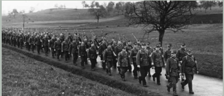
Horgner Ortswehr, 19. April 1942.