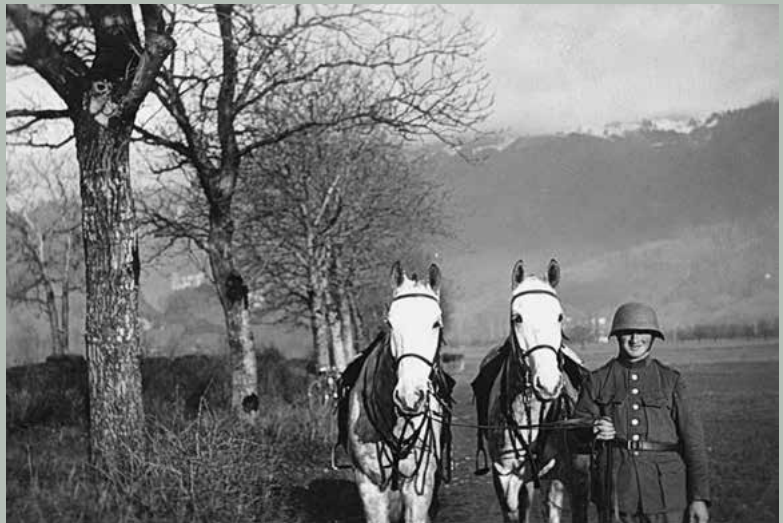
Ernst Kreis im Aktivdienst, 1940.

Wer vor dem Einrücken zu einer ausreichenden Fusspflege keine Gelegenheit hatte, hat sich bei der sanitärischen Eintrittsmusterung am Einrückungstag zu melden.