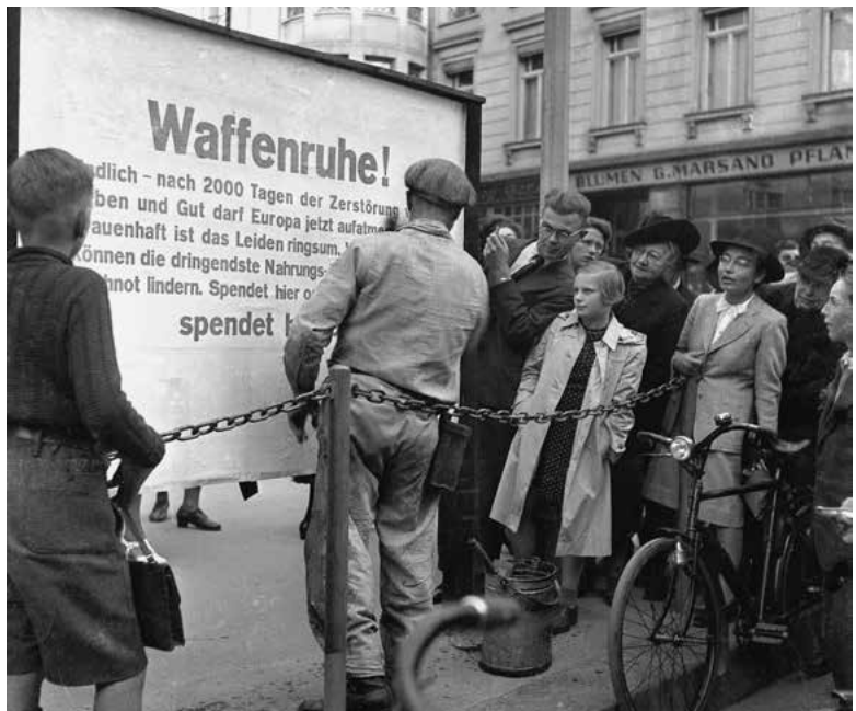
Tag der Waffenruhe am 8. Mai 1945.