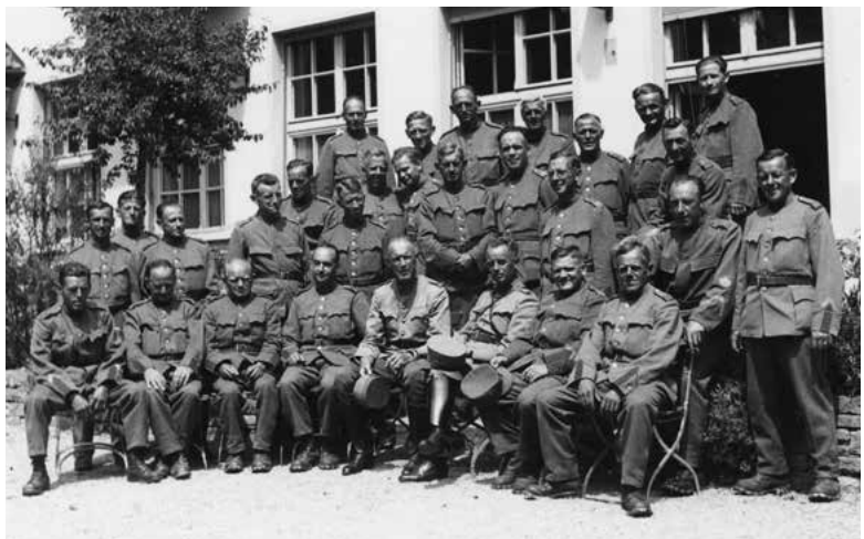
Territorial-Bataillon 157 im Aktivdienst.

Unsere Territorialen, die 157er, sind heute Vormittag endlich entlassen worden. Mit dem ersten Mittagzug kehrten die meisten nach Horgen zurück, wo sie trotz starken Regens von ihren Kindern freudig empfangen wurden. In sehr vielen Familien ist man glücklich, dass der Vater nach genau 100 Tagen Dienst endlich wieder daheim ist, zum Rechten sehen und seiner Arbeit nachgehen kann, wodurch wieder Verdienst ins Haus kommt. Froh über die Entlassung sind namentlich jene Gewerbetreibenden, die ihren Betrieb während der Dienstzeit ganz oder teilweise schliessen mussten. Die zum schönen Teil schon zwischen 40 und 48 Jahre alten Männer sind fast ausnahmslos körperlich in ausgezeichneter Verfassung, und sie erklären, die Grab- und Befestigungsarbeiten im Limmattal und später in Wollishofen hätten sie, obschon meistens abscheuliches Wetter herrschte, körperlich sehr gestärkt und sie hätten dabei betonieren gelernt wie richtige Muratori. Auch die Verpflegung sei ausgezeichnet gewesen.