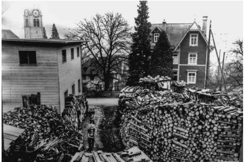
Das Holzpflicht-Lager der Firma Abegg, um 1942.

Die zusätzliche Unterstützung der Wehrmannsfamilien wurde vom Gemeinderat als Sache der Kriegsfürsorgekommission bezeichnet. Dieser werden, soweit nötig, Mittel aus dem Gemeindegut zur Verfügung gestellt. Der Gemeinde Horgen ist eine zusätzliche Brennholzbeschaffung von 140 Ster auferlegt worden. Mit diesen beiden Mitteilungen schliesse ich mein «Tagebuch aus ernster Zeit» ab.