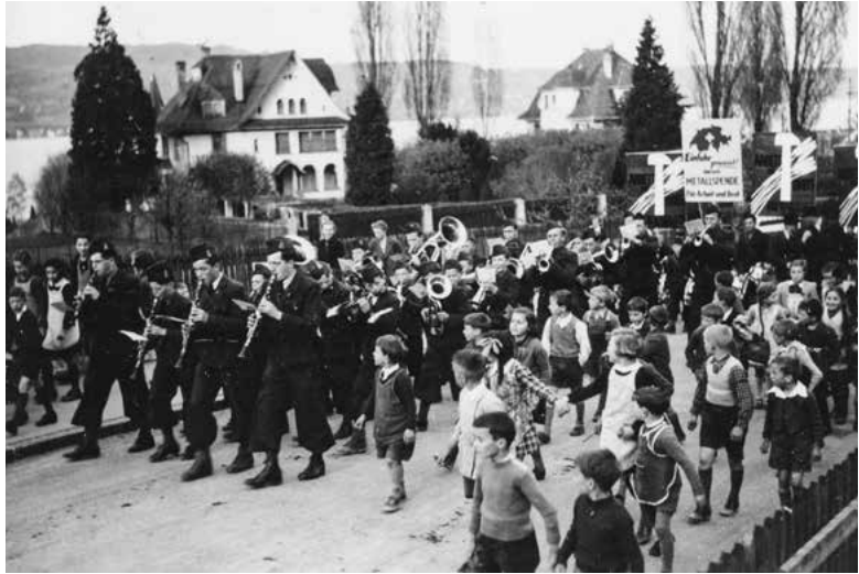
Metallspende für Arbeit und Brot, 1942.