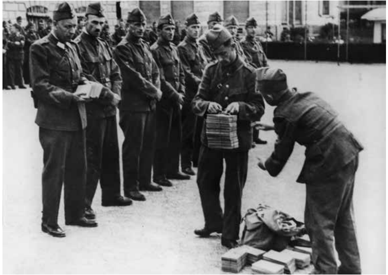
Verteilung der Dienstbüchlein auf dem Schulhausplatz, 1939.