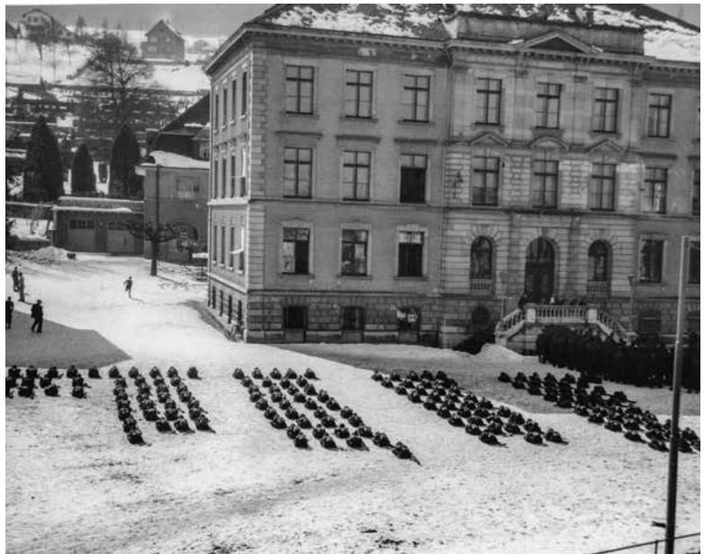
Einquartierung im Schulhaus Dorf.

Auf heute Nacht hat der General für den grössten Teil der Schweiz mit Ausnahme eines breiten Grenzstreifens gegen die kriegführenden Mächte hin die Verdunkelung angeordnet. Sie klappt hier in Horgen ausgezeichnet. (...) Es fällt indessen auf, wie wenig Ehr- und Schamgefühl in dieser Dunkelheit eine gewisse Sorte Weiblichkeit bekundet, die mit den welschen Truppen in einer Weise verkehrt, die auf die Vorübergehenden einen peinlichen Eindruck macht. In den Wirtschaften im Dorfkern ist viel Leben; es sind zur Hauptsache welsche Wehrmänner, die ihre Soldatenlieder erschallen lassen.