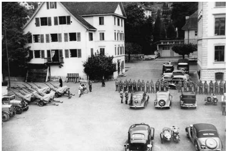
Einquartierte Soldaten auf dem Schulhausplatz Dorf.

Am 23. November zieht «unser» Regiment in die Manöver und kehrt nicht wieder nach Horgen zurück.