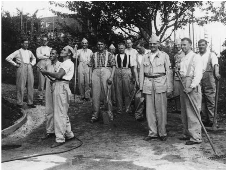
Horgner Luftschutzmannschaft, 1940.

Die Rohstoffbeschaffung war allerdings mit noch grösseren Schwierigkeiten als im Vorjahre verbunden und die hierfür zu zahlenden Preise waren enorm gestiegen. Die grosse Anzahl von Bestellungen aus Deutschland kann darauf zurückgeführt werden, dass die deutsche Textilmaschinenindustrie infolge Einberufungen von Personal einerseits und für Kriegslieferungen andererseits überbeschäftigt war. Wohl deshalb wurden fast ausschliesslich Hochleistungsmaschinen verlangt, um erstens eine grosse Produktion zu erhalten und zweitens die verschiedenen Ersatzprodukte wie Zellwolle, Mischgarne, Papiergarne usw. verarbeiten zu können. Dies erforderte für unsere Horgener-Textilmaschinen-Industrie eine wesentliche Umstellung. Es gelang aber z.B. der erfahrenen Firma