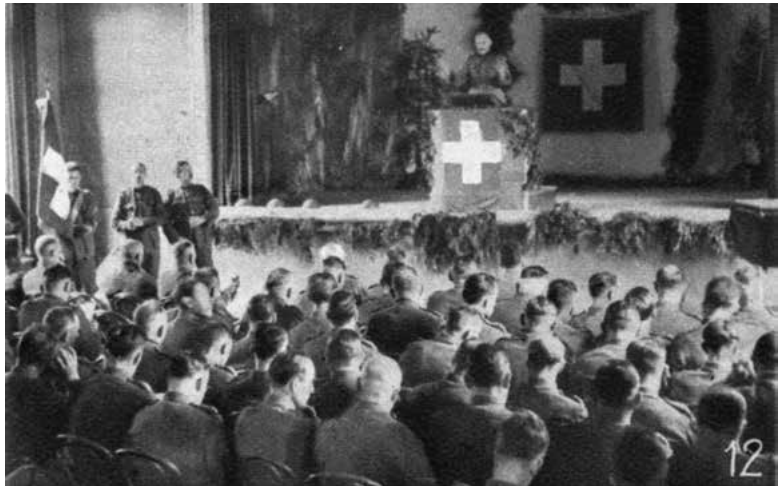
Feldgottesdienst im Saal des Hotels Meierhof, 17. September 1939.

Rumpedi-rumpedi-rumpedibum! Öfters im Tag vernimmt man im Dorf Trommelschlag. Und stets sieht man dann unsere 155er zur Übung aus-