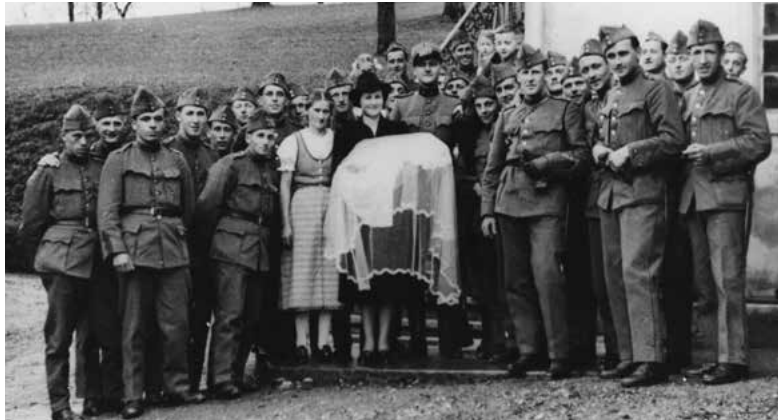
Füsilierzug als Götti für ein neugeborenes Kind.