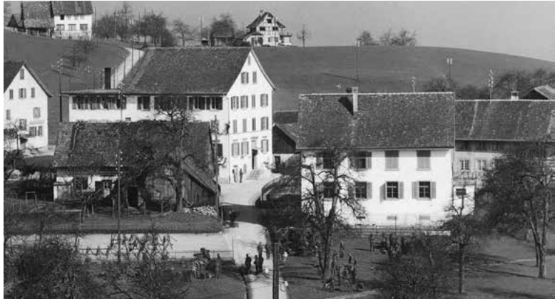
Soldaten in Hirzel-Höchi, August 1943.