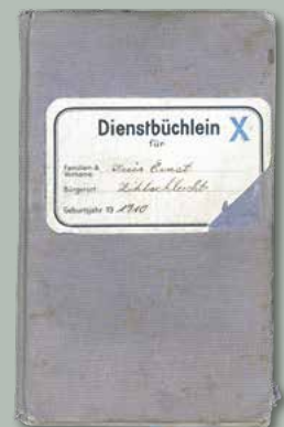
Dienstbüchlein von Ernst Kreis.

Wer nicht zu Hause regelmässige Fusspflege treibt, soll mindestens 14 Tage vor dem Einrücken die Füsse regelmässig einmal täglich kalt waschen (nicht baden!) und nach dem Abtrocknen mit Armee-Formalin Fusspulver einreiben, besonders auch zwischen den Zehen; auch in die Socken oder Strümpfe soll Fusspulver eingestreut werden. Wer besonders empfindliche Füsse hat, d. h. besonders stark an Fusschweiss leidet, soll das Fusspulver zweimal täglich anwenden. Das Armee-Formalin Fusspulver «Arfol», das zu billigem Preis in Apotheken und Drogerien bezogen werden kann, hat eine austrocknende Wirkung auf die Haut und macht sie widerstandsfähiger gegenüber den Schädigungen des Fusschweisses. Diese Behandlung ist ganz unschädlich und hat keinerlei nachteiligen Einfluss auf die allgemeine Gesundheit.