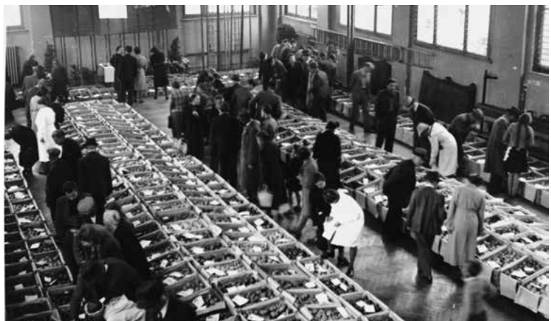
Obstmesse in der Turnhalle Dorf, 24./25. Oktober 1942.

Misswachstum zufolge ungünstiger Witterung und Krieg haben bewirkt, dass diesen Herbst für Lebensmittel, die man für den Winterbedarf einkellert, Preise verlangt werden, die vielen Käufern ernstliche Sorgen bereiten. Zwei Beispiele mögen dies veranschaulichen. Für Kartoffeln, die ich beim Vermittler selber abholte, bezahlte ich heuer 18 Fr. die 100 Kilo; letztes Jahr aber erhielt ich das gleiche Quantum für 12 Fr. in den Keller geliefert. Äpfel bester Qualität erhielt ich letztes Jahr von meinem alljährlichen Lieferanten, einem hiesigen Landwirt, für 29 Fr. den Kilozentner, auf der vom Landwirtschaftlichen Verein und vom Konsumverein veranstalteten Obstmesse zu 36 Rappen das Kilo. Heute muss ich überhaupt froh sein, wenn mir der Bauer, welcher mich schon 22 Jahre lang mit Obst versorgt hat, überhaupt Äpfel geben kann. Und billig werden sie auch nicht sein. Ein hiesiger Obsthändler erklärte mir, es werde jetzt schon für Lagerobst bis 65 Rp. pro Kilo Produzentenpreis verlangt.