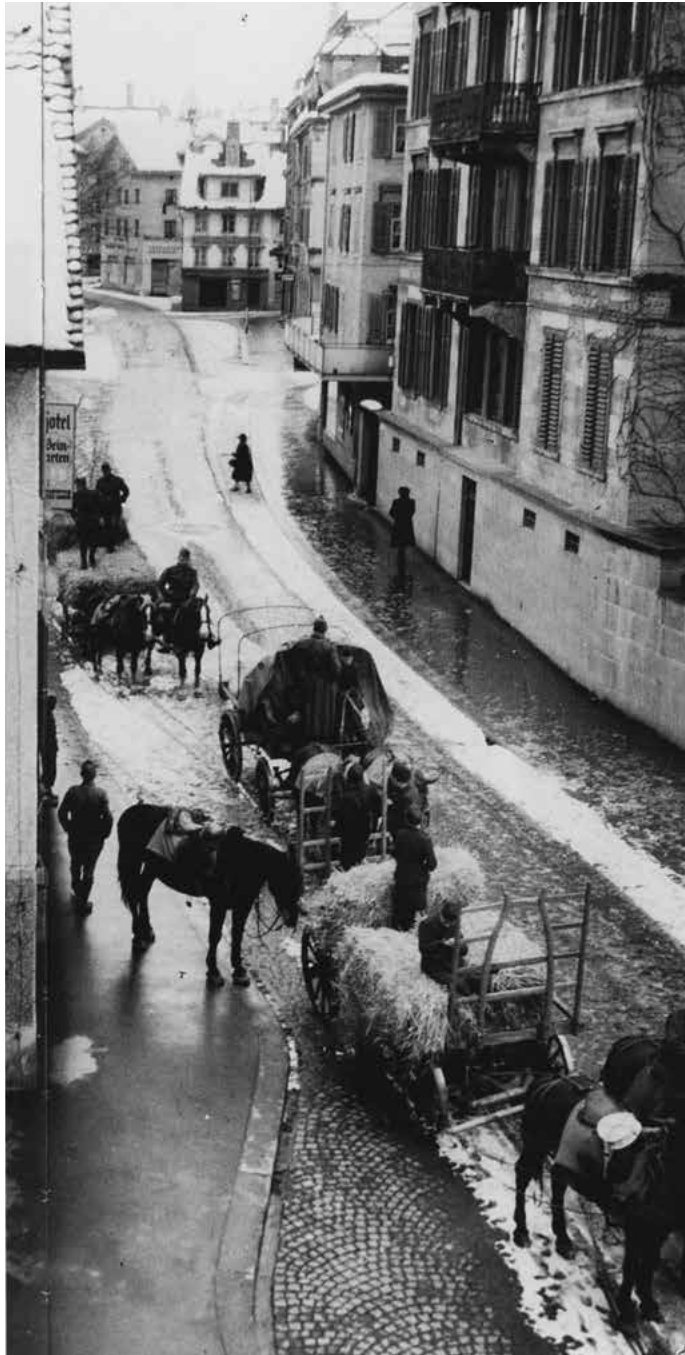
Militärische Fuhrwerke auf der Seestrasse, um 1940.