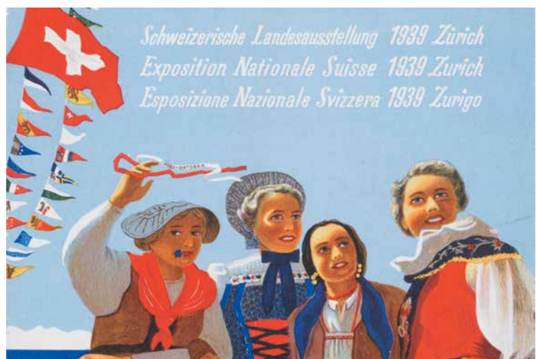
Werbung für die Schweizerische Landesausstellung 1939.

Unser Kleiner ist seit letzten Sonntag bei den Grosseltern mütterlicherseits in Zürich in den Ferien. So sehr wir an unserm Einzigem hängen, haben wir ihn doch gerne für 14 Tage weggegeben, denn wenn meine Frau neben ihrer ausserordentlichen Tätigkeit an unserer Schule noch den Haushalt besorgen und ein Kind betreuen muss, hat sie damit eine Kriegslast zu tragen, die ihre Kräfte erheblich in Anspruch nimmt. Sie leistet ihre doppelte Aufgabe und Pflicht aber mit bewunderungswürdiger Ruhe, Besonnenheit und Zielsicherheit. Heute Sonntag wollten wir beide aber einmal gänzlich ausspannen. Wir nahmen uns deshalb vor, die Landi zu besuchen und dabei vormittags die als Landesausstellungsveranstaltung geschaffene Ausstellung «Zeichnen, Malen, Formen» im Zürcher Kunst-