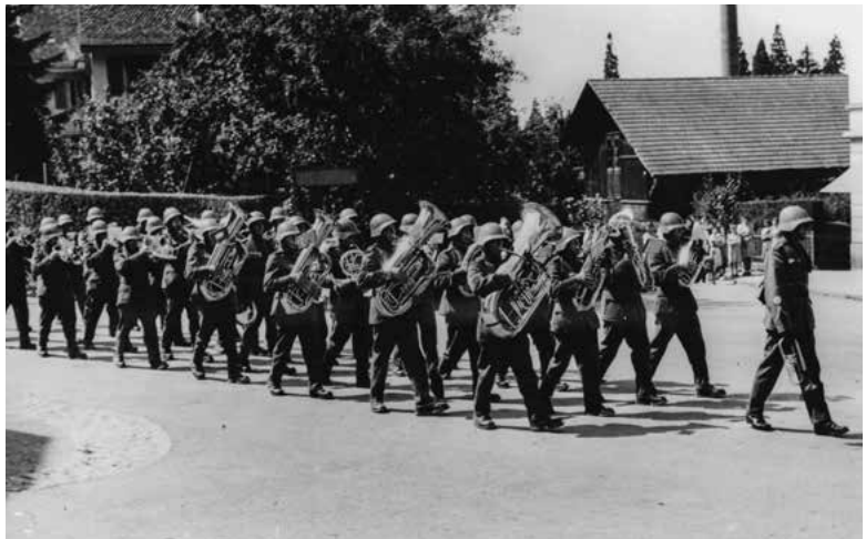
Regimentsspiel an der Kreuzung Stockerstrasse/ Alte Landstrasse.

Wahrlich, unsere welschen Truppen wissen, wie man Aufmerksamkeiten mit Aufmerksamkeiten vergilt. Heute Vormittag gab ihre aus 15 Mann bestehende Musik im Dorf an verschiedenen Orten Ständchen und erfreute namentlich die Insassen unserer Anstalten mit dankbar aufgenommenen Platzkonzerten.