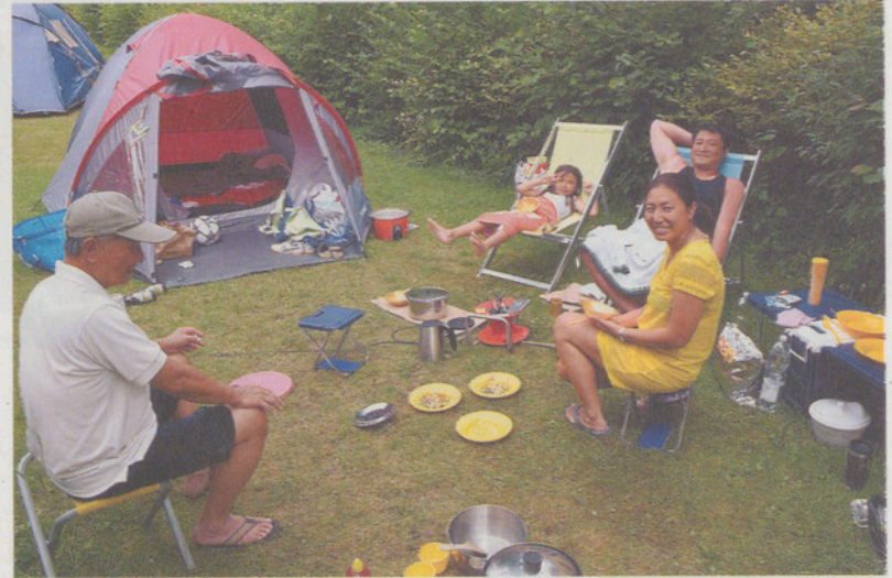
Die Chis sind Campingfans.

Die Eltern sind beide im Gesundheitswesen in London tätig und verdienen weit weniger, als sie es hier in der Schweiz bei gleicher Tätigkeit tun würden. Sie möchten gerne verlängern, so gut gefällt es ihnen am Greifensee; aber der nächste Campingplatz in der Nähe von Mailand sei bereits gebucht. Ihre Kinder profitieren nochmals von einer milden Sommernacht und spielen zusammen mit anderen Kindern Fussball.