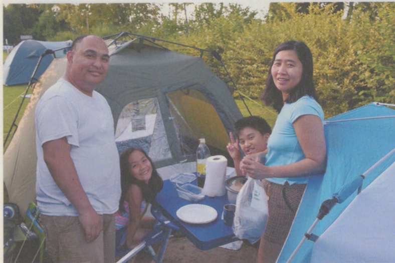
Die Bwogs stammen aus London.

Verschmitzt, während er seine Katze kraut, gibt er zu verstehen, dass es ihm hier ausserordentlich gut gefalle auf dem Campingplatz – alles sauber, gut organisiert, nicht so wie in Italien. Er lacht. Hin und wieder steigt er auf sein Fahrrad und umrundet den Greifensee; seine Tigerkatze bewacht während seiner Abwesenheit den Camper.