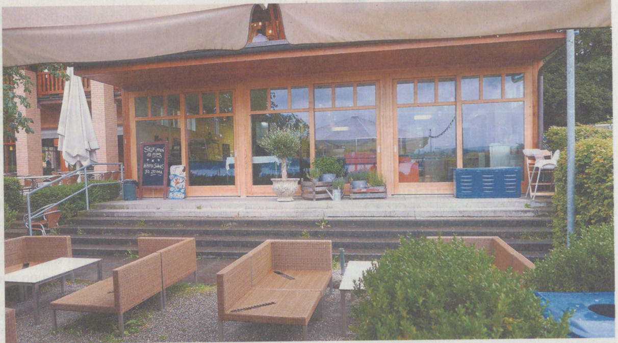
Der Self-Service bei der «Schiffflände» soll einen neuen Namen erhalten – die Leser der «Maurmer Post» dürfen wählen.

Eine tolle Sache ist, dass das Freddy Burger Management (FBM) sich entschieden hat, dass die Maurmer