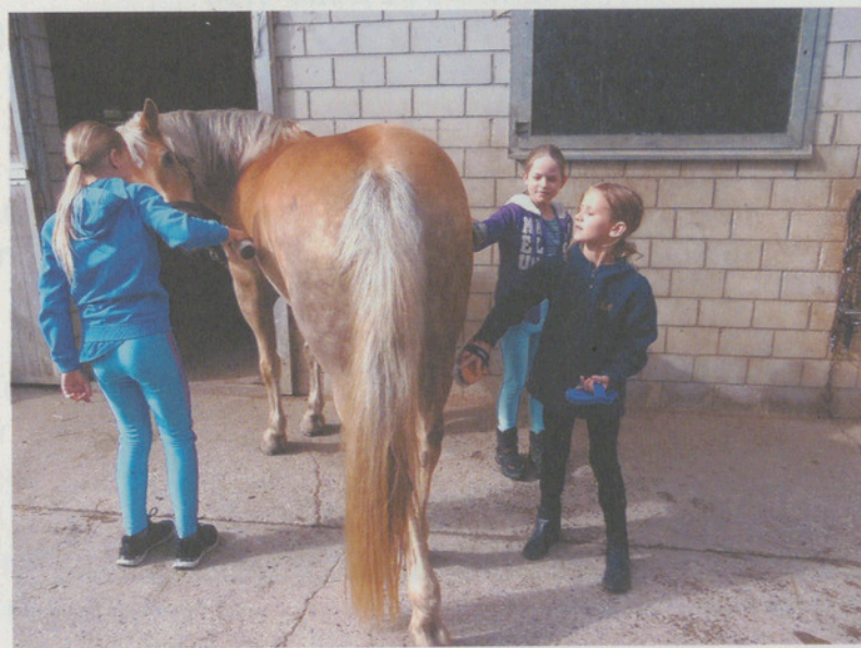
Ein Voltige-Training ist auf jeden Fall sehr abwechslungsreich.