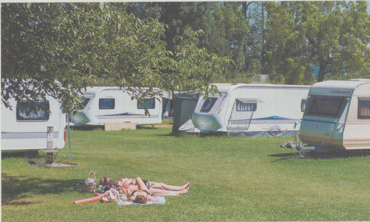
Gemütlich in der Sonne fläzen auf dem Campingplatz im Grünen, direkt am See... was will man mehr?