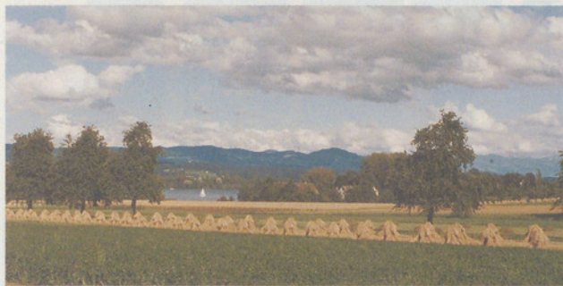
Ansicht von Maur.