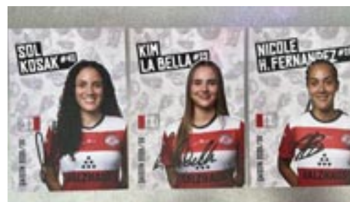
Die drei Spielerinnen gewährten spannende Einblicke in den Frauenfussball.

Ein besonderer Höhepunkt des Festes war das abwechslungsreiche Rahmenprogramm. Die Feierlichkeiten begannen mit einem Familien-Fussballturnier, das mit viel Begeisterung und Einsatz über die Bühne ging. Auch für die jüngeren Besucherinnen und Besucher war gesorgt – sie konnten sich etwa beim Schussgeschwindigkeitsmessen oder beim Fussball-Dart versuchen.