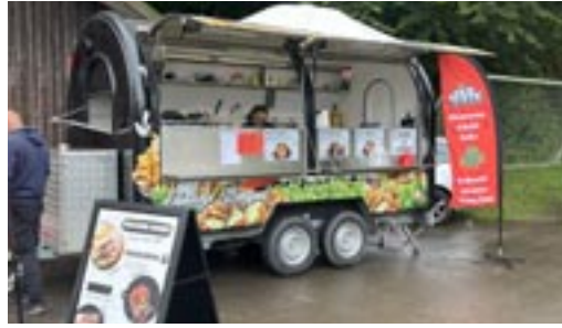
Essen, was das Herz begehrt....

Stimmung sorgten zwei DJs, die das Publikum bis spät in die Nacht in Bewegung hielten.