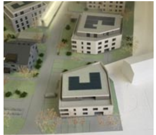
Ausschnitt aus dem Modell der Überbauung Coll d'or mit unseren beiden Häusern A1 und K1 und unserem Altbau, Poststrasse 16, Winterberg

Die Baukommission der Genossenschaft für Alterswohnungen steckt, zusammen mit den Planern des Architekturbüros hlp Architekten, Effretikon, und den Bauführern der ADT Innova AG, Altendorf (SZ), mitten in den Planungs- und Realisierungsarbeiten der beiden neuen Häuser, in denen zusammen 28 neue 2 ½- und 3 ½-Zi. Alterswohnungen entstehen. Im kleineren Haus A1, auf dem Platz des früheren Dorfladens, entsteht im Untergeschoss ein neues Restaurant Raindli mit angrenzendem Mehrzweckraum. Das alte Raindli bleibt in Betrieb, bis das neue Raindli eröffnet ist und macht dann dem neuen Dorfladen Platz, dessen Bau in der zweiten Hälfte 2027 geplant ist.