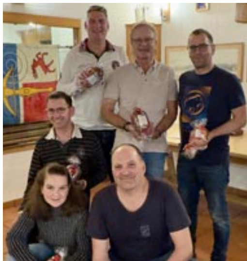
Die aktiven Schützen von der letzten Saison