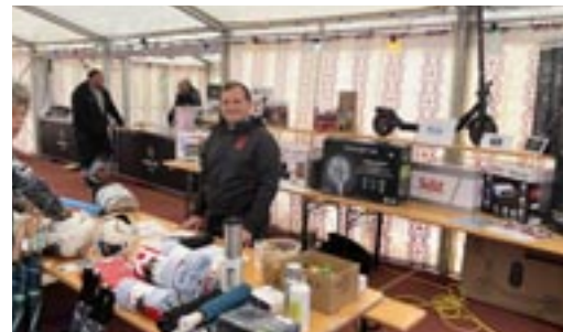
Die reich bestückte Tombola liess so manchen glücklichen Gewinner nach Hause gehen.

Eine grosse Tombola durfte nicht fehlen und die glücklichen Gewinnerinnen und Gewinner durften ihre Preise am späteren Nachmittag entgegennehmen.