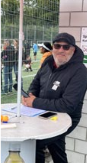
Eine gute Organisation ist das A und O.