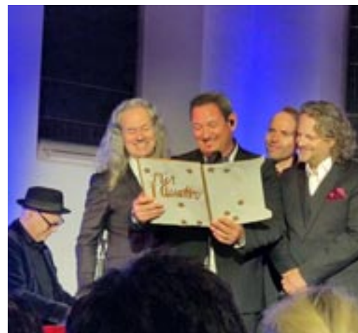
Post vom Samichlaus...

Bereits zum zweiten Mal durften wir die vier stimmgewaltigen Männer bei uns zu Gast haben und wieder strömten unzählige Zuschauerinnen und Zuschauer in die Ref. Kirche Lindau. In kurzer Zeit füllten sich Bänke und Stühle bis auf den letzten Platz. Punkt 18 Uhr erklangen dann auch die ersten, sehnsüchtig erwarteten Töne der vier Tenöre «I Quattro».