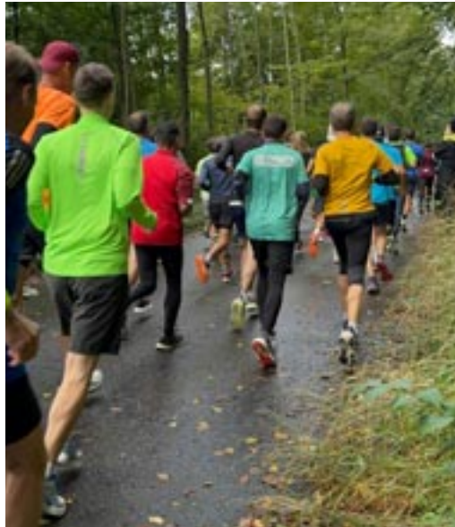
Voller Einsatz, trotz kühler Temperaturen

Die klassische Hauptkategorie, die sogenannte Zwölfer-Stafette, führte auf dem Rundweg Winterthur über rund 83,4 Kilometer mit etwa 1'511 Höhenmetern. Die zwölf Etappen waren unterschiedlich lang, zwischen 3 und 11,9 Kilometern und boten sowohl flache Passagen als auch anspruchsvolle Anstiege. Ergänzend dazu gab es Zweier-, Vierer- und Fünfer-Teams, die sich die Strecke aufteilten, sowie die Mini-Winti-SOLA für Kinder und Familien mit kurzen Distanzen zwischen 130 und 1'200 Metern.