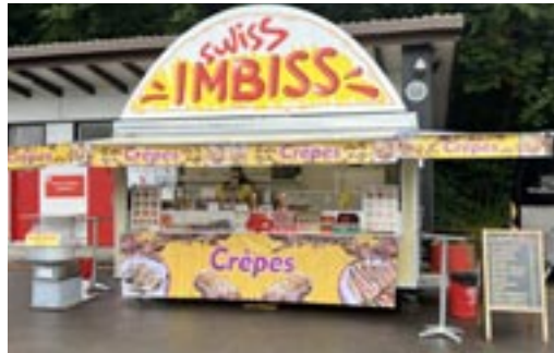
Auch das leibliche Wohl kam nicht zu kurz.

Stimmung sorgten zwei DJs, die das Publikum bis spät in die Nacht in Bewegung hielten.