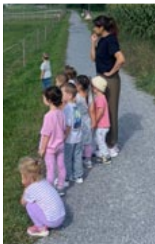
Es gibt immer viel Spannendes zu entdecken.