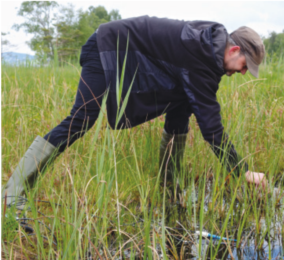
Abb. 3: Der Autor bei den Messungen und der Probennahme im Robenhauser Riet.

Um auf Messikommers Spuren einen Einblick in die Kieselalgendiversität zu erhalten, habe ich Ende Mai 2015 in vier Moorschlenken im Robenhauser Riet diverse Proben gesammelt. Die Standorte habe ich so gewählt, dass sie in der Nähe von Stellen lagen, die schon Messikommer untersucht und erwähnt hatte. Kieselalgen können auf unterschiedlichen Unterlagen (Substraten) leben.