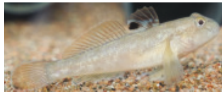
Abb. 9: Schwarzmundgrundel mit schwarzem Augenfleck auf der Rückenflosse

Die Vorabklärungen zeigten, dass die Nutzergruppen, die ein Risiko für den Eintrag von fremden Arten darstellen, stark mit dem Pfäffikersee verbunden sind. Die meisten können gut über Vereine oder Behörden informiert werden. Zu den wichtigsten Nutzergruppen am Pfäffikersee gehören Fischer und Bootsbesitzer. Ein geringeres Risiko geht von Kanufahrern, Tauchern und Aquarianern aus. Der See wird relativ selten von völlig Unbekannten frequentiert. Es scheint z.B. kaum vorzukommen, dass unbekannte Boote aus anderen Gewässern im Pfäffikersee einwässern. Das ist sicher ein Hauptgrund dafür, dass bisher nur wenige Arten eingeschleppt wurden.