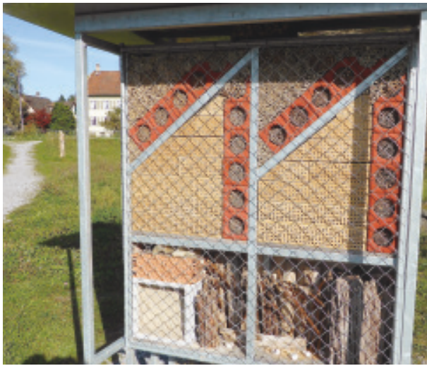
Abb. 16: Das Wildbienenhaus, wie es sich heute präsentiert. Im unteren Teil brüten Wildbienen in Brombeerstängeln und im Altholz.

Die Junihitze ist schon am Vormittag schweisstreibend, aber die Insekten auf der bald verblühten ursprünglichen Ruderalfläche sind genau dann in ihrem Element. Ihre Aktivität steigt mit der Wärme. Direkt um das Wildbienenhaus herum, vor allem aus dem rosa Blütenflor der Esparsetten heraus, ertönt ein stetiges Summen. Bienen! Aber welche? Die meisten Menschen verknüpfen mit diesem Begriff nur die Honigbiene Apis mellifera , die als Haustier gehalten wird und in Mitteleuropa nicht mehr wild vorkommt. Ihre Bedeutung als Honiglieferantin und Blütenbestäuberin ist allgemein bekannt. Dass dieser einen Bienenart schweizweit über 600 Wildbienenarten gegenüberstehen, erstaunt ebenso wie die Tatsache, dass letztere zum Beispiel im Obstbau mindestens so wichtig sind.