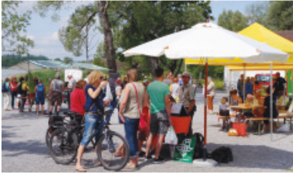
Abb. 22: Viele Besucher sprachen auf die gelungene Standaktion gut an.