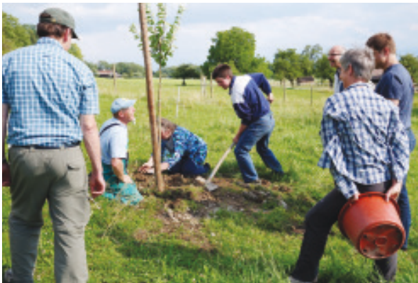
Abb. 15: Als krönender Abschluss und wohl erst für die nächste Generation pflanzen wir ein Bäumchen

Die Pflanzung von drei jungen Hochstamm-Obstbäumen und ein feiner Zvieri in gemütlicher familiärer Atmosphäre runden diesen informativen VPP-Sommeranlass 2015 ab.