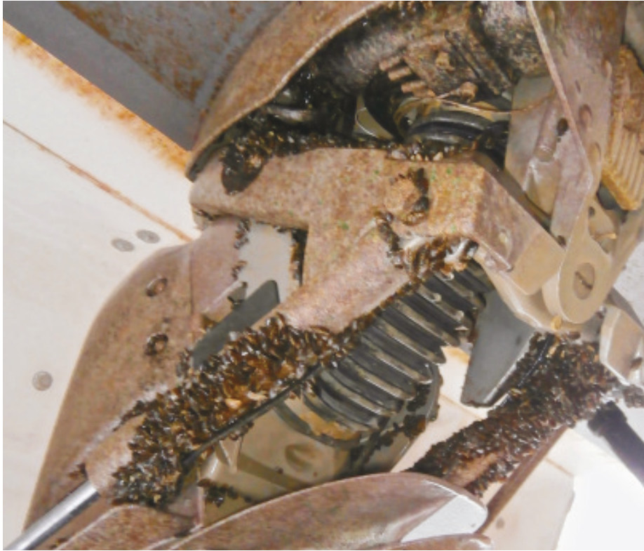
Abb. 7: Zebrauscheln wachsen auch an Bootsmotoren.