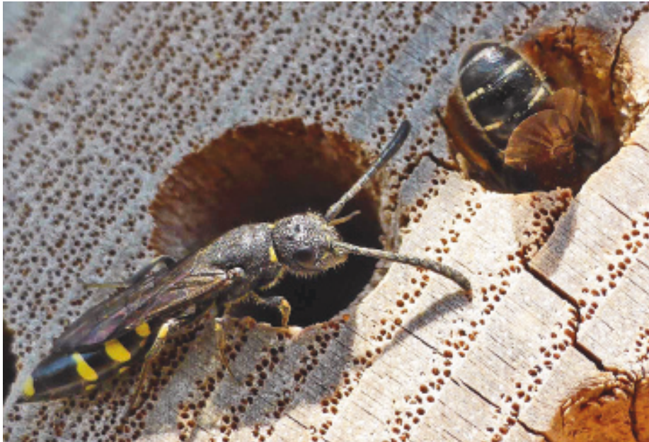
Abb. 20: Keulenhornwespe belauert Hahnenfuss-Scherenbiene.