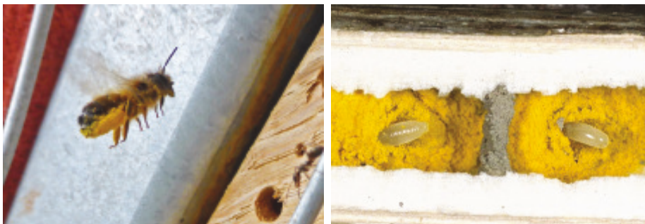
Abb. 18: Linkes Bild: Rostrote Mauerbiene im Anflug. Rechtes Bild: Brutzellen der Rostroten Mauerbiene.

für den zukünftigen Staat, zum Beispiel ein verlassenes Mausloch, einen Unterschlupf in der Kraut- und Moosschicht, einen hohlen Baum oder einen Vogelnistkasten. Die meisten Wildbienen sind jedoch kleiner als die Honigbiene, ja, es gibt richtige Winzlinge darunter, welche kaum einen halben Zentimeter erreichen. Hat man sich ausserdem die Körperform der Honigbiene gut eingepägt, fallen einem die Abweichungen der «anderen Bienen» sofort auf. Deren Hinterleib ist weniger walzenförmig, oft etwas abgeflacht oder verkürzt. Wildbienen können ausserdem sehr bunt gefärbt sein, einige Arten tragen sogar ein wespenähnliches Muster, um Wehrhaftigkeit vorzutäuschen. Sie stechen aber äusserst selten, nur in grosser Bedrängnis, wobei der Stachel der kleineren Arten die menschliche Haut kaum durchdringt.