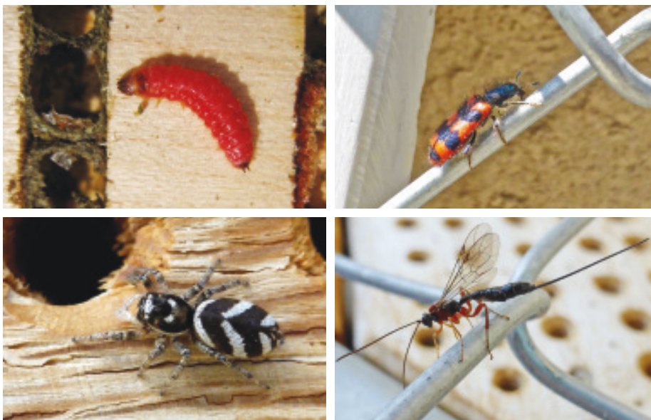
Abb. 21: Im Uhrzeigersinn von links oben: Bienenwolfkäferlarve, Bienenwolfkäfer, Schlupfwespe, Zebraspinne.

Immer wieder landet die lang gestreckte und gelb-schwarz gezeichnete Keulhornwespe an der Steilwand. Sie ist so dreist und wartet direkt hinter der Hahnenfuss-Scherenbiene, bis diese wieder rückwärts aus dem Hohlraum gekommen und davongeflogen ist. Dann heisst es: Schnell ins Loch schlüpfen, Ei auf den Futtermittel legen und abhauen. Die aus dem Ei geschlüpfte Wespenlarve wird zuerst das Bienenei fressen und nachher den Hahnenfuss-Pollenvorrat. Ähnlich geht der Bienenwolfkäfer vor, seine rötlichbraune Larve hat es aber auf die fetten Bienenlarven und -puppen abgesehen. Die Schlupfwespe hingegen treibt ihren dünnen Legestachel geduldig durch eine Brutzellenwand, um dort mit der Präzision eines Zahnbohrers ein Ei genau auf die Wildbienenbrut zu legen.