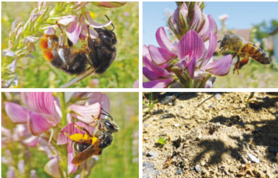
Abb. 19: Im Uhrzeigersinn von links oben: Steinhummel. Hohngigbiene mit Höschen. Bodennest der Sandbiene. Sandbiene Andrena wilkella .

Im Verhalten gibt es ebenfalls markante Unterschiede. Wildbienen leben überwiegend solitär, sie bilden in der Regel keinen Staat. Am Wildbienenhaus sieht man einzelne Weibchen, welche mehrmals das gleiche Loch in der Holzwand anfliegen und von zuhinterst bis vorne eine «Wohnung» nach der anderen einrichten. Jede Zelle wird mit einem Ei belegt und mit einem Pollen/Nektar-Gemisch versehen, welches als Nahrung für die zukünftige Larve ausreichen muss. Es wird im Loch hart gearbeitet und lange gelebt, nur schon deshalb sind die im Internet auftauchenden Ausdrücke wie «Bienenhotel» oder «Insektenhotel» falsch. Die Heimwerkerinnen mauern Wände zwischen den Zellen und verputzen diese sorgfältig. Blattschneiderbienen tapezieren die Wände sogar noch mit Pflanzenblättern. Schliesslich müssen die Larven eine lange Zeit möglichst sicher darin leben, bevor sie sich verpuppen. Den Winter überstehen sie eingesponnen in einer Ruhephase, der sogenannten Diapause. Mauerbienen überwintern als geflügeltes Insekt in der engen Röhre. Im März/April schlüpfen zuerst die dem Ausgang am nächsten wohnenden Männchen, welche den später kommenden Weibchen auflauern, um sich sofort mit ihnen zu paaren.