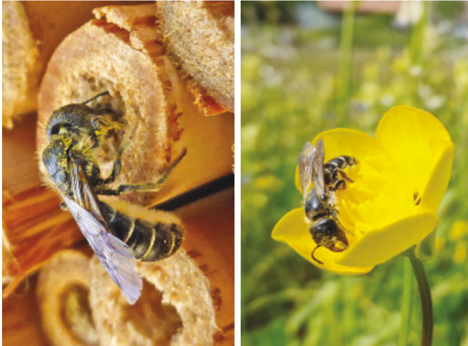
Abb. 17: Linkes Bild: Hahnenfuss-Scherenbiene an der Brutröhre. Rechtes Bild: Hahnenfuss-Scherenbiene auf dem Hahnenfuss

für den zukünftigen Staat, zum Beispiel ein verlassenes Mausloch, einen Unterschlupf in der Kraut- und Moosschicht, einen hohlen Baum oder einen Vogelnistkasten. Die meisten Wildbienen sind jedoch kleiner als die Honigbiene, ja, es gibt richtige Winzlinge darunter, welche kaum einen halben Zentimeter erreichen. Hat man sich ausserdem die Körperform der Honigbiene gut eingepägt, fallen einem die Abweichungen der «anderen Bienen» sofort auf. Deren Hinterleib ist weniger walzenförmig, oft etwas abgeflacht oder verkürzt. Wildbienen können ausserdem sehr bunt gefärbt sein, einige Arten tragen sogar ein wespenähnliches Muster, um Wehrhaftigkeit vorzutäuschen. Sie stechen aber äusserst selten, nur in grosser Bedrängnis, wobei der Stachel der kleineren Arten die menschliche Haut kaum durchdringt.