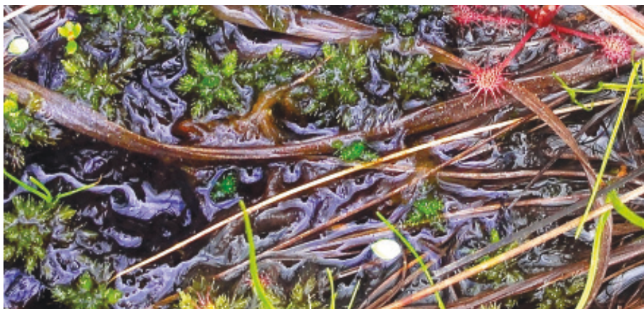
Abb. 4: Oberes Bild: Offenes Wasser einer Moorschlenke, die von Torfmoospolstern umgeben ist.