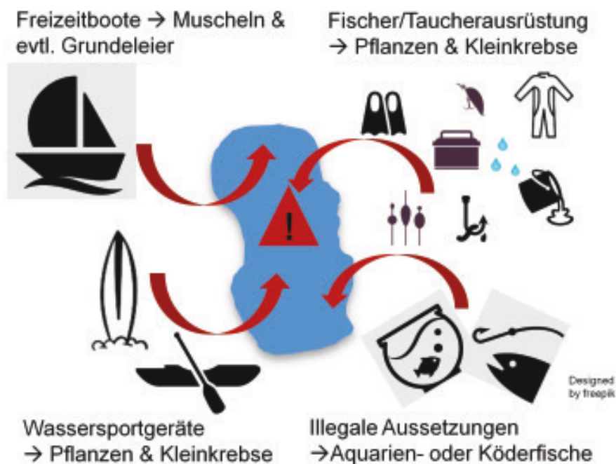
Abb. 10: Verschleppungswege: Boote bergen ein besonders grosses Risiko angewachsene Muscheln und eventuell Grundeleier zu verschleppen. Andere Akteure verschleppen eher Pflanzen(teile) oder Kleinkrebse.

Die Massnahmen werden 2016 bis 2018 umgesetzt, gegebenenfalls angepasst und evaluiert. Sie wurden mit Vertretern der Nutzergruppen abgesprochen. Eine der wichtigsten Massnahmen ist, dass Boote sowie Fischerei- und Taucherausrüstungen, welche kürzlich in anderen Gewässern waren, vor der Einwasserung in den Pfäffikersee, gereinigt werden müssen. Nicht betroffen sind Boote, die das ganze Jahr auf dem Pfäffikersee sind, da sie kein Risiko darstellen. Daneben sollen die lokale Öffentlichkeit für das Thema Neobiota und für die Folgen von illegalen Aussetzungen sensibilisiert werden. 2019 wird Bilanz gezogen und darüber entschieden, ob die Massnahmen weitergeführt werden sollen.