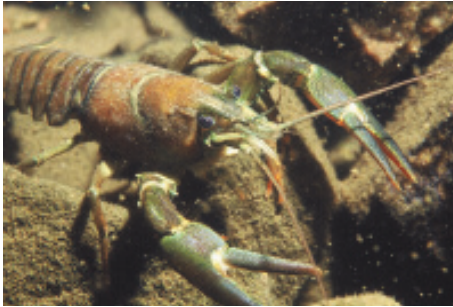
Abb. 8: Der Signalkrebs dezimiert heimische Edelkrebsbestände.