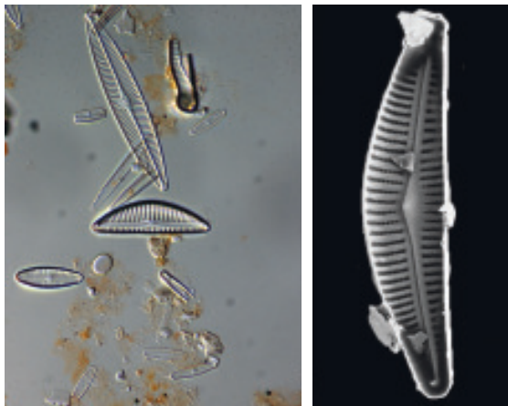
Abb. 2: Linkes Bild: Lichtmikroskopische Aufnahme bei 1000facher Vergrößerung. Sichtbar sind die Kieselalgeschalen, die über das Präparat verteilt sind. Man erkennt deutlich die Längsschlitz (Raphen), denen entlang die lebenden Kieselalgen sich bewegen können. Rechtes Bild: Elektronenmikroskopisches Bild einer Kieselalge bei über 6000facher Vergrößerung; es handelt sich dabei um die Innenansicht einer Schale.

Kieselalgen pflanzen sich in der Regel ungeschlechtlich durch Zellteilung fort; bei ungünstigen Umweltbedingungen können sie sich auch geschlechtlich fortpflanzen. Wie grüne Pflanzen verfügen Kieselalgen über Chlorophyll für die Fotosynthese. Es gibt Arten, die entlang der Längsachse einen schlitzförmigen Durchbruch in der Zellwand aufweisen. Durch diese sogenannte Raphe können die Zellen eine gallertige Substanz aussondern, um sich darauf fortzubewegen.