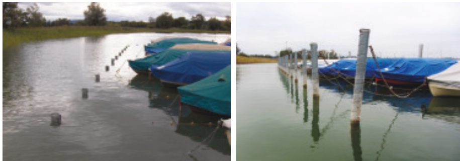
Abb. 1: Linkes Bild: Wasserstand 4.5.15: 537,58 m. Rechtes Bild: Wasserstand am 30.9.15: 536,49 m. Die Pegeldifferenz beträgt also 109 cm.

Wieviel Natur sind die Menschen heute und morgen bereit, der Kulturlandschaft Pfäffikersee zuzugestehen? Um welche zerstückelte und degradierte Natur handelt es sich dabei überhaupt noch? Ist es wirklich alles Kultur, was wir Menschen den Lebensräumen und der Vielfalt anderer einheimischer Geschöpfe opfern? Wie gelingt es uns, gewisse Naturphänomene überhaupt erstmal zu erkennen und danach als Zeichen auch richtig zu interpretieren? Was bedeutet es beispielsweise, dass die Eawag in einer internationalen Weltstudie kürzlich feststellte, dass die Seen der Erde sich in 10 Jahren um 0,34 °C erwärmt haben? Müssen wir also auch im Pfäffikersee mit mehr Algenblüten und zunehmendem Sauerstoffmangel rechnen? Oder mit noch extremeren Wasserstands-Schwankungen und ihren gravierenden ökologischen Folgen?