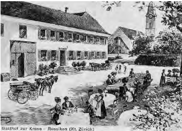
Gasthof zur Krone – Russikon (Kt. Zürich)