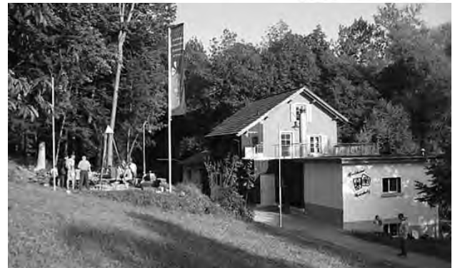
Solafoto vom letzten Jahr