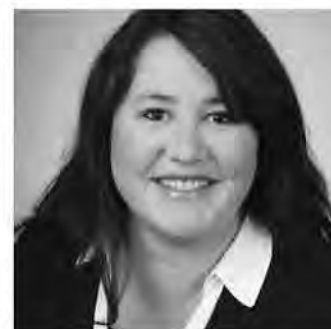
Emina Casparis Schulbehörde