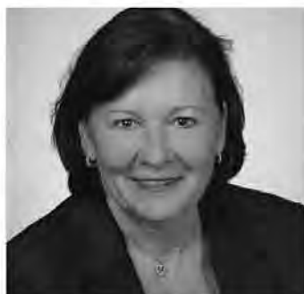
Mäges Berlinger Gemeinderat