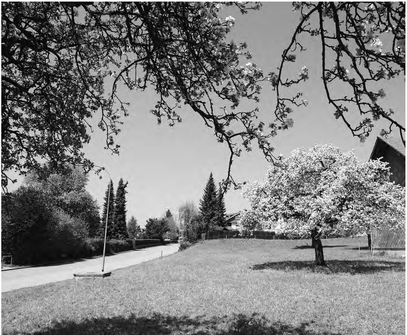
Frühlingserwachen in Russikon

www.mzol.ch oder M. Schönbächler Helbling, Russikon, Telefon 044 995 69 26