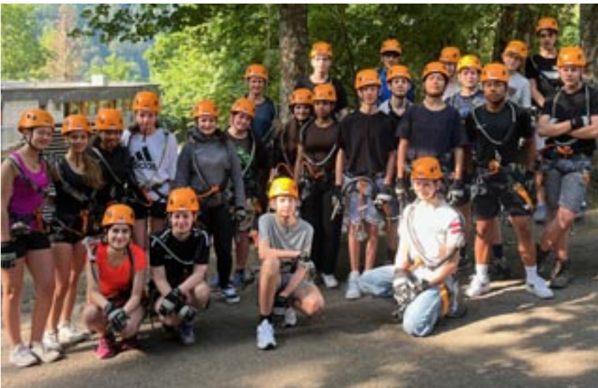
Der Seilpark war für die meisten das Highlight der Woche.