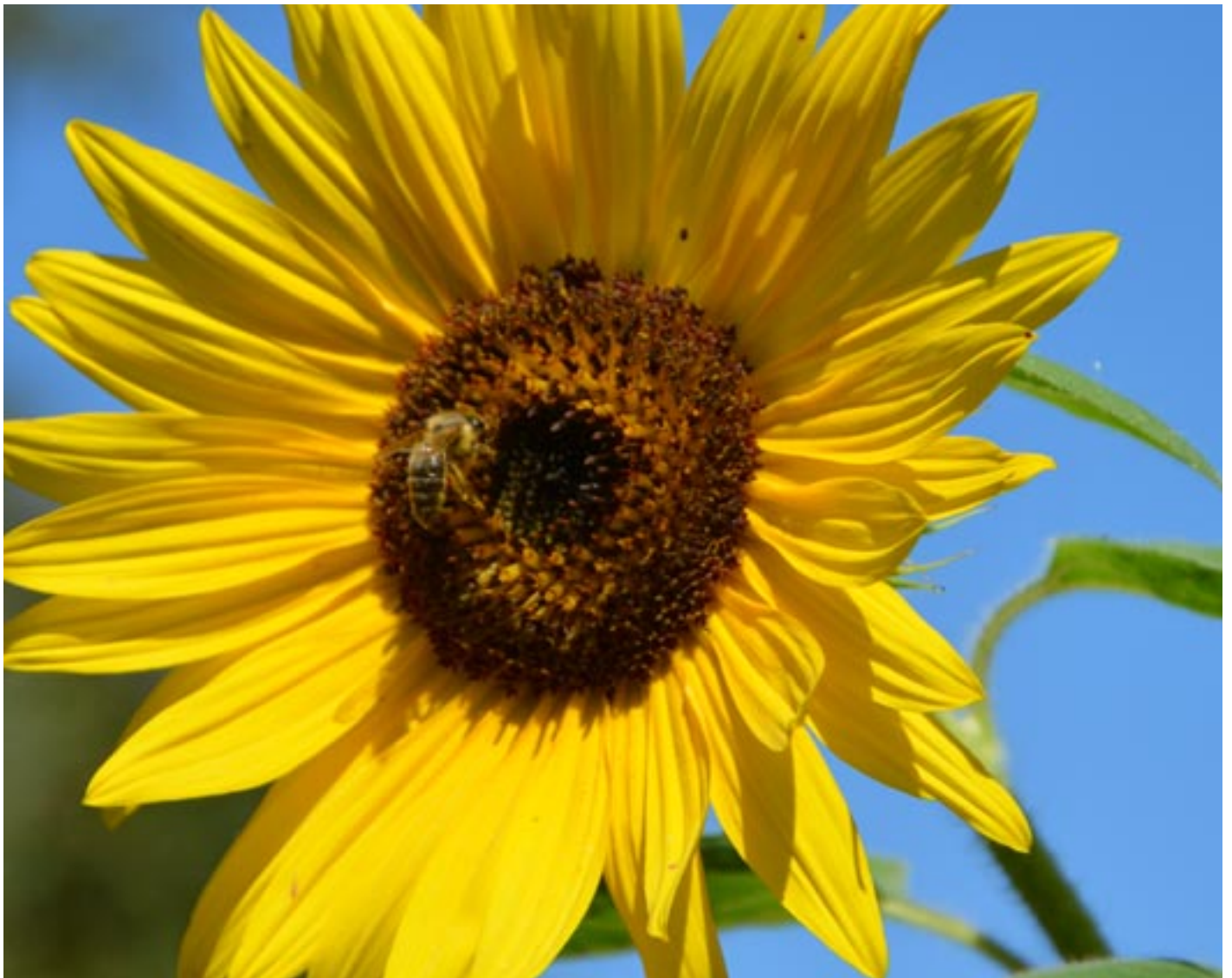
Der Sommer zeigt sich farbig, lebendig und voller Lebensfreude.