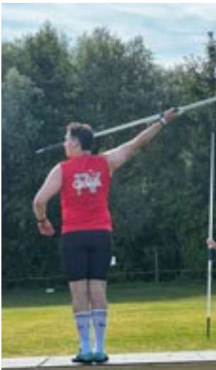
Die Hitze tat den Leistungen keinen Abbruch.