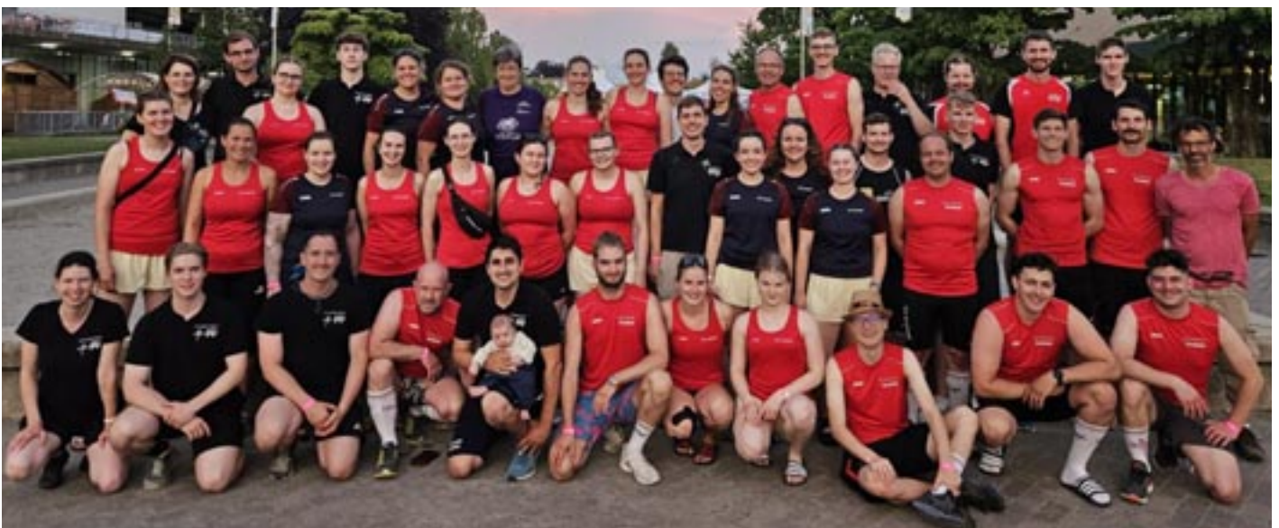
UnserTV Grafstal darf auf ein erfolgreiches Turnerwochenende zurückblicken.

Andere Gröfstler machen eine Pedalotour, wieder andere unterstützen befreundete Vereine bei ihrem Wettkampf.