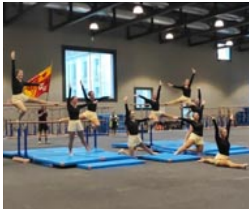
Sie gaben alles und wurden mit einer hohen Punktzahl belohnt.

13 Uhr: Ich treffe mich mit Turnerinnen auf dem «Place de la Navigation».