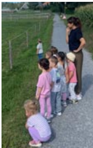
In der Chinderhüeti darf immer wieder viel Spannendes entdeckt werden.