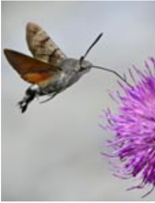
Die Kratzdistel ist bei vielen Insekten beliebt – so auch beim Taubenschwänzchen.