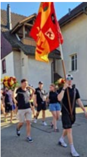
Herzlicher Empfang in Grafstal

9.30 Uhr: Wir suchen den Bus. Anscheinend gibt es