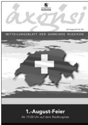
siehe Beilage GVR-Flyer