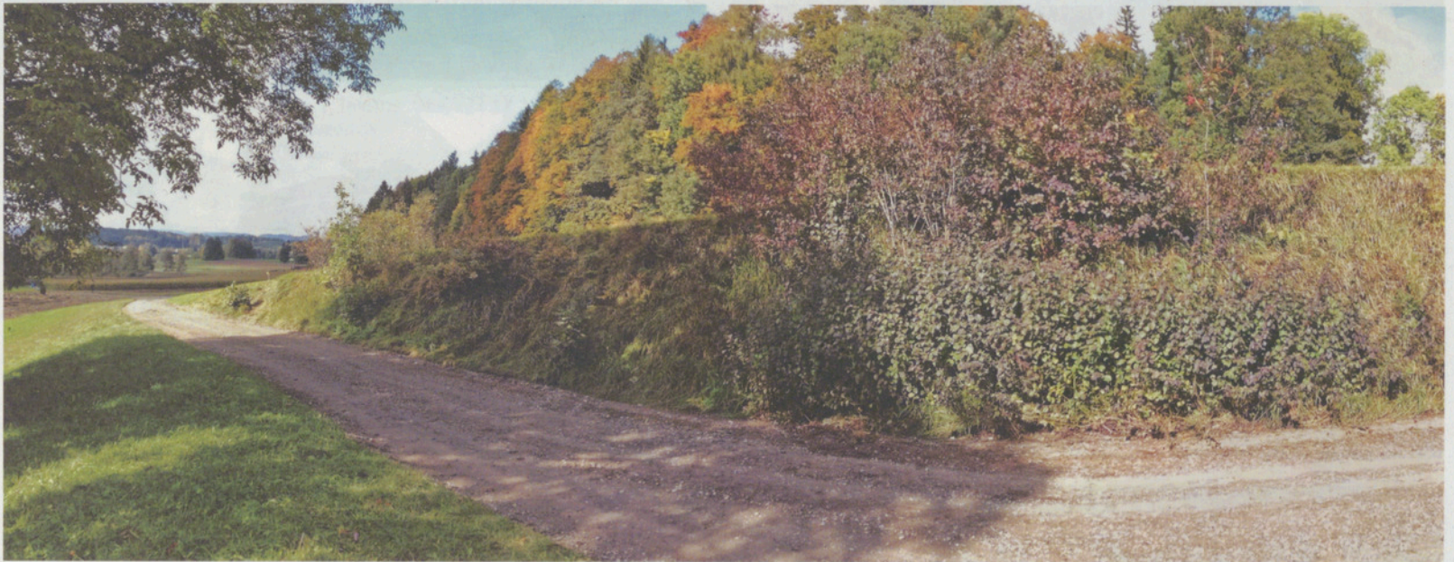
An diese Stelle soll die 50 Meter lange Trockenmauer hinkommen: beim Suessplätz zwischen Ebmatigen und Zumikon.