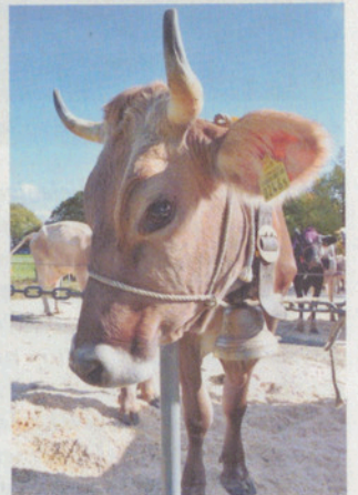
Mini-Puure, dösende Kühe, Einzelexemplare mit Horn und jede Menge Liebe und Leidenschaft zu Tier und Beruf – eine facettenreiche Viehschau.