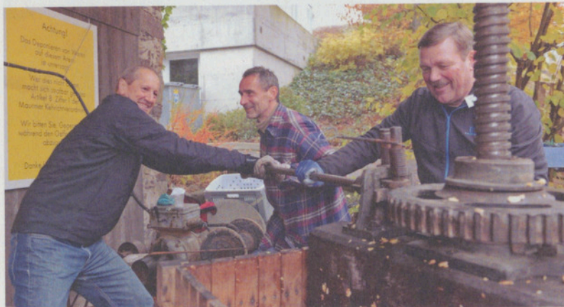
Most frisch ab Presse!