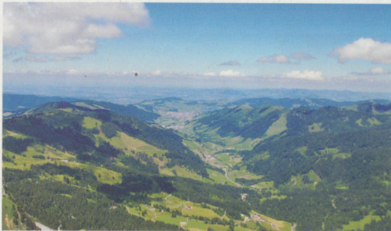
Panorama über das Alpthal bis nach Einsiedeln.