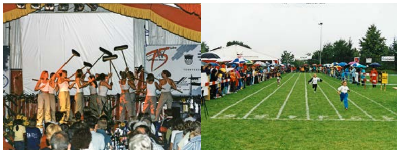
Vorführung der Damenriege am 75-Jahre-Jubiläum und die Sprintmeisterschaft «Die Schnällschte vo Muur».