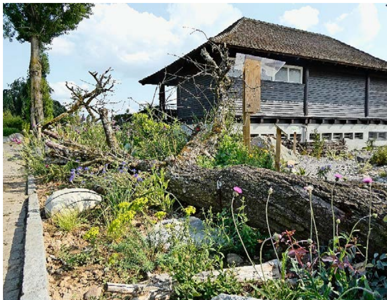
Beim Wildbienenparadies Hörnli in Küsnacht wächst eine Vielfalt von einheimischen Pflanzen und Totholz, Steine und Sand bieten Lebensraum oder Rückzugsmöglichkeiten für Tiere.

Ökologische Vielfalt Mit dem Projekt «Wildbienenparadies Hörnli» hat die Gemeinde Küsnacht den ersten Preis im Gemeindegewinnwettbewerb für ökologisch wertvolle Grünflächen gewonnen.