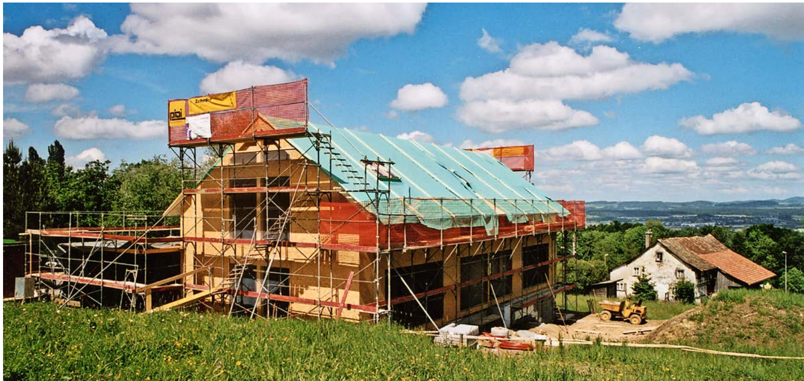
Der Bauzustand am 6. Juni 2002 vom Dorfplatz gesehen. Im Hintergrund der 2006 abgerissene Gassacher-Hof.