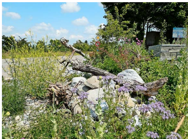
Die Fläche in Aesch, Maur, zeichnet sich durch ihren Struktur- und Pflanzenreichtum aus.