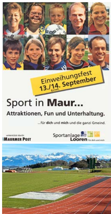
Einweihung des Sportplatzes in der Looren.

Am 13./14. September 2002 dann der grosse Wurf. In der Looren wurde der schönste Sportplatz des Kantons Zürich eingeweiht. Das sagen nicht nur wir, sondern alle Vereine, die bei uns einen Wettkampf bestritten haben. Vorausgehend wurde 1999 der Verein IG Sport aus Mitgliedern des Turnvereins und des Fussballclubs mit dem Ziel gegründet, in der Looren eine polysportive Sportanlage mit einer 400-Meter-Bahn für die Leichtathleten und einem grossen Fussballfeld für den Fussballclub zu erstellen. Vom Turnverein waren Kurt Schenker als Vize und Beat Schweizer dabei.