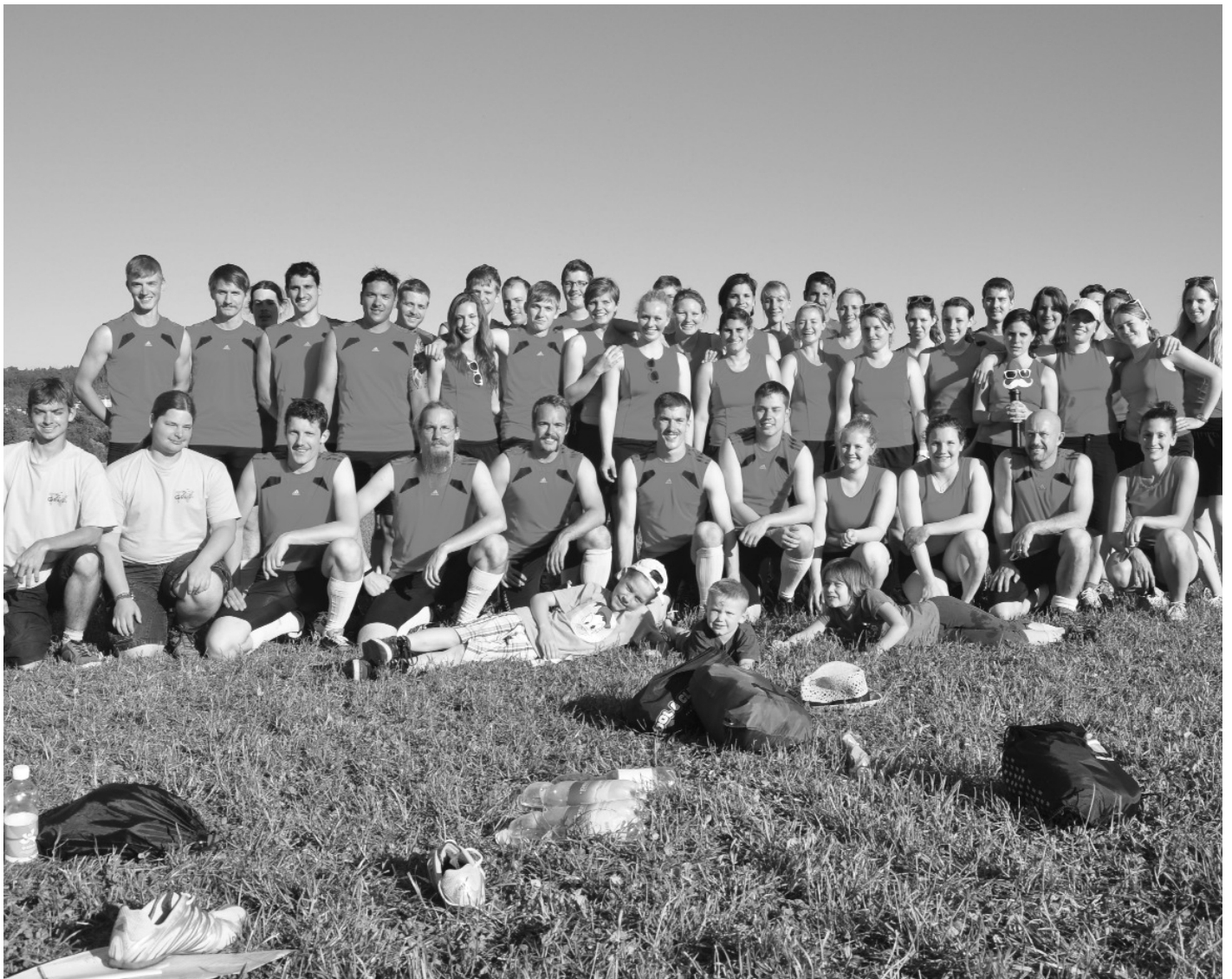
Erfolgreiche Turnerinnen und Turner in Biel