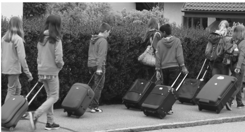
Reisefeeling richtig erleben.

Am Mittwochmorgen herrschte auf dem ganzen Schulareal Marktstimmung. Schüler, Lehrer, Eltern, alle zusammen schafften es, die Welt nach Tagels-