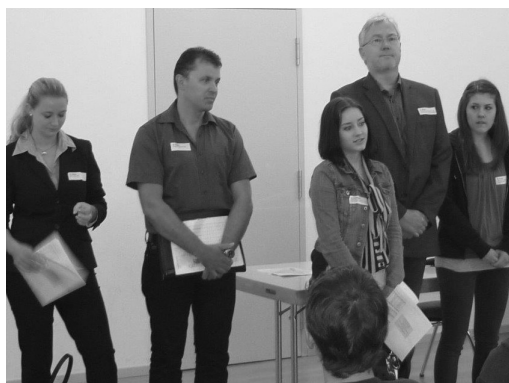
Die Expertinnen und Experten begleiten die Schülerinnen und Schülern.