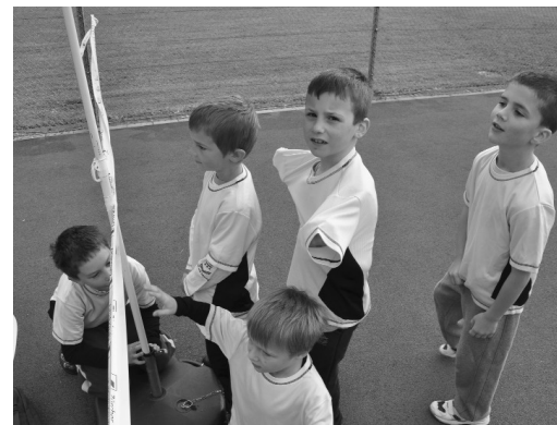
Ein kurze Pause bevor wieder alles gegeben wird.