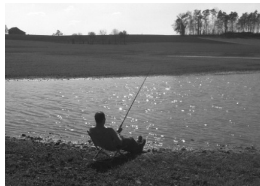
Der Regen hat auch seine guten Seiten: Angeln beim Bläsihof.

Bitte beachten Sie, dass das Sammelgut jeweils bis 7 Uhr am Sammeltag an der üblichen Kehrichtsammelstelle bereitgestellt werden muss.