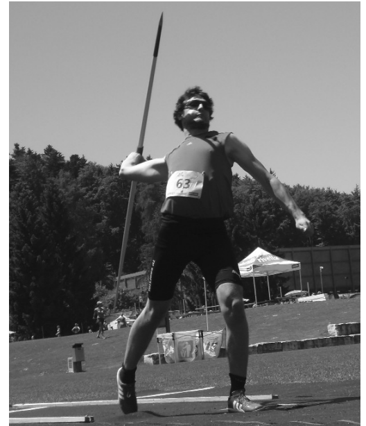
Die Gröfschtler gaben alles.

Das Sahnehäubchen erlebten die Turnvereine Grafstal dann bei der Rückkehr am Sonntagnachmittag. Nach einer rauschenden Fahrt mit Traktor und Anhänger durch die Gemeinde Lindau wurden sie im Vereinsarchiv in Grafstal feierlich von verschiedenen Gemeindevereinen empfangen.