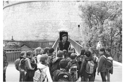
Führung durch Schaffhausen und «Aufstieg» auf den Minot.

Baumstammwerfen messen. Kraft dafür holten sich die Wettkampfteilnehmer mit echter Schweizer Milch, die müden Knochen konnten sie danach an der karibischen Bar baumeln lassen. Und um den Bauch