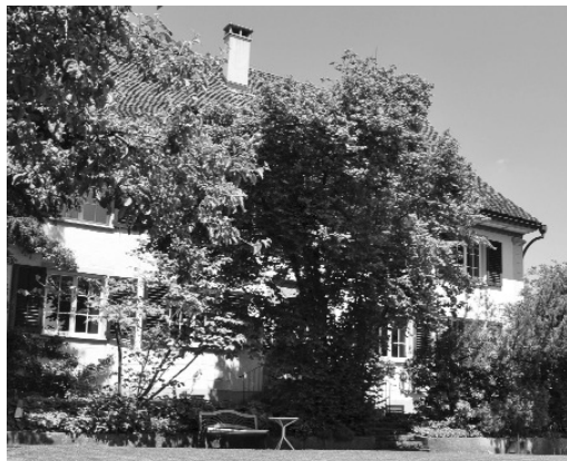
Jedes Jahr ein voller Erfolg: das Gartenfest aller Generationen im Pfarrgarten.

ab 17.30 Uhr im Pfarrgarten und –haus Lindau (17.30 Uhr Apéro / ab 18 Uhr Grillieren und Essen)