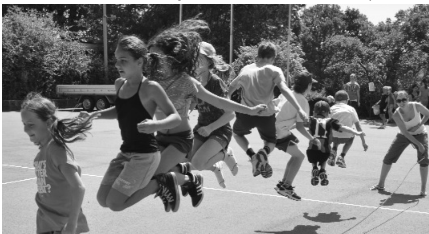
Voller Einsatz auch bei grosser Hitze,

Zum Schluss standen die Halbfinal- und Finalsple im Fussball auf dem Programm. Das Siegerteam sollte zur Krönung des Tages gegen eine Auswahl von Lehrerinnen und Lehrern antreten. So hatte es das Schülerparlament im vergangenen Schuljahr gewünscht. Das Lehrerteam brauchte jedoch noch