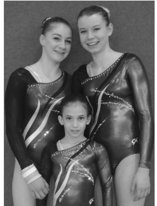
Die drei stolzen Siegerinnen.

Am 8. Juni wurden in Oberbüren SG zum ersten Mal die Verbands- und Schweizermeisterschaft im Akrobatikturken, am Sportfest der Sportunion Schweiz, ausgetragen.