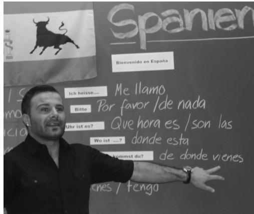
Spanischkurs anstatt deutsch.

In der Woche vom 27. bis 31. Mai, verwandelte sich das Schulhaus Buck in eine bunte, fröhliche Weltkugel. Für einmal wurde nicht über Rechnungen geschwitzt, sondern über dem selbstgestalteten Modell eines topmodernen Las Vegas Hotels. Nicht Aufsätze mussten auf s'Papier gekritzelt werden, denn die ganze Energie galt dem Spanisch-Wortschatz. «Buenas dias, como te llamas?» tönte es da fröhlich aus dem einen Zimmer, während im anderen gerufen wuede: «Fa at vide Danmark!»