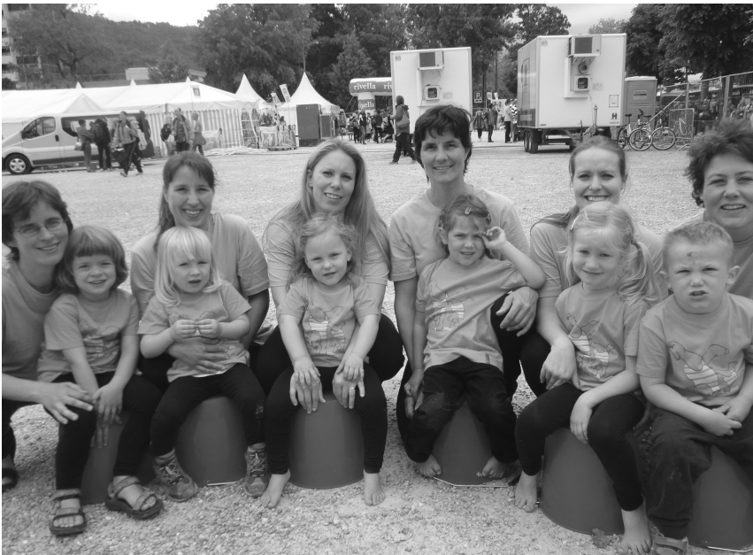
Durften in Biel unvergessliche Momente erleben und werden dieses Wochenende in guter Erinnerung behalten.

über 50 Turnerinnen und Turner in den vergangenen Monaten intensiv auf diesen Grossanlass hin vorbereitet und trainiert. Am ersten Wochenende absolvierten 6 Männer einen 6-Kampf im Einzel, sowie 8 Damen und Herren einen Paar-Wettkampf in der Kategorie Sie und Er.