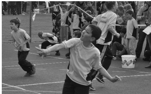
Die Gröfschtler waren mit viel Herzblut dabei.

Die verschiedenen Wetterberichte, welche noch am Abend zuvor und auch am Wettkampftag selbst eifrig aufgerufen wurden, liessen nichts Gutes verheissen. Schauer am Nachmittag hiess es überall. Nichts desto trotz besammelte sich um 7 Uhr in der Früh am Bahnhof Effretikon die Meute und traf rund eine halbe Stunde später auf dem Wettkampflplatz ein.