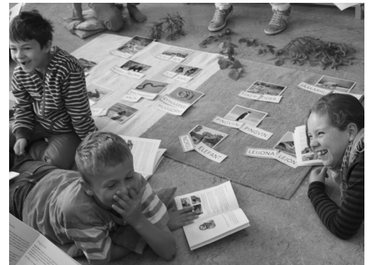
Ein bisschen Spass muss sein.

wangen zu holen. Farbenfrohes Treiben lud Besucherinnen und Besucher ein, die Welt im Kleinen zu erleben. Attraktionen aus 25 Ländern präsentierten sich: Bei den Highlandgames konnte man sich beim