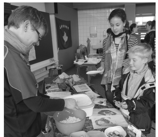
Zubereitung kulinarischer Leckerbissen.