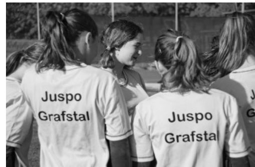
Lagebesprechung vor dem nächsten Einsatz.

Zum Schluss, als die Wolken noch bedrohlicher wirkten als schon den ganzen Tag, fand noch die Pen-