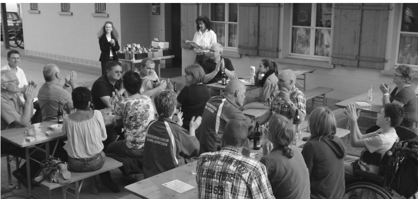
Gemütliches Beisammensein nach den vielen guten Schüssen.