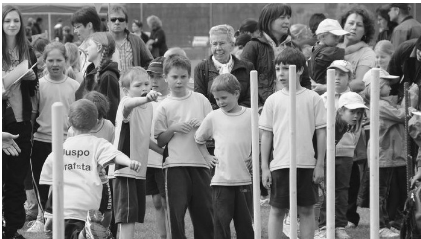
Nochmals volle Konzentration bei der Pendelstafette.

Der Einzelwettkampf wurde nur von einigen verirrten Regentropfen gestört, welche sich nicht an den Zeitplan halten konnten. Nach der Mittagspause, während der sich sogar kurz die Sonne blicken liess, ging es mit den Spielen weiter. Die Teams Grafstal 1-13 waren schnell aufgestellt und spielten je nach Alterskategorie entweder Jägerball, Linienball oder Korb-