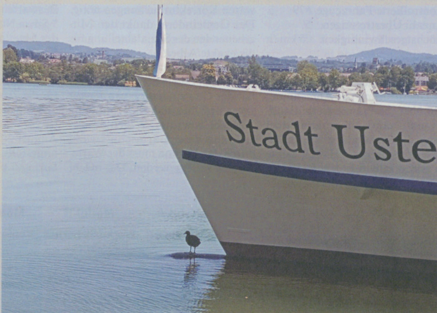
Eine vorwitzige Ente am Hafen Maur ...