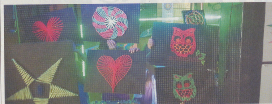
Nägel einschlagen, dann den Faden abwickeln ... in der Gruppe macht die Arbeit doppelt Spass.