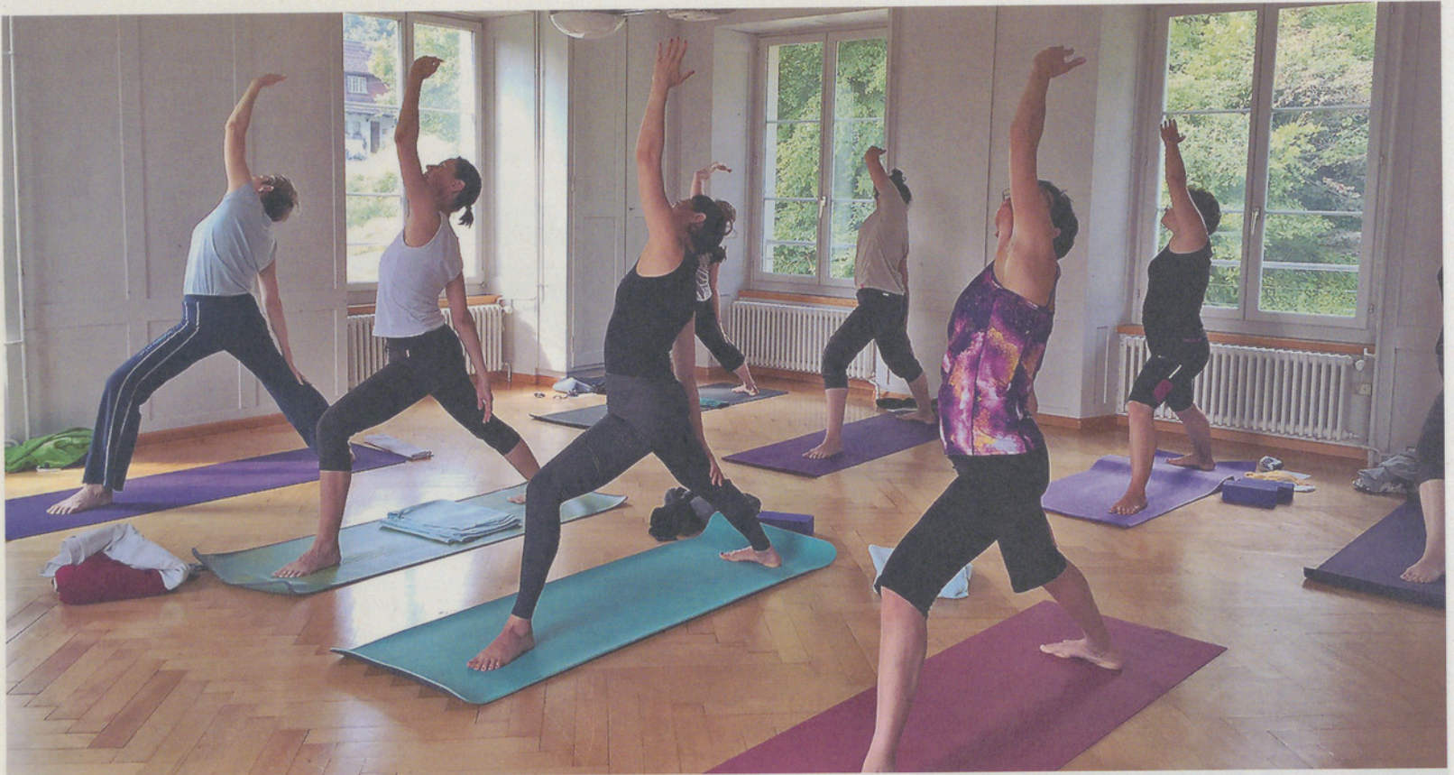
Yoga-Stunden erfordern den Einsatz des ganzen Körpers.