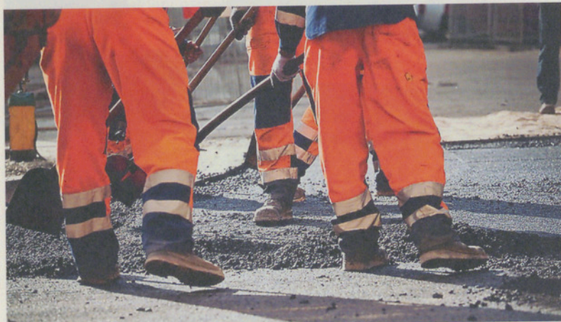
Warum muss der Teer-Belag wieder weg?