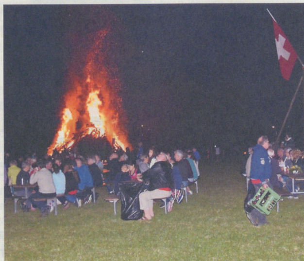
Stimmungsvolle Feiern auf dem Bergerhof (oben) und abends beim Rebhüsli (unten).

ren Freunde (auffällig viele aus dem Ausland) zu einem opulenten Brunch, der jedes Buffet eines 5-Sterne Hotels alt aussehen lässt.