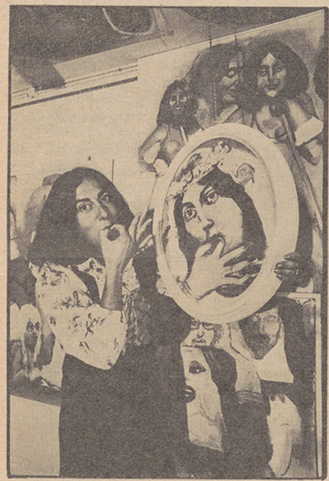
Piff: Ein Aufruf der Frauen.

Am Freitagabend, 24. Oktober, fand in der Höngger Galerie Jamileh Weber eine grosse Vernissage statt. Thema der Ausstellung: « Kapelle der holden Widersprüche ». Der bekannte Schweizer Maler Mario Comensoli schuf ein Ambiente zum Thema der Frau. Um es vorweg zu nehmen — dieses Ereignis ist bestimmt eine der bemerkenswertesten Kunstausstellungen dieses Jahres auf dem Platz Zürich. Das Schweizer Fernsehen hat eine Aufnahme-Equipe delegiert. In der Aktualitätensendung « Un ora per voi », voraussichtlich nächsten, evtl. übernächsten Samstag, wird der Bericht über die Ausstellung ausgestrahlt, und möglicherweise wird auch die Tagesschau das aktuelle Ereignis übermitteln.