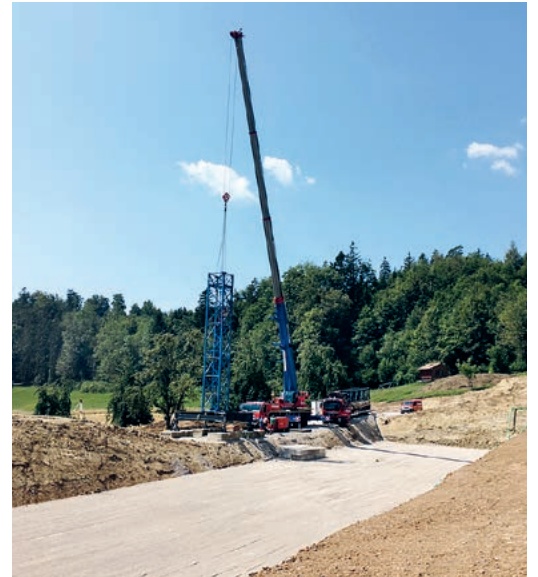
Hier kommt ein Freilaufstall zu stehen.