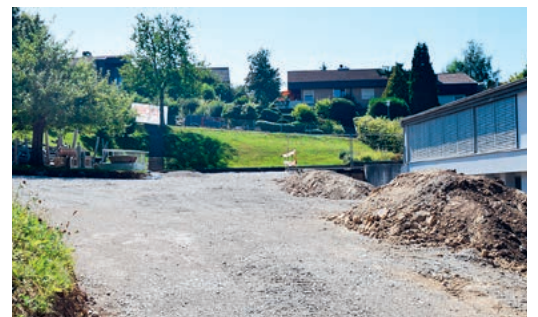
Baustelle beim Schulhaus Aesch.

Auf dem Wassberg wird derzeit gebaut. Eine grosse Baugrube tut sich auf – da, wo vorher Wiese war, mitten in der Landwirtschaftszone und gleich neben dem Betrieb der Familie Bosshard. Auf Anfrage antworten Bosshards, dass sie einen Freilaufstall für Rindvieh bauen würden inklusive Futter- und Güllelager. Der Neubau sei nötig, da bei ihrem aktuellen Anbindestall die gesetzlichen Vorschriften für Milchkühe nur noch knapp erfüllt und die marktüblichen Regelungen gar nicht mehr eingehalten werden könnten.