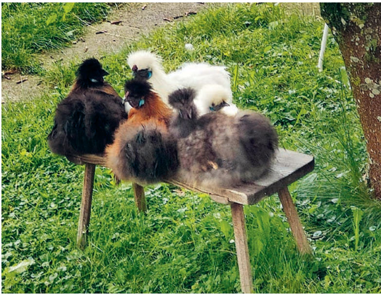
Federvieh im Pfarrhausgarten.