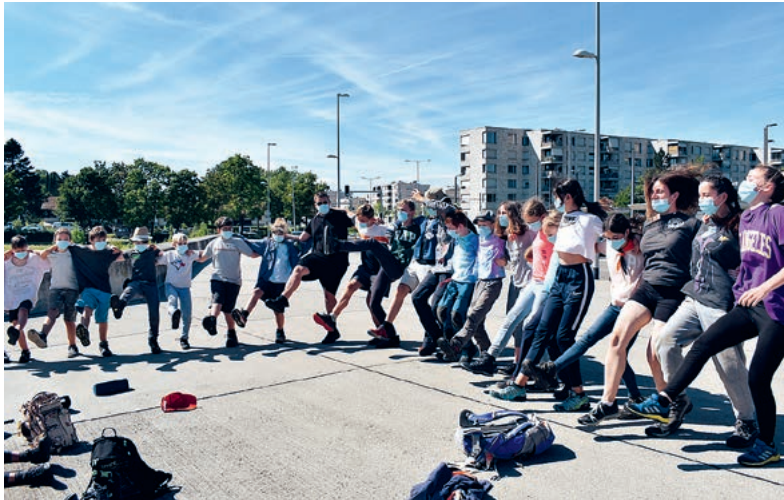
Die Kinder und Leiter der Cevi verbrachten eine Woche im Berner Oberland.

Die Sommerferien haben begonnen und die «Fünf Freunde» Julian, Dick, Anne und George mit ihrem Hund Timmy waren zum Dorffest bei ihrer Tante eingeladen. Doch dieses Jahr gingen sie nicht alleine ins Berner Oberland, sondern nahmen die Kinder und Leiter der Cevi Maur mit. Nach einer langen Reise quer durch die Schweiz kamen wir im verschlafenen «Old Norwich» an. Doch das Dorffest am Sonntag Abend lief nicht wie geplant. Der Dorfsheriff ist plötzlich verschwunden! Schnell merkten die Fünf Freunde, dass hier etwas nicht stimmt. Die Woche verbrachten wir darum nicht nur mit Spielen, sondern mit intensiver Spurensuche und Verhören der Dorfbewohnern. Dabei lehrte uns die Försterin etwas über die Pflanzen und Insekten im Wald oder wir übten uns in Selbstverteidigung, falls wir bösen Leuten begegnen.