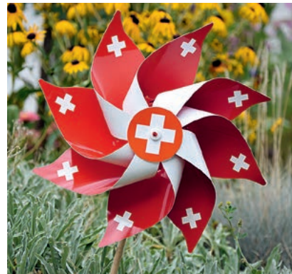
Impressionen vom Nationalfeiertag in Maur.