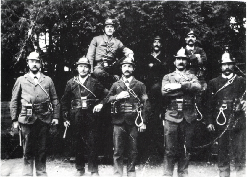
Aufnahme des Rettungs-Corps der Feuerwehr aus dem Jahr 1908.