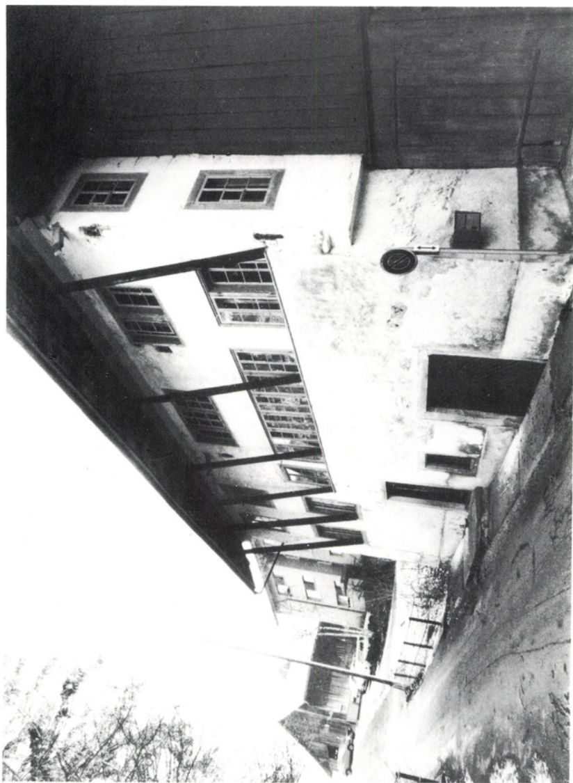
Der Kleintheaterbetrieb in der Mühle Maur soll im kommenden Jahr wieder aufgenommen werden.