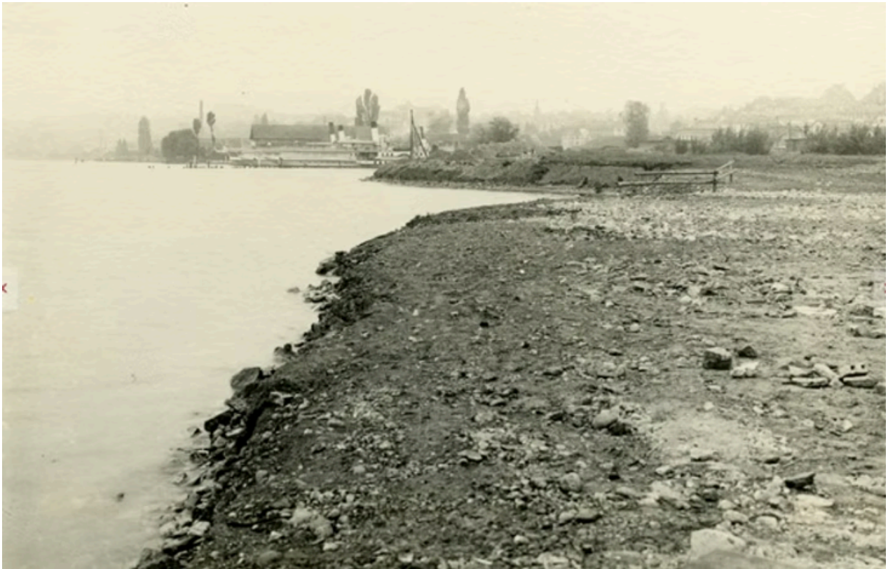
Aufgeschüttetes Land neben der Werft. So dürfte es auch ausgesehen haben, als 40 Jahre zuvor das Land für die Werft dem See abgetrotzt wurde!