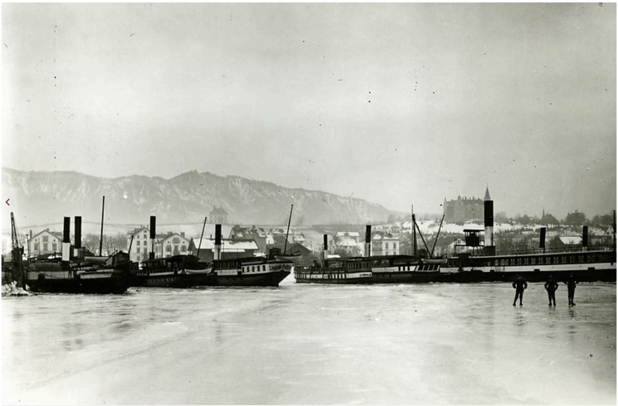
Im Winter 1891 bei der Schiffswerft