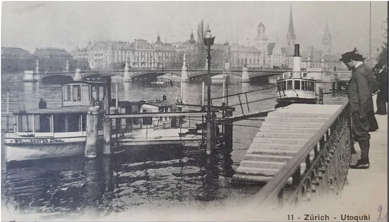
Links im Bild: der Schraubendampfer "Wollishofen", ca. 1900, AK in Privatbesitz

Ab 1891 verkehrte ein Schraubendampfer namens «Wollishofen» auf Limmat und Zürichsee! Dieser war von Escher Wyss gebaut worden und konnte 40 Personen mitnehmen. Es war eines von mehreren baugleichen Schiffen, alle hörten sie auf Ortsnamen: Riesbach, Enge, Rüslikon, Zollikon, Thalwil, Goldbach, Küsnacht und Bendlikon, welche alle 1890 und 1891 von der dann neu gegründeten, Zürcher Dampfboot-Aktien-Gesellschaft (ZDG) in Betrieb genommen und für die oben erwähnten Pendelfahrten in eben diesen Orten eingesetzt worden waren. Anlässlich der Übernahme aller NOB-Schiffe 1902 hat die ZDG die «Wollishofen» – wie auch weitere Schwesterschiffe – verkauft.***