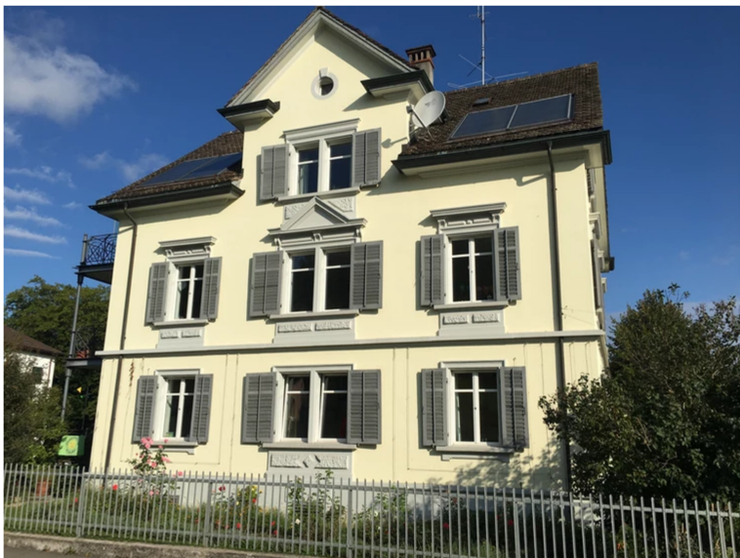
Baumeisterhaus Simmlersteig 18. Erbaut 1895.