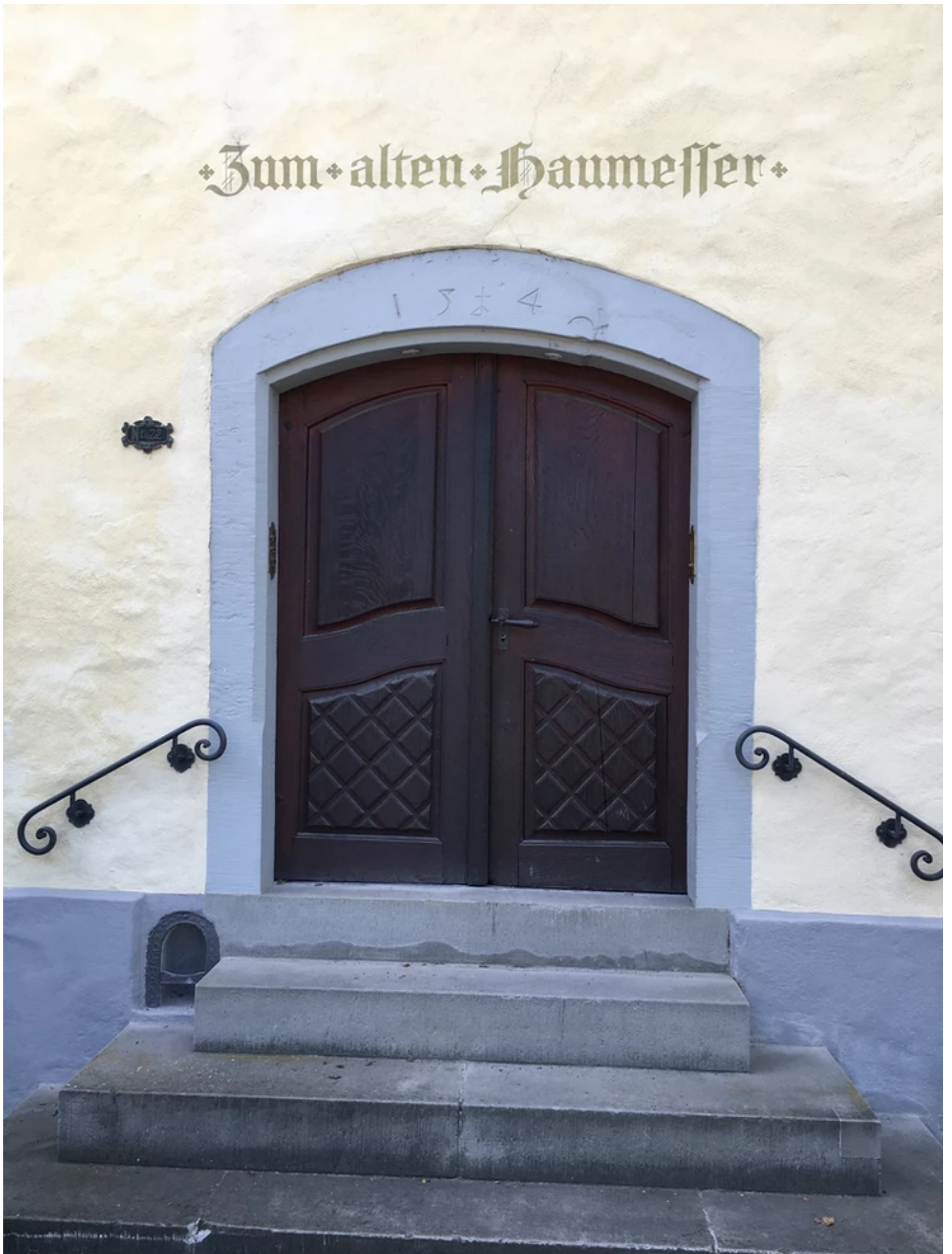
Zum Haumesser, Haumesserstrasse 22. Foto: SB (9.7.2021)