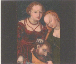
«Judith mit dem Kopf des Holofernes» von Lucas Cranach dem Älteren (1472–1553).

Die Kleider weisen auf die Zeit der deutschen Renaissance im 16. Jahrhundert hin. Gemälde standen damals hoch im Kurs, auch jene von Lucas Cranach, einem Freund Luthers, der dessen Leidenschaft zur Erneuerung der katholischen Kirche teilte. Bilder waren in jener Zeit schwer zugänglich. Die einzige Möglichkeit, farbige Bilder zu vervielfältigen, war, sie von Hand abzumalen. Das war teuer. Mit der Erfindung des Buchdruckes wurde es immerhin möglich, Schrift und Holzschnitte leichter und für viele erschwinglich zu kopieren. Das ist Martin Luther zustatten gekommen. Er beginnt 1521 auf der Wartburg die Bibel aus dem Latein und aus dem Griechisch ins damalige Alltagsdeutsch zu übersetzen. Dabei erfindet er Worte und Redewendungen, die bis heute in Gebrauch sind wie z.B. das «Machtwort» oder der «Lückenbüßer». Zwar waren die ersten gedruckten Bibeln nachko-