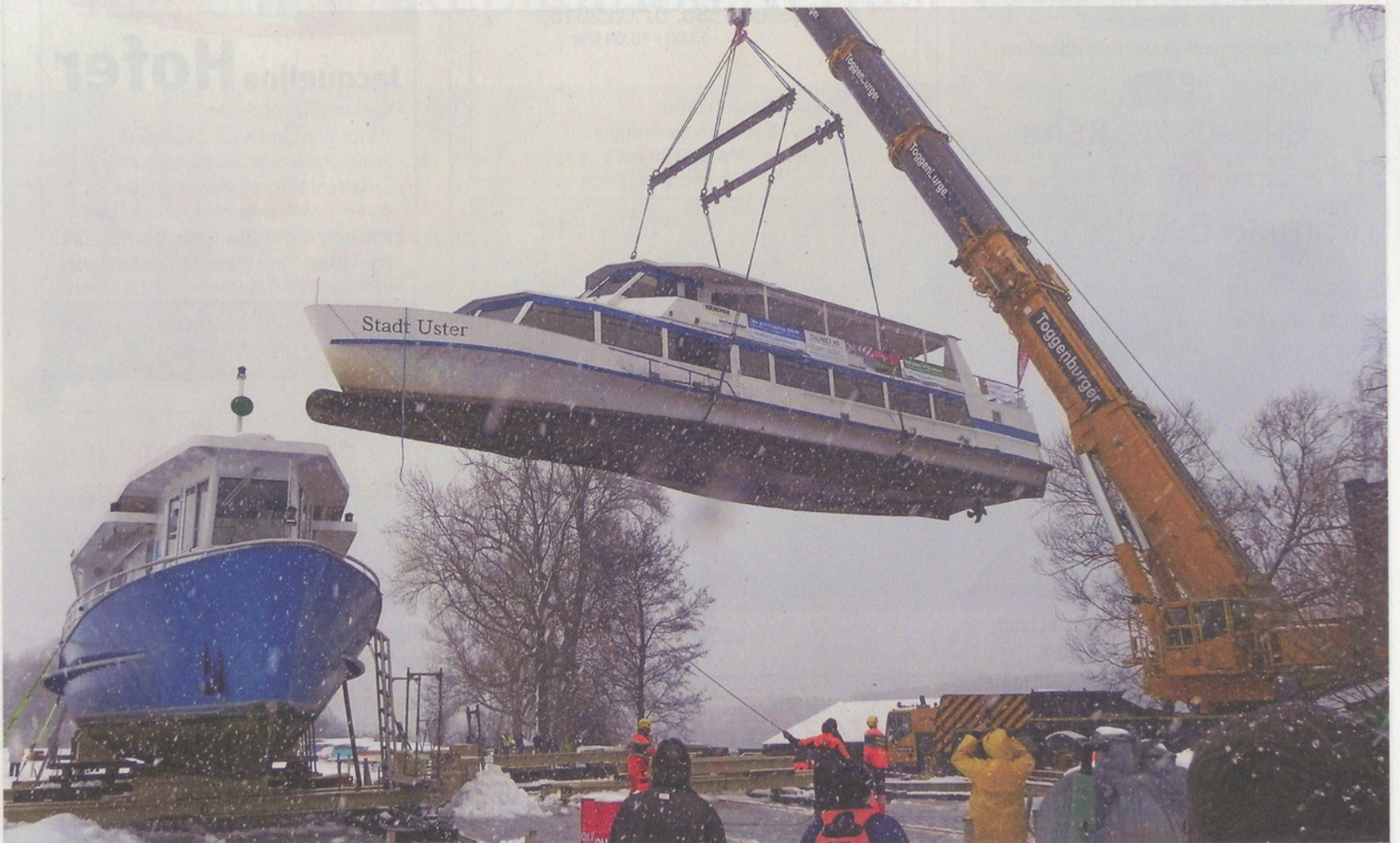
Grosse Logistik-Übung am Greifensee.

Bei eisigen Temperaturen und leichtem Schneetreiben war am letzten Montag in der Schifflände Maur eine Art Volksfest im Gange.