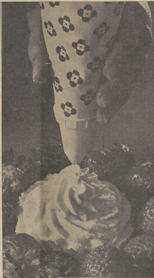
Das erste Geschenk des Sommers: Frische Erdbeeren mit Schlagrahm

Steifgeschlagener Rahm wird zu Torten und Cremen, als Beigabe zu Fruchteukuchen, Ice Cream und frischen Früchten verwendet, er dient zur Verzierung von Puddings, Schokolade- und Kaffeegetränken.