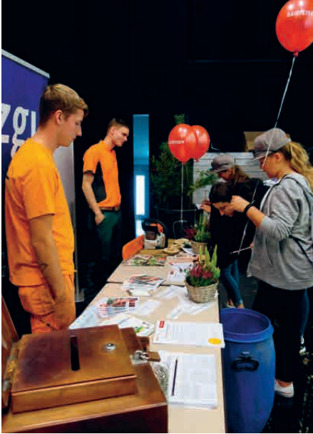
Der Infostand der Gemeinden Andelfingen und Kleinandelfingen war gut besucht

Das Fazit unserer ersten Teilnahme an der Tischmesse fällt sehr positiv aus. Wir erachten es als äusserst wertvoll, die im Weinland angebotenen Lehrstellen und Lehrbetriebe aktiv vorzustellen, den Schülern verschiedene Möglichkeiten einer Berufslehre aufzuzeigen und ihnen hoffentlich so die Wahl einer für sie geeigneten Lehrstelle zu erleichtern.