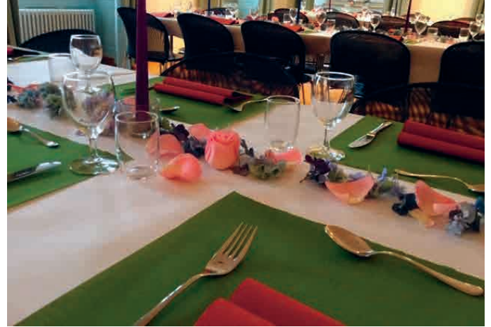
Liebevoll gestaltete Tischdeko