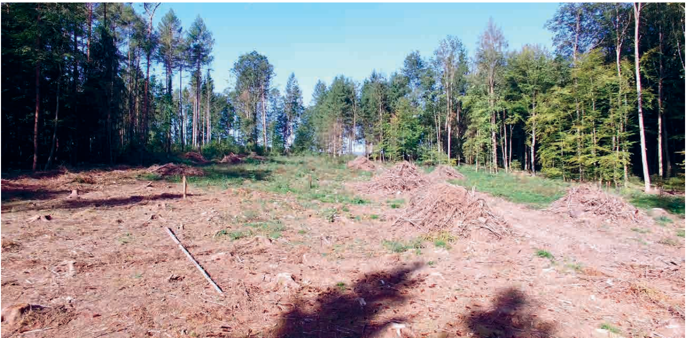
Gerodete Fläche im Oberholz

Von Hand und mit einem Sackmesser schälen wir Rinde von einem der aufeinandergestapelten Stämme. Unzählige, von Borkenkäfern gebohrte Gänge kommen zum Vorschein. Mit diesen Gängen schneidet der Käfer die Nährstoffbahnen des Baumes ab. Und das Tunnelsystem bietet den Larven unter der Borke sicheren Unterschlupf. „Hier brütet bereits die 3. Käfergeneration in