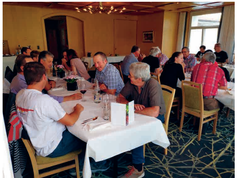
Gemütliches und hervorragendes Mittagessen im Landgasthof Seelust in Egnach