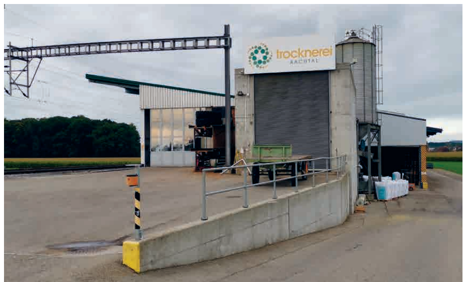
Die Trocknerei Aachtal

Aber erst einmal der Reihe nach: Punkt 7 Uhr trafen wir uns zu einem feinen Zmorgen im "Café Gans gmüetli". Um 8 Uhr war Aufbruchstimmung und wir fuhren mit dem Car in Richtung Landi Aachtal in Oberaach TG. Dort wurden wir freundlich empfangen. Bereichslei-