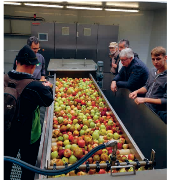
Das Förderband führt die Äpfel direkt in die Mühle