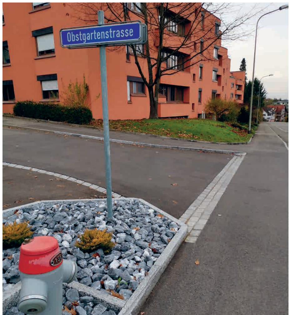
Die Trottoirüberfahrt von der Obstgarten- in die Landstrasse

strasse während der vergangenen Jahre als sogenannte Trottoirüberfahrten gestaltet. Das Ziel war, dass man als Fussgänger von ganz oben im Dorf bis an die Flaacherstrasse hinunter ein durchge-