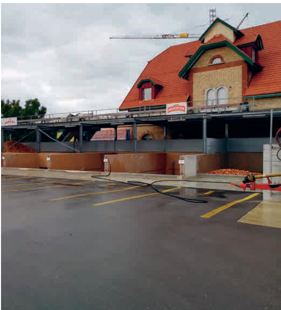
Die Mosterei Ramseier-Aachtal AG mit den teilweise gefüllten Obstsilo