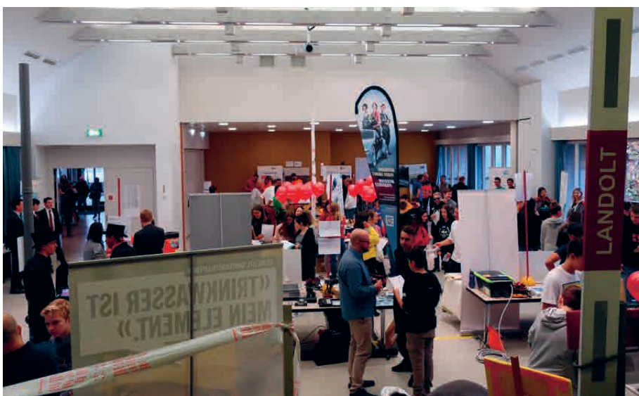
Viele Lehrbetriebe haben sich an der Tischmesse vorgestellt