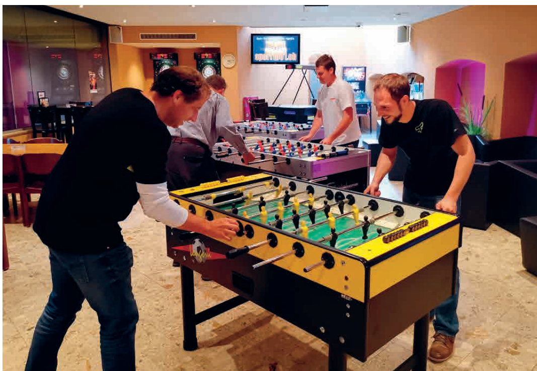
Auch bei den Tschüttelikasten wurden heftige Gefechte ausgetragen