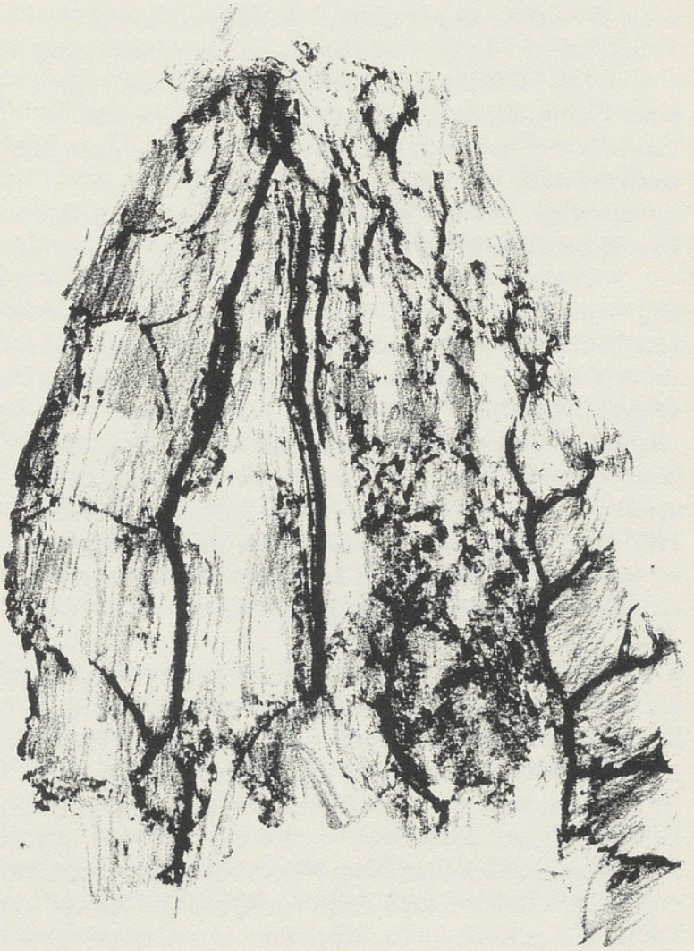
Livre de beurre (steinzeitlicher Silex-Nukleus aus Le Grand-Préssigny)