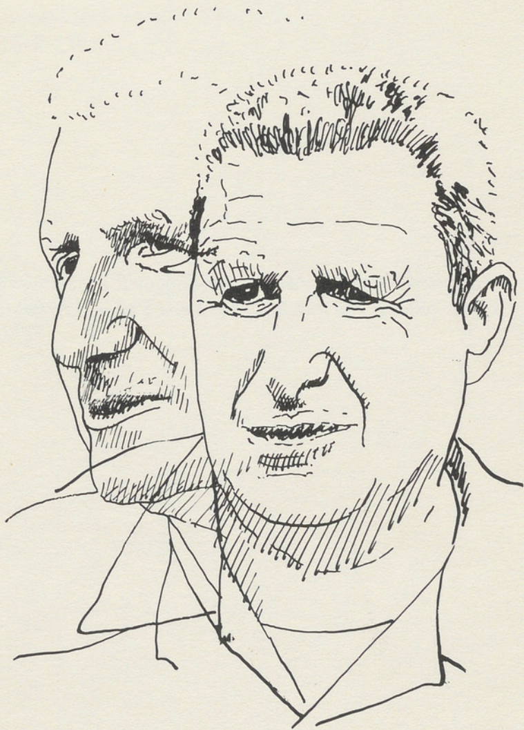
Zeichnung von Gottfried Honegger