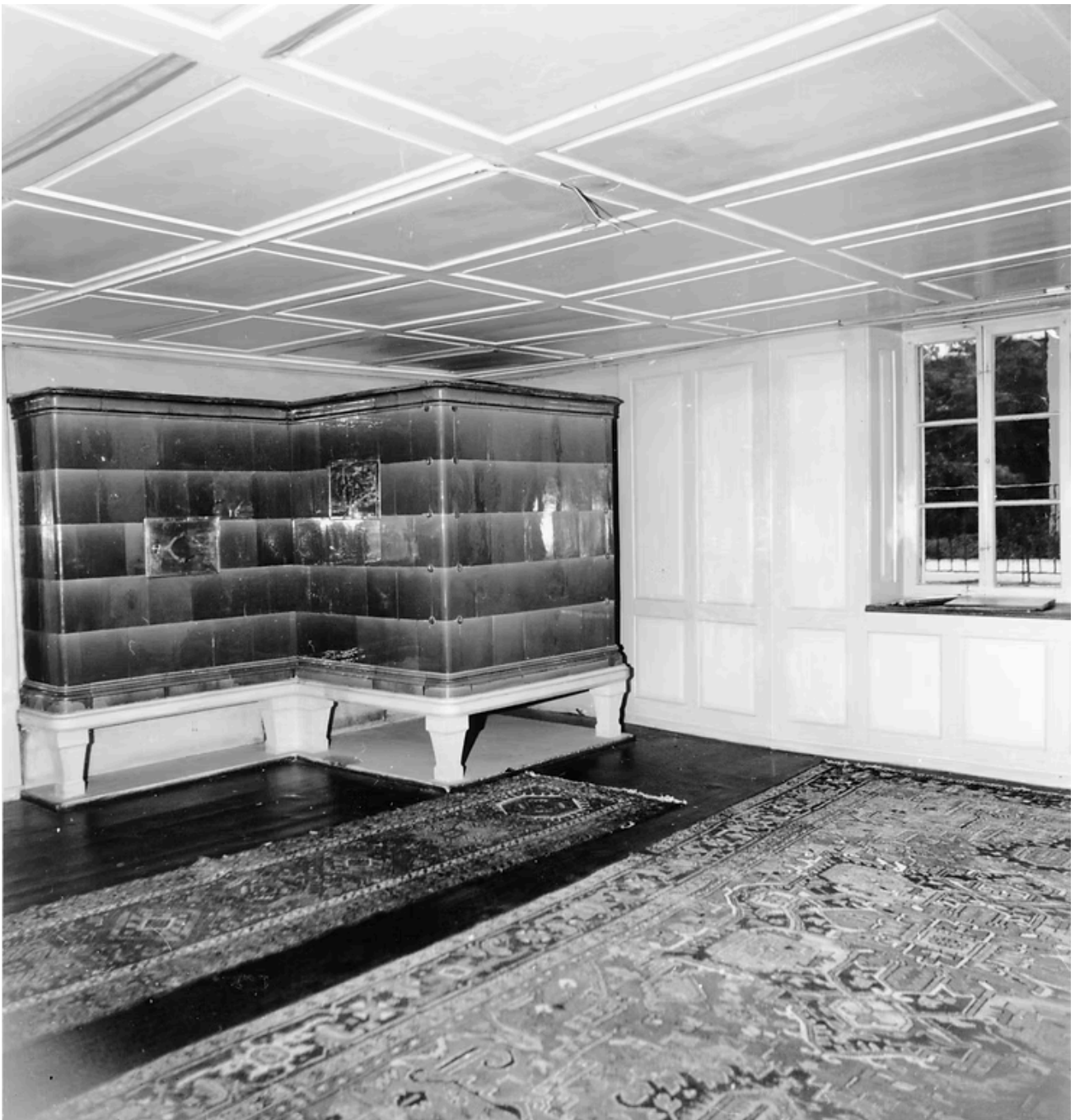
Ein schöner Wollishofer Kachelofen im Erdgeschoss von Haumesserstrasse 19. BAZ.

Und natürlich zwei Kachelöfen im Ortsmuseum, etwa im Salon: