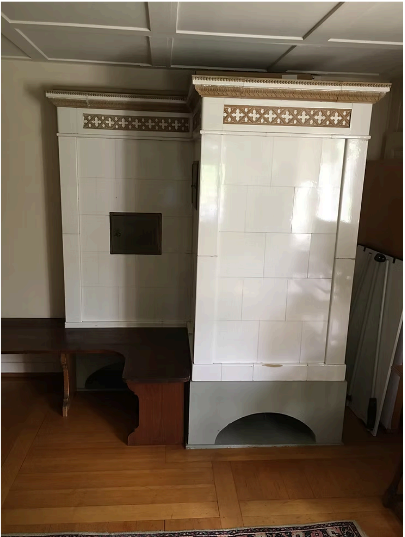
Weisser Ofen an der Widmerstrasse 8, im Salon (Ortsmuseum). Foto SB (2025).

Wachsende Gemeinde, wachsender Bedarf an Brennmaterial