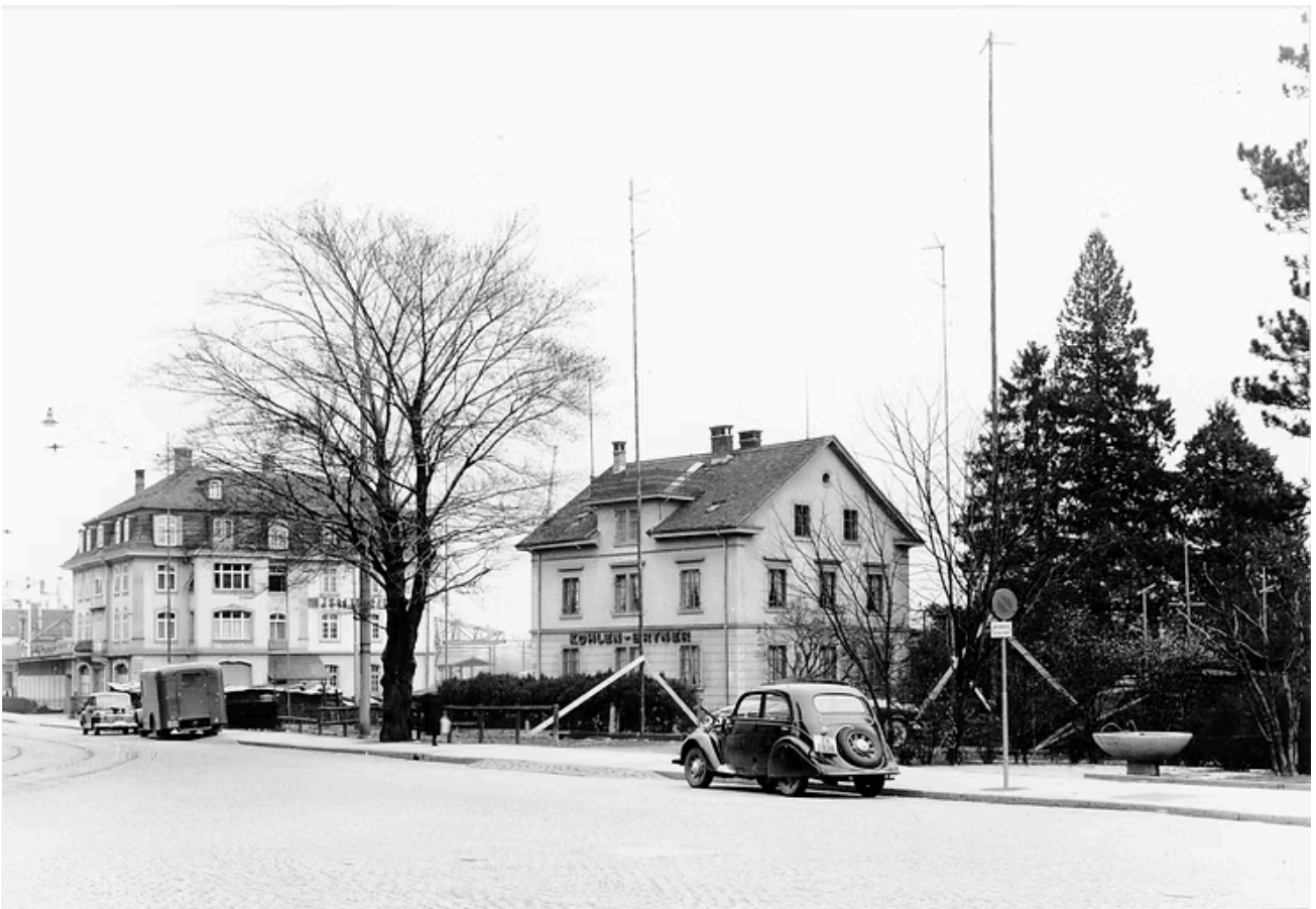
Kohlen-Bryner 1951, vor dem Abriss, Seestrasse 361 neben Eisenhändler Pestalozzi, BAZ.