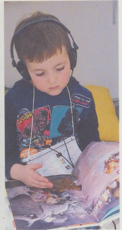
Rechts: In Binz durften die Kinder auch selbst in Büchern stöbern.