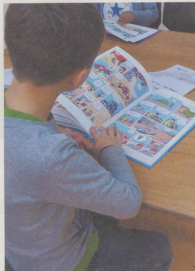
Auch Comics lesen durfte man in Maur.