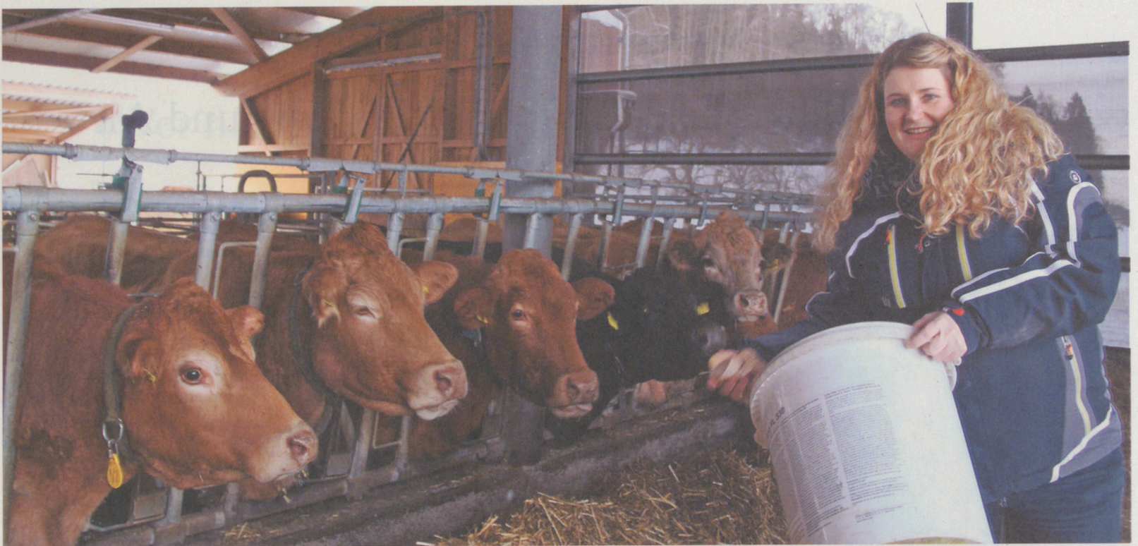
Bei den Kühen im Stall: Susi Müller, die eigentlich aus einer deutschen Optikerfamilie stammt.