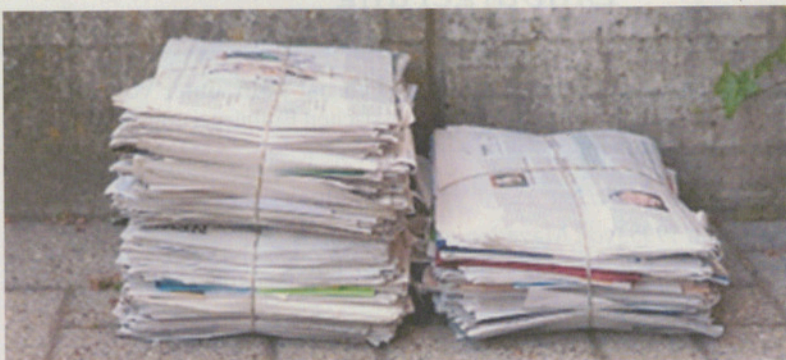
Muss das Bündeln wirklich sein?