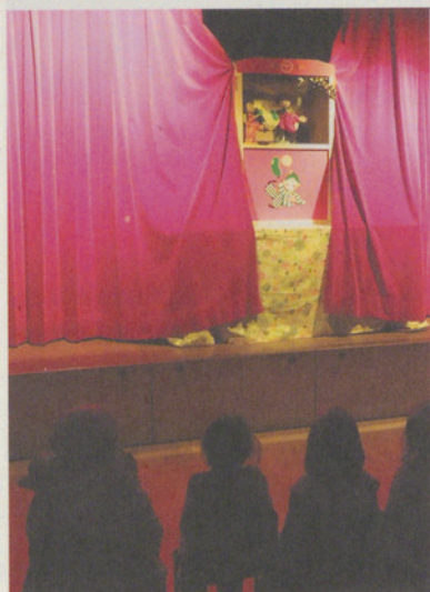
In Ebmatingen war der Kasperli da.