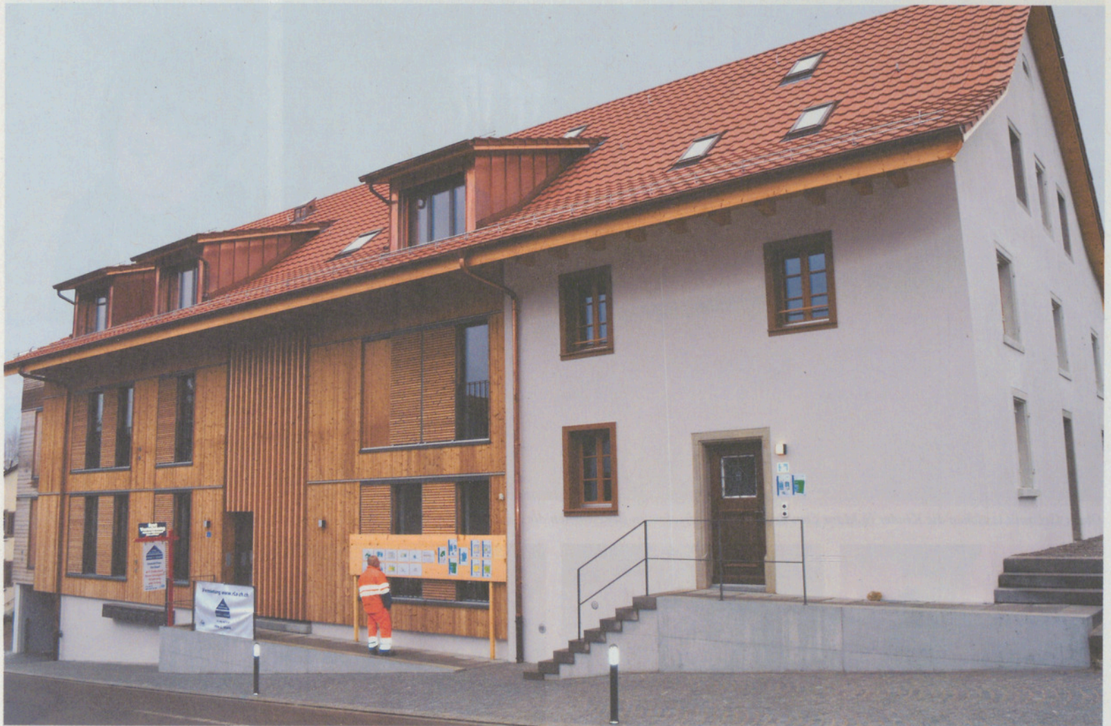
Das «neue Bauernhaus» an der Eggstrasse – inskünftig mit sieben Wohnungen statt der Scheune für Nutztiere und Futter.