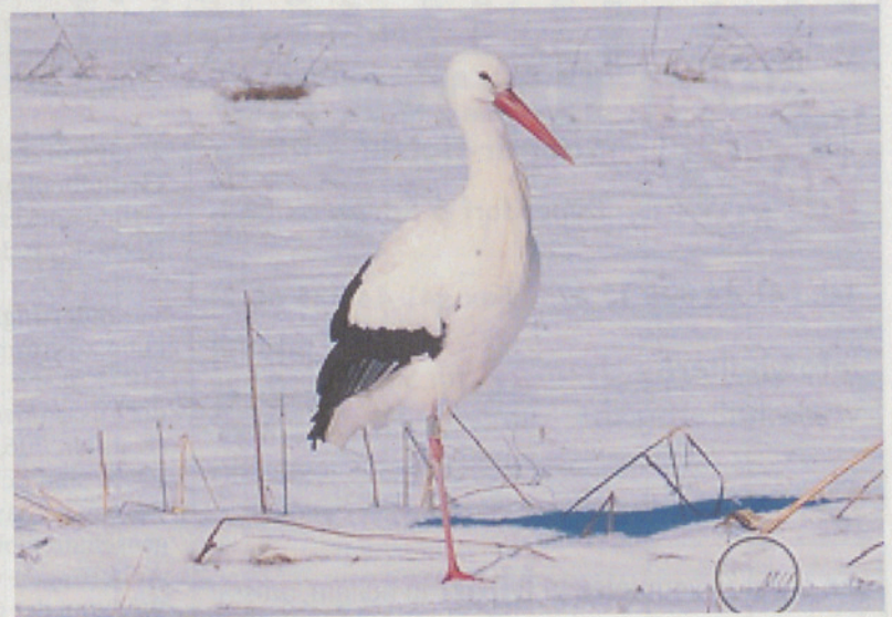
Der Lützelsee mit seinen Mooren ist ein Storchenparadies.

Ausrüstung: Je nach Wetter Iseli und Stöcke