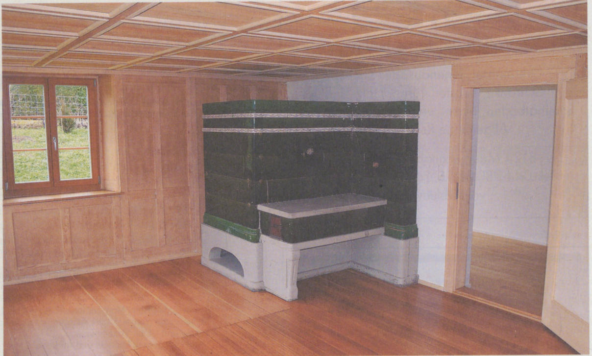
Im alten Wohnteil des Bauernhauses achtete man akkurat auf eine sanfte Renovation – sogar der Kachelofen (ohne Funktion) bleibt erhalten.

Zu spät würde man meinen. Das angerufene Verwaltungsgericht bestätigte danach aber den Rekurs und machte geltend, dass die Gemeinde den privaten Verein hätte automatisch informieren müssen. Die erteilte Baubewilligung wurde einstweilen aufgehoben. Inzwischen verstarb auch der projektierende Architekt, und alles verzögerte sich. Hausheer ärgert sich noch heute, denn er musste noch völlig unverschuldet Verfahrenskosten tragen. Das erneut eingereichte Baugesuch wurde nun definitiv im September 2013 unter Auflagen bewilligt.