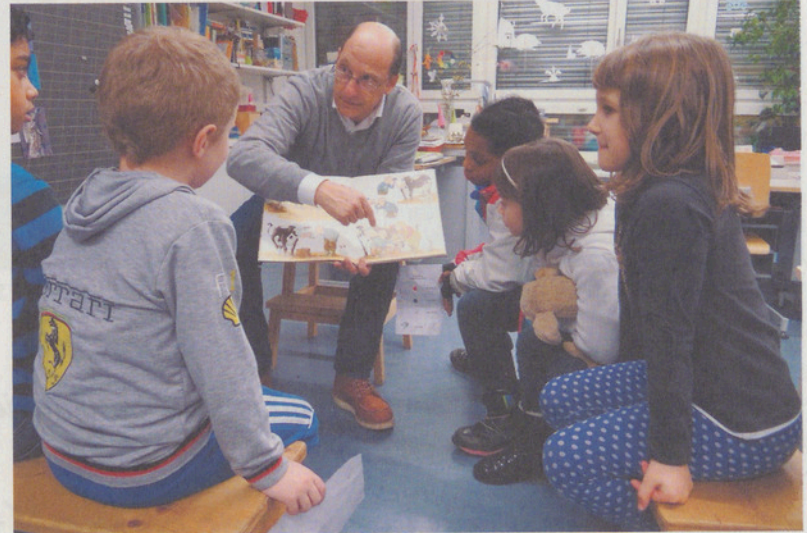
In Aesch lauschten Kinder der Geschichte der kranken Kuh Lieselotte.