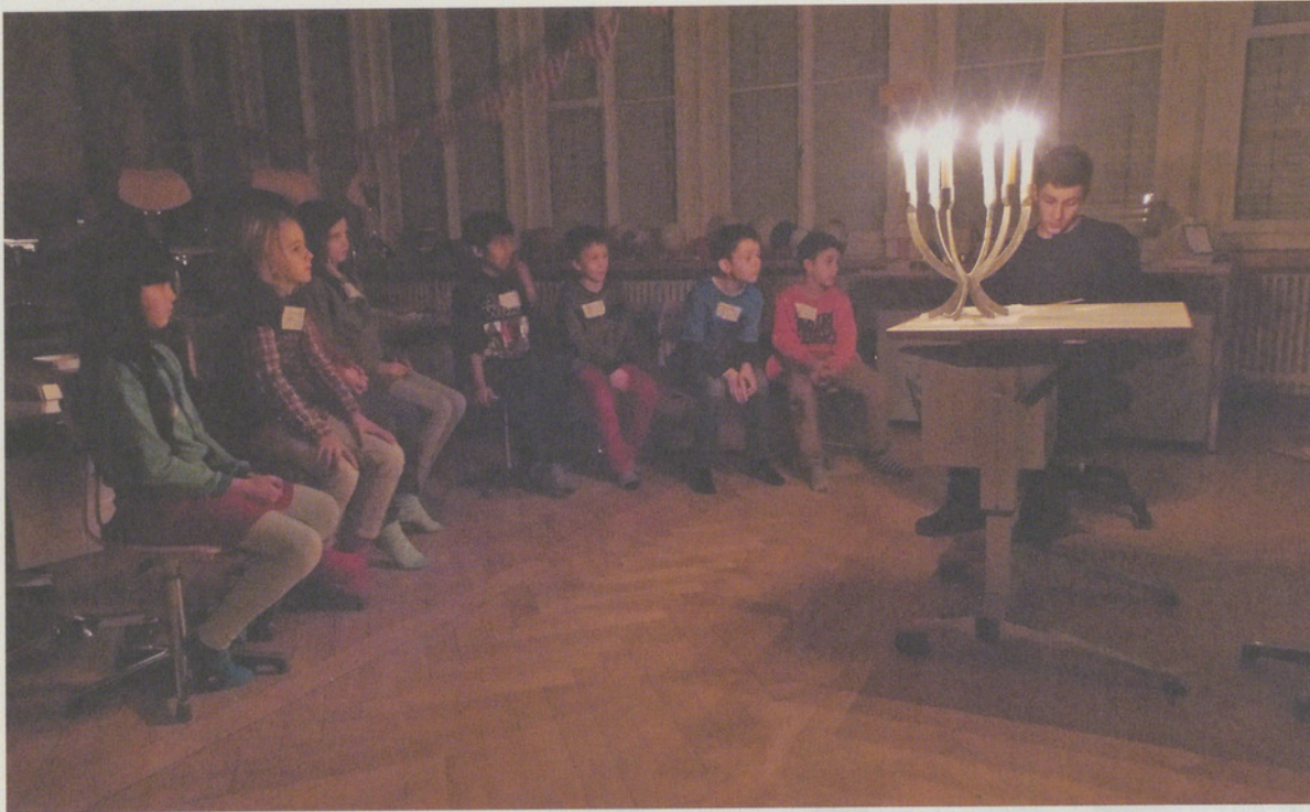
Oben: Gebannt lauschen die Kinder in Maur dem Erzähler.