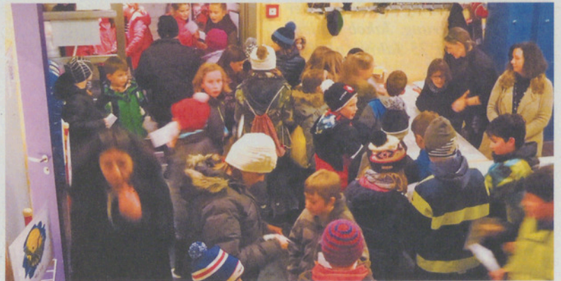
Jede Lesenacht ein grosser Organisationsaufwand.

Die Einteilung der Kinder ist ein grosser Aufwand. Die Kinder dürfen Wünsche anbringen; die Kinder-