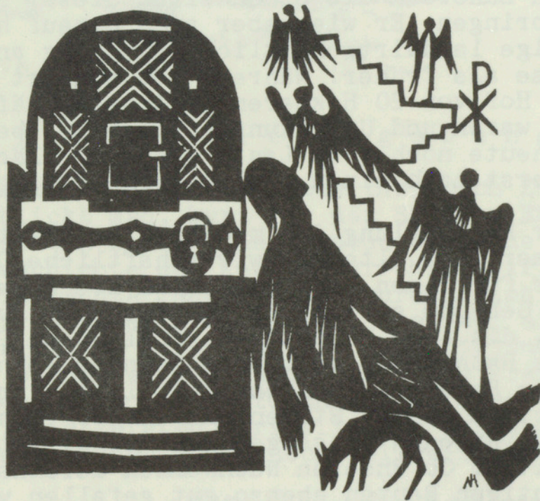
Die Vignette des Monats Das Gleichnis vom reichen und armen Mann Lukas 16,19.20

des einzelnen Bürgers, dem an der Erhaltung der historischen Bauten gelegen ist: Er kann in persönlichem Kontakt mit den Behörden seine Meinung vertreten, er kann für Bauordnungen und Zonenpläne eintreten die dem Alten eine Ueberlebenschance geben, und er kann, nicht zuletzt im Kreise von Natur- und Heimatschutz-Organisationen diese Ziele unterstützen.